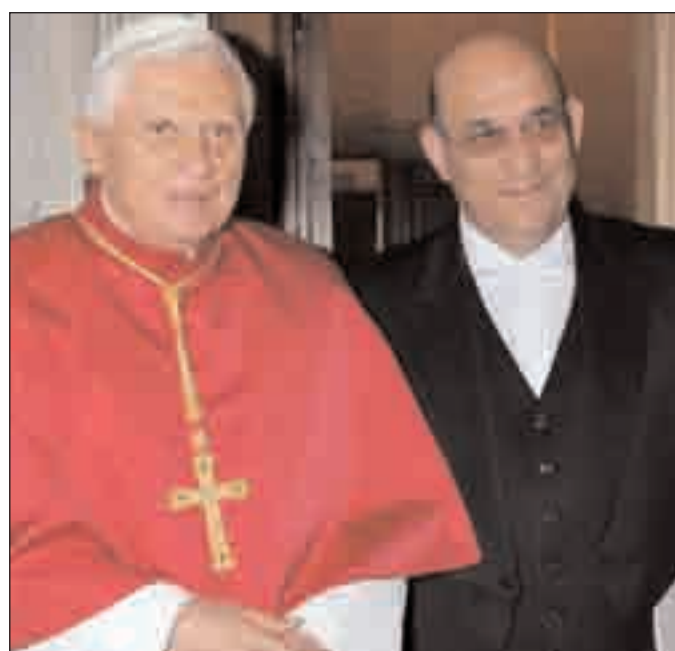
Il Papa Benedetto XVI e l'ambasciatore d'Israele

(1981 - 1985); Segretario e poi Consigliere di Ambasciata a Stoccolma (1985 - 1989); Vice Capo di Divisione presso il Ministero degli Affari Esteri (1989 - 1991); Console generale a Berlino (1991 - 1994); Ambasciatore in Thailandia (1994 - 1997); Vice Capo di Dipartimento presso il Ministero degli Affari Esteri (1997 - 2000); Ministro di Ambasciata a Berlino (2000 - 2004); Consigliere del Sindaco di Gerusalemme per le Comunità Religiose (2004 - 2008). È autore di molti articoli di carattere storico sui Cristiani e Gerusalemme.