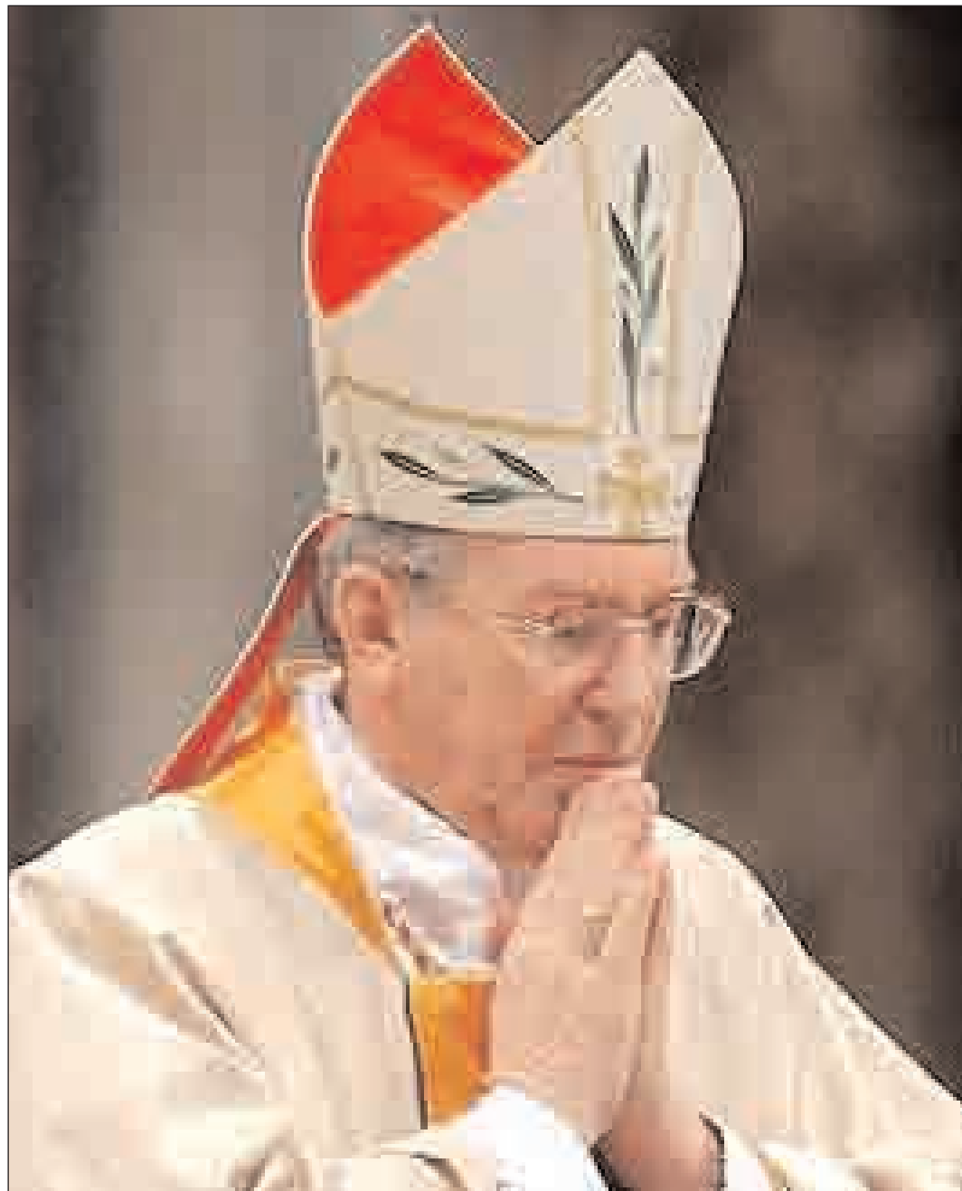
Il Cardinale S.E. Mons. Giovanni Battista Re