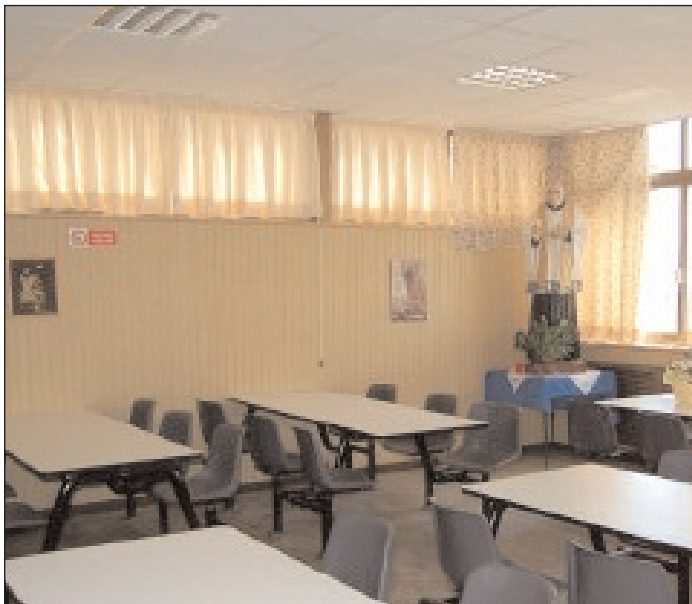
Il Centro Caritas diocesano che opera in Formia

dati emersi dai sedici incontri con i gruppi regionali Animatori Caritas, svoltisi nello scorso autunno, cui hanno partecipato quasi ottocento persone tra direttori e operatori delle equipe diocesane, 83% delle Caritas Diocesane in Italia. Metodo utilizzato da Caritas (ascoltare, osservare, discernere) continuamente presente nell'incontro, per analizzare insieme le varie realtà e riflettere sulla necessità di puntare sull'animazione nelle nostre comunità per far crescere il coinvolgimento delle stesse nell'azione caritativa della nostra Chiesa. La relazione di Don Giancarlo Perego, Responsabile Centro Documentazione di