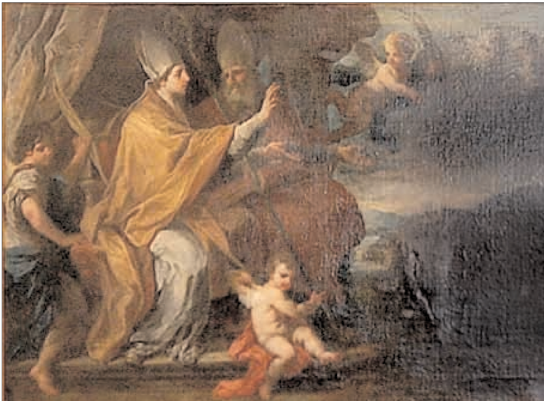
I santi patroni Erasmo e Marciano

« O Sant'Erasmo, ti veneriamo come martire di Cristo, ci gloriamo della tua presenza tra noi, e ti ringraziamo per il dono del Vangelo, che hai predicato nelle nostre terre. Tu, che sei