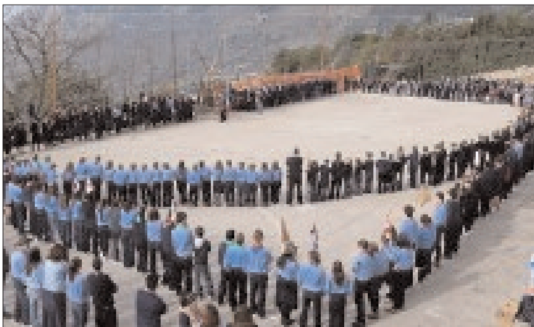
Gli scout diocesani riuniti nell'occasione a Lenola

significativo: ognuno deve guadagnarsi il suo equilibrio psicofisico per poter dare il meglio di se a favore del prossimo. Il pensiero e l'azione possano integrarsi in ognuno di voi per consentire di raccogliere copiosi i migliori frutti di coerenza cristiana e di offrirli in abbondanza al servizio del prossimo. Continuate senza timori la vostra strada di scout nella società attuale. Non dimenticate che non siete mai soli, il Cristo è con voi. Giunga a voi tutti la mia paterna benedizione. + Fabio Bernardo, Arcivescovo