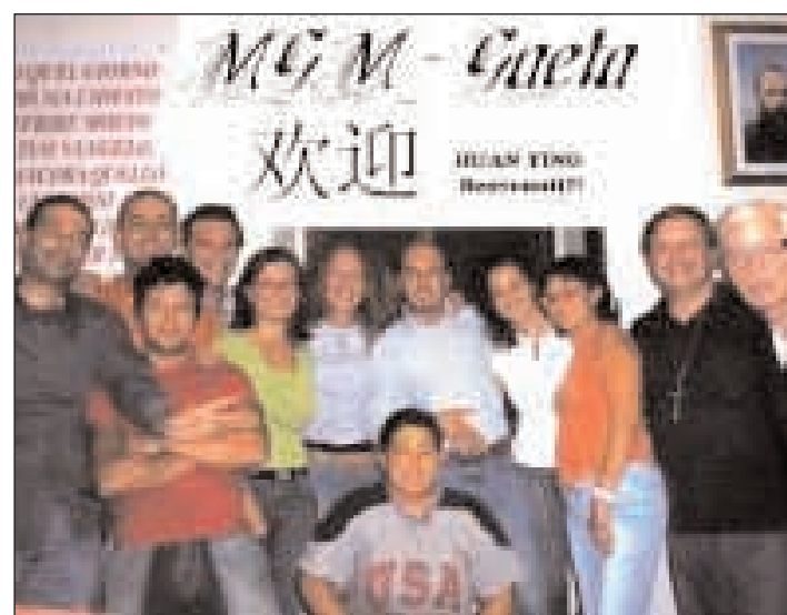
Il gruppo della Pastorale Giovanile

una risposta immediata e forte, di sostegno materiale e morale, alle famiglie e alle persone che vivono il dramma - privato e sociale - della perdita del posto di lavoro. Le proiezioni del 2009