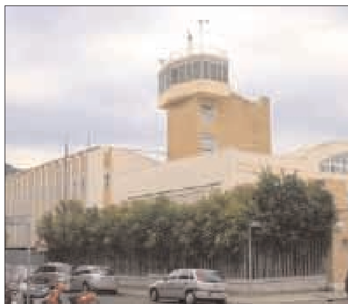
L'Istituto Nautico di Gaeta

potenzialità che, altrimenti, resterebbero inespresse. Gli organizzatori del convegno, che si svolgerà nell'ambito della "Settimana sociale" promossa dall'azione Cattolica Nazionale