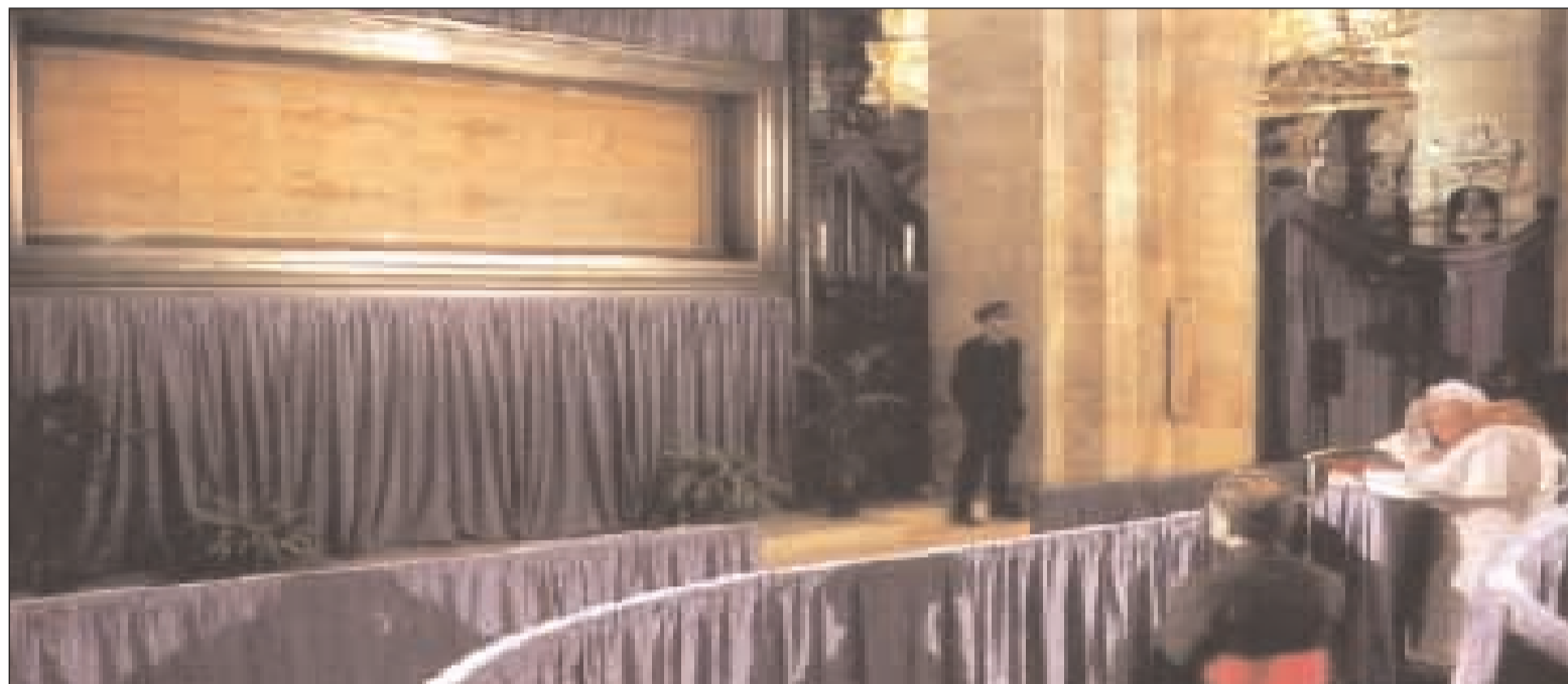
Giovanni Paolo II prega nel Duomo di Torino al cospetto della Sacra Sindone

L'immagine, come si scoprì nel 1898 quando la Sindone fu fotografata per la prima volta è più comprensibile nel negativo fotografico. Il corpo raffigurato appare quello di un maschio adulto, con la barba e i capelli lunghi. L'Uomo della Sindone presenta numerose ferite: le più evidenti sono le ferite ai polsi e agli avampiedi, compatibili con l'ipotesi che vi siano stati piantati dei grossi chiodi, e