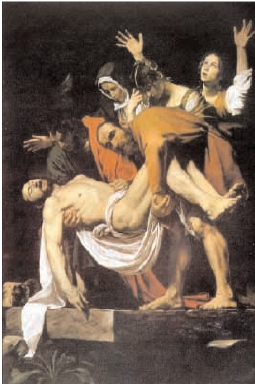
La Deposizione del Cristo come è stata rappresentata da Caravaggio

Questo è un telo molto più piccolo della Sindone (circa 84 x 53 cm), che non presenta alcuna immagine, ma solo macchie di sangue. È stato ipotizzato da chi sostiene l'autenticità sia di questa reliquia sia del telo di Torino, che questo sudario sia stato posto sul capo di Gesù durante la deposizione dalla croce, e poi rimosso prima di avvolgere il corpo nella Sindone, avendo quindi il tempo di macchiarsi di sangue, ma non quello per subire lo stesso processo di formazione dell'immagine della Sindone, qualunque questo sia stato. Il sudario sarebbe stato conservato a Gerusalemme fino al 614, poi trasportato in Spagna attraverso il Nordafrica;