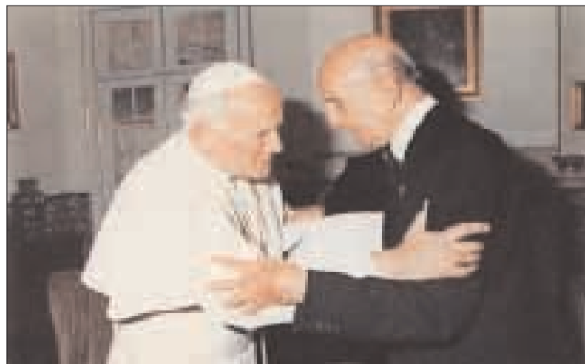
Umberto II di Savoia con Papa Giovanni Paolo II