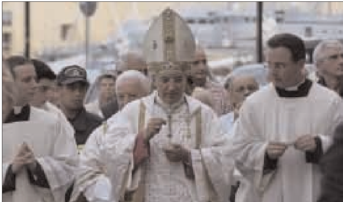
L'Arcivescovo ripreso durante una processione