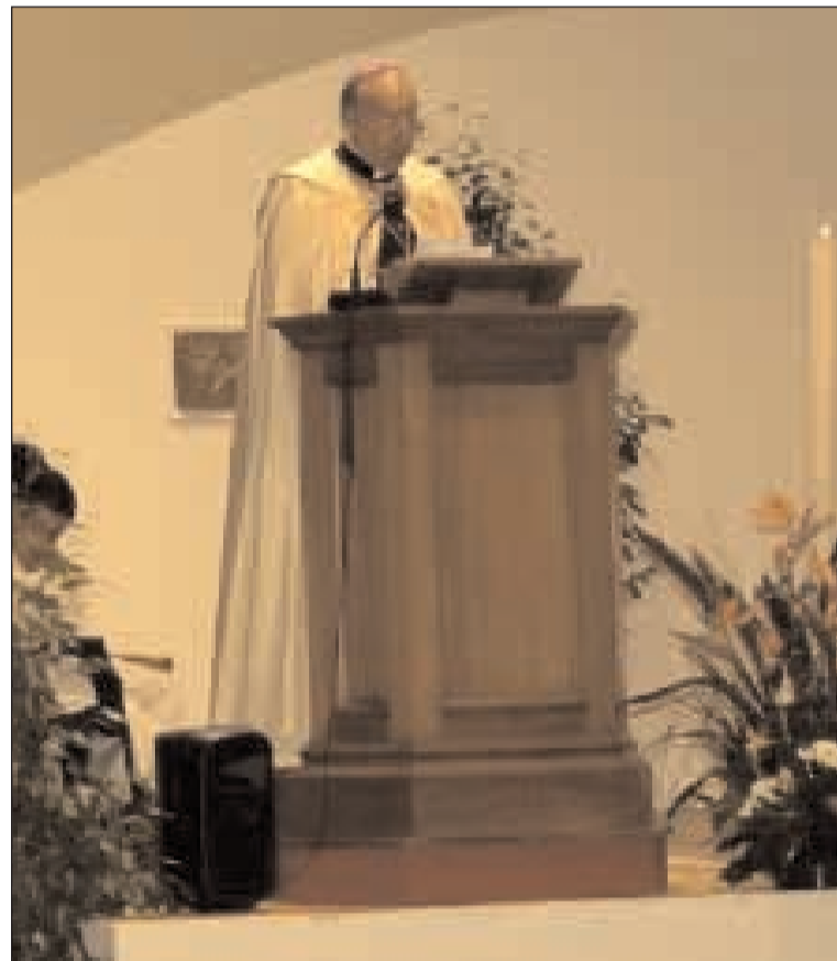
L'Arcivescovo dal pulpito dell'altare

re dimora nella vita di tutti noi per poterla restituire e arricchirla con la preghiera; come scriveva San Bernardo: "Dire di sì è già essere salvati". La Parola è il primo passo del cammino di fede, del pellegrinaggio con e verso la Chiesa. Oggi risulta difficile riu-