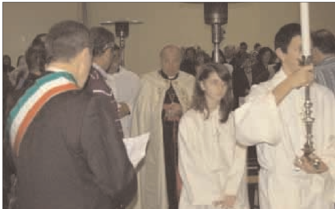
Due immagini della cerimonia tenutasi nella Tenda della Pace