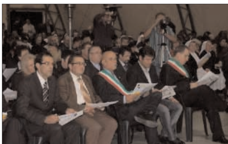
Le istituzioni presenti in prima fila

E ccellenza Reverendissima, autorità civili e militari presenti, fedeli e cittadini, nel secondo anniversario dell'ingresso in Arcidiocesi del nostro nuovo pastore, non posso che ringraziare il Signore per il grandissimo dono che ha voluto fare a tutti noi, ed in particolare alla chiesa di Gaeta. Ancora adesso ricordo il nostro primo incontro presso il Monastero di S. Benedetto a Montecassino, una visita semplice e cordiale, ma premonitrice della nuova iniziativa pastorale che da lì in poi avrebbe entusiasmato la nostra città e la sua antichissima Arcidiocesi. Alla stessa maniera non dimenticherò che, come promesso ed anticipato in quella mia prima visita, al momento del suo ingresso nella nostra città e, quindi, nell'Arcidiocesi, trovandomi impegnato come docente universitario a Betlemme, in quelle ore andai a pregare nella Basilica della Natività, esprimendo ancora una volta a Dio la preghiera di ringraziamento per il dono che egli aveva voluto fare alla nostra comunità. Fin dai primissimi gior-