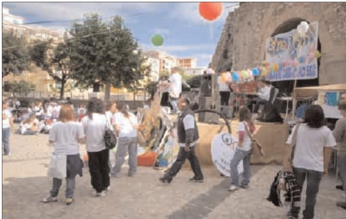
In piazza a Castellone

i ragazzi della diocesi con grande calore e disponibilità. Ringraziamenti e complimenti vanno alla comunità di Sant'Erasmus che da più di un mese ha lavorato ininterrottamente per la buona riuscita della festa. La gioia, l'entusiasmo, i sorrisi e la carica dimostrata dai 550 ragazzi sono sempre uno spettacolo e riconfermano la bellezza di un gratuito servizio educativo che in primis arricchisce chi ha fatto questa scelta. Concludiamo così come si è chiusa la festa: diamo a tutti appuntamento all'autunno 2010 quando ci sarà l'incontro nazionale tra acr e giovanissimi con il Santo Padre a Roma.