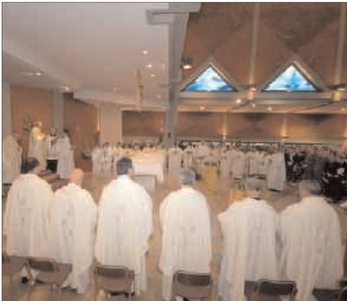
Apertura del Sinodo Diocesano in Gaeta

sulla cattedra di Pietro nel 1605. Governerà la Chiesa sino al 1621 e il suo primo atto papale fu quello di rispedire nelle loro diocesi i vescovi che soggiornavano a Roma, poiché il Concilio di Trento aveva ribadito che ogni vescovo doveva risiedere nella propria diocesi di appartenenza. Il secondo sinodo si deve al vescovo Carlo Pergamo (1771 - 1785) indetto il 26 ottobre 1779 e svoltosi tra il 12 e il 14 dicembre 1779. Un periodo storico particolare in quanto dieci anni dopo il 14 luglio 1789 vi sarà la presa della Bastiglia, prologo della rivoluzione francese, considerata l'inizio dell'era moderna. Santo Padre a Roma era Pio VI, che governerà la Chiesa dal 1775 al 1799. L'ultima volta che la chiesa di Gaeta ha visto un sinodo è stato prima dell'ultimo conflitto mondiale con uno dei pastori più longevi che abbia avuto, ovvero Mons. Dinigio Casaroli (1926 - 1966) che ha organizzato l'assemblea sinodale dal 14 al 16 ottobre 1934. Era Pontefice Pio XI, che con i Patti Lateranensi dell'11 febbraio 1929 chiuse il contenzioso tra lo Stato Italiano e la Santa Sede che durava dalla presa di Porta Pia del 20 settembre 1870. L'attuale sinodo diocesano è, quindi, sia il