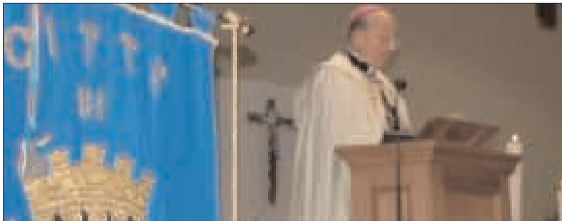
L'Arcivescovo sul pulpito. Alla sua destra il gonfalone della Città di Formia