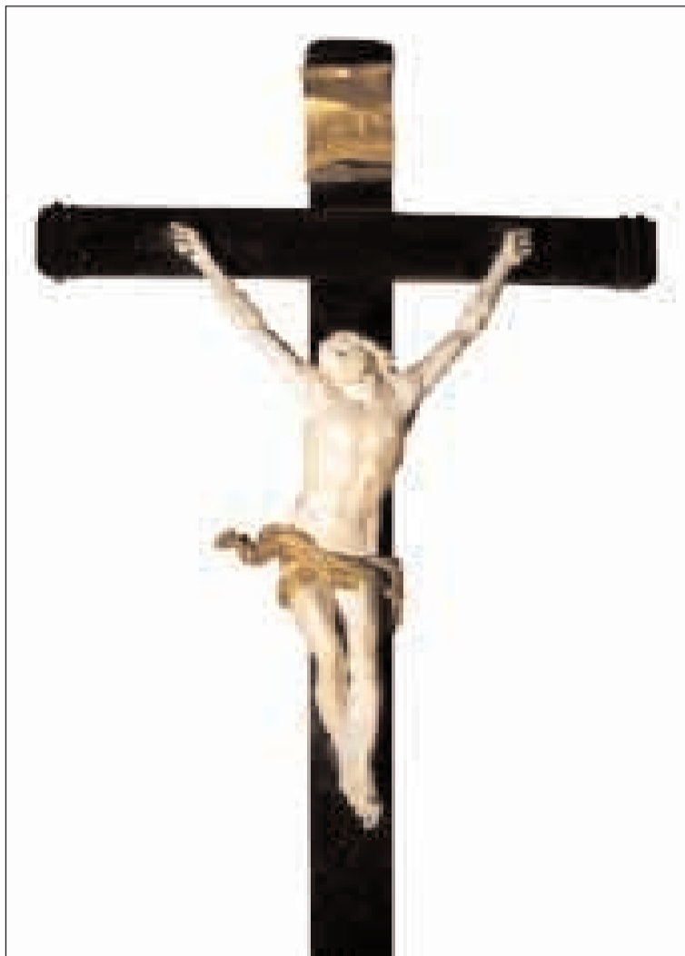
Il Crocefisso donato alla Cattedrale di Gaeta da Papa Pio IX

S e l'ispirazione fa da supporto all'arte, certo nessun soggetto offre all'ispirazione artistica tanto fecondo alimento come la Crocifissione. Se Cristo non è soltanto il fondatore di una religione, egli è per chi crede in lui, al tempo stesso Dio e uomo. E Dio significa pienezza, bellezza, armonia, ricchezza. Nello stesso tempo l'uomo Cristo, risuscitando dai morti, diventa il presente nel tempo e nella storia. Egli viene a riempire ogni lacuna per dare risposta appagante e soddisfazione piena ad ogni anelito. In questa realtà, unica nel suo genere, l'artista sente l'esigenza intima di rappresentare non una persona del passato, ma il Presente, che diventa proprio perché Dio, essenzialità del presente, dell'intera storia ed anche sua proiezione. Ci dice l'evangelista Giovanni che il Verbo, la Parola eterna, si è fatta carne: così l'icona di Cristo - uomo lascia spazio al genio, alla fantasia, alla immaginazione per poter riproporre nell'immagine il Figlio di Dio, che è come recita il Salmo 45 «il più bello tra i figli dell'uomo e sulle sue labbra è diffusa la leggiadria». L'evangelista Giovanni nel descriverci Gesù come pastore usa in greco l'aggettivo ho kalòs che significa bello: Gesù è quindi il pastore bello e se è bello, affascina e attira allora è