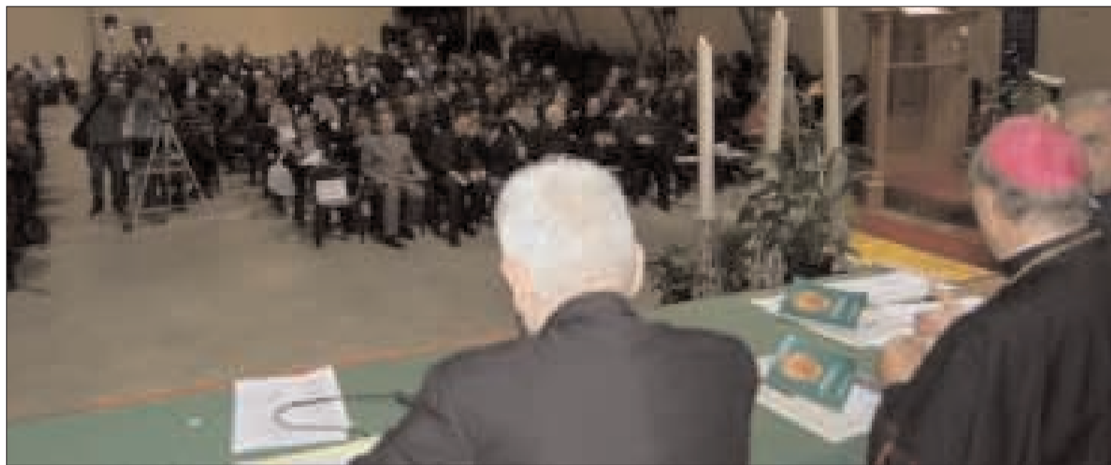
Il tavolo di presidenza allestito per la presentazione dell'Esortazione pastorale