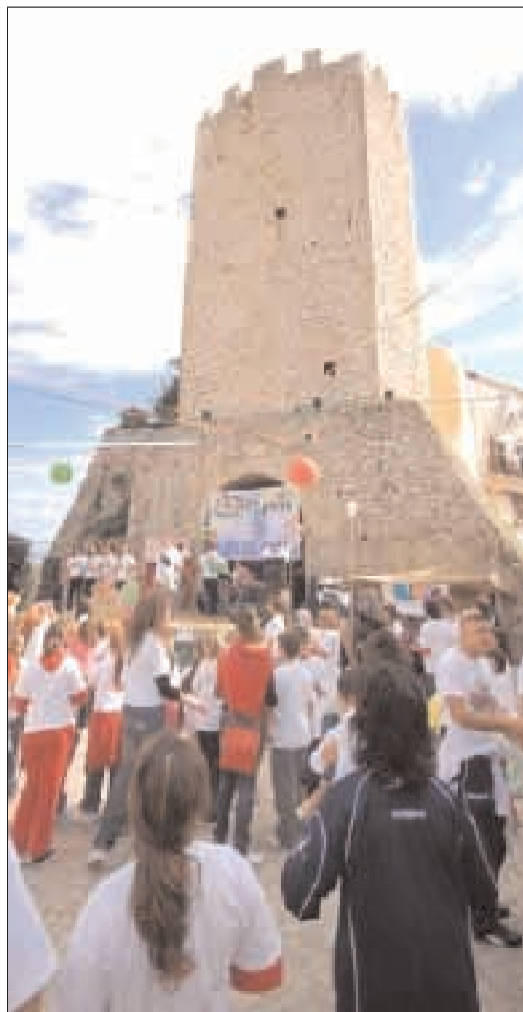
Momenti di giochi

dono la lunga vita dell'acr con i suoi diversi cammini annuali e quanto è stato realizzato nel corso del tempo. Durante la mattinata i ragazzi accompagnati dai loro educatori sono stati divisi in gruppi secondo la fascia di età e sono stati impegnati in attività di circa 45 minuti sul pezzo della radio che il loro gruppo rappresentava: la manopola, l'antenna, l'altoparlante, la barra di frequenza e l'energia. Nel pomeriggio hanno ricomposto tutti i pezzi della loro radio