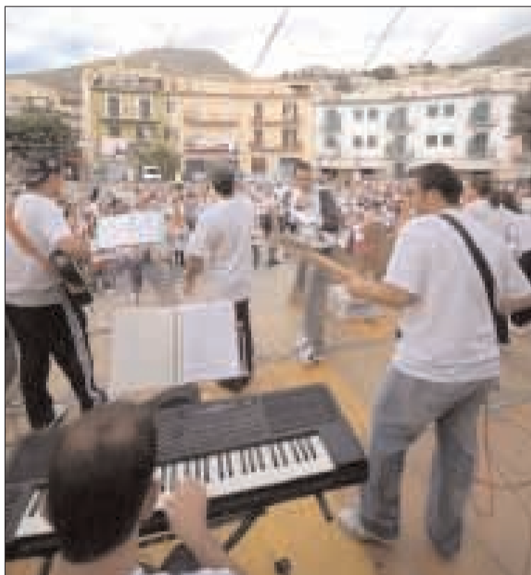
C'è spazio per la musica

L'inizio del nuovo cammino annuale, uno dei momenti più forti dell'anno, un'occasione di aggregazione e di divertimento, la manifestazione che unisce le singole parrocchie che fanno la diocesi come comunità di persone unite da un unico credo e un unico spirito: questo e tanto altro è la festa del ciao big. La festa organizzata dall'equipe diocesana è destinata a tutti i ragazzi dell'acr dai 5 ai 14 anni e si svolge ogni anno in una piazza diversa della diocesi per coinvolgere a turno tutte le località del territorio. Per il 2009-2010 è stata scelta Formia, in particolare piazza Sant'Erasmus e l'intero rione coinvolgendo l'omonima parrocchia e la comunità di Santa Teresa - Madonna del Carmine. L'evento quest'anno è stato ideato e organizzato grazie ad una collaborazione diretta con i responsabili e gli educatori delle parrocchie della forania di Formia che si sono messi in gioco e hanno speso il loro tempo e la loro fantasia per il bene dei ragazzi. Un risultato strepitoso per un numero di circa 550 ragazzi e 130 educatori che si sono ritrovati domenica 25 ottobre presso la chiesa della Madonna del Carmine per il saluto iniziale dell'Arcivescovo Mons. Fabio Bernardo D'Onorio e la santa messa celebrata dagli assistenti diocesani dell'acr Don Antonio Guglietta e Don Giuseppe Di Mario. Una chiesa gremita di ragazzi che hanno condiviso la parola del Signore, hanno cantato