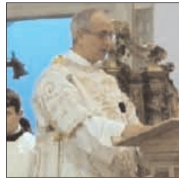
Il diacono proclama il Vangelo

combattono aspramente per la loro sopravvivenza. La situazione è così drammatica e preoccupante, che le nazioni opulente ritengono indispensabile alla loro sicurezza una milizia armata composta da trenta milioni di soldati. Oggi esiste già una convergenza planetaria su un unico dio cercato e riverito: l'interesse economico. È un funesto monoteismo con le sue norme, quelle del mercato; con le sue vittime sempre più numerose tra gli oppressi e i diseredati della terra. Le religioni non possono rimanere indifferenti dinanzi a tanti soprusi.