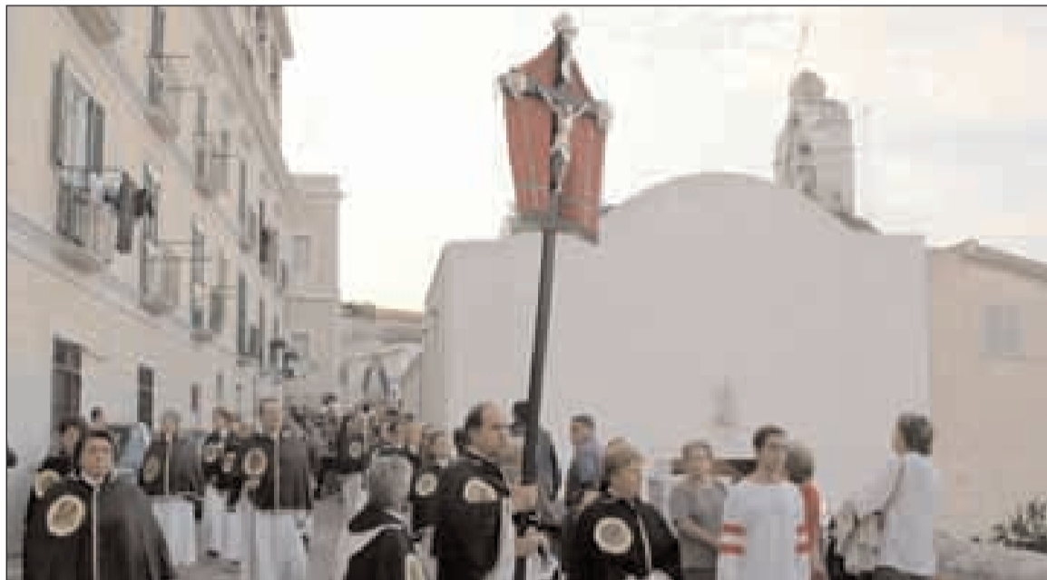
Un momento processuale della Confraternita del Rosario di Gaeta