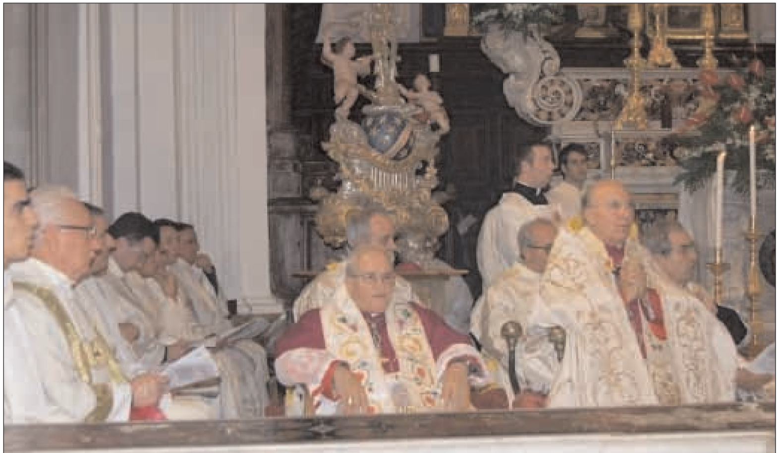
In pagina due immagini dell'Arcivescovo S.E. Mons. Fabio Bernardo D'Onorio con, alla sua destra, l'Arcivescovo Emerito S.E. Mons. Pier Luigi Mazzoni

E ccoci nuovamente al termine di un anno: un altro cerchio temporale si chiude e ci invita a riflettere sul tempo che inesorabilmente fugge e ci sfugge. Vale anche per noi, che chiudiamo questo 2009, l'amara considerazione del poeta Ungaretti rivolta ai soldati che cadevano sul Carso durante la prima Guerra mondiale: «Si sta, come d'autunno sugli alberi le foglie». Con la speranza di non morire mai del tutto, ci aggrappiamo ora alla giovinezza, ora all'amore, ora alla ricchezza, ora ai figli, ora al successo. Anche il poeta latino Orazio faceva leva sulla sua opera letterario quando scriveva: «Non morirò del tutto, ho eretto con la mia poesia un monumento più duraturo del bronzo!». «L'uomo non è che un soffio e i suoi giorni sono ombra che declina» ripete la Bibbia e su questo tutti, credo, dobbiamo convenire! Il poeta romanesco Giacchino Belli con lievità ironica rivolgendosi a suo figlio così scrive in un sonetto: «Er tempo, fijo, è peggio di una lima, rosica sordo sordo e s'assottija, che gnissun giorno sei quello de prima». Tutti avvertiamo questa lima, che sottilmente ci assottiglia presenze, salute, sentimenti e infine interrompe la nostra stessa vita. Ecco perché la saggezza degli antichi metteva a grossi caratteri su orologi e meridiane frasi come questa: «Homo, scis horas - Nescis horam - Vulnerant omnes - Ultima necat». «O uomo conosci le ore, ma non quell'ora: tutte feriscono ma l'ultima uccide». E la paura