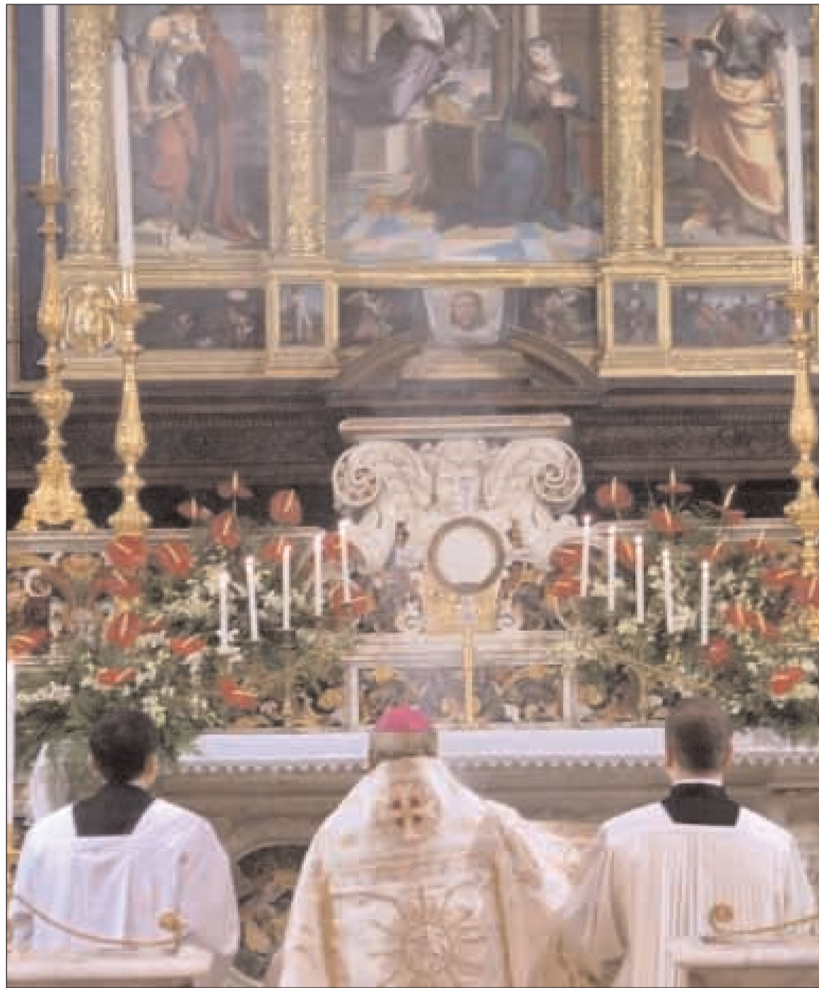
L'Arcivescovo durante il Te Deum nel Santuario della Santissima Annunziata di Gaeta in adorazione dinanzi al Santissimo