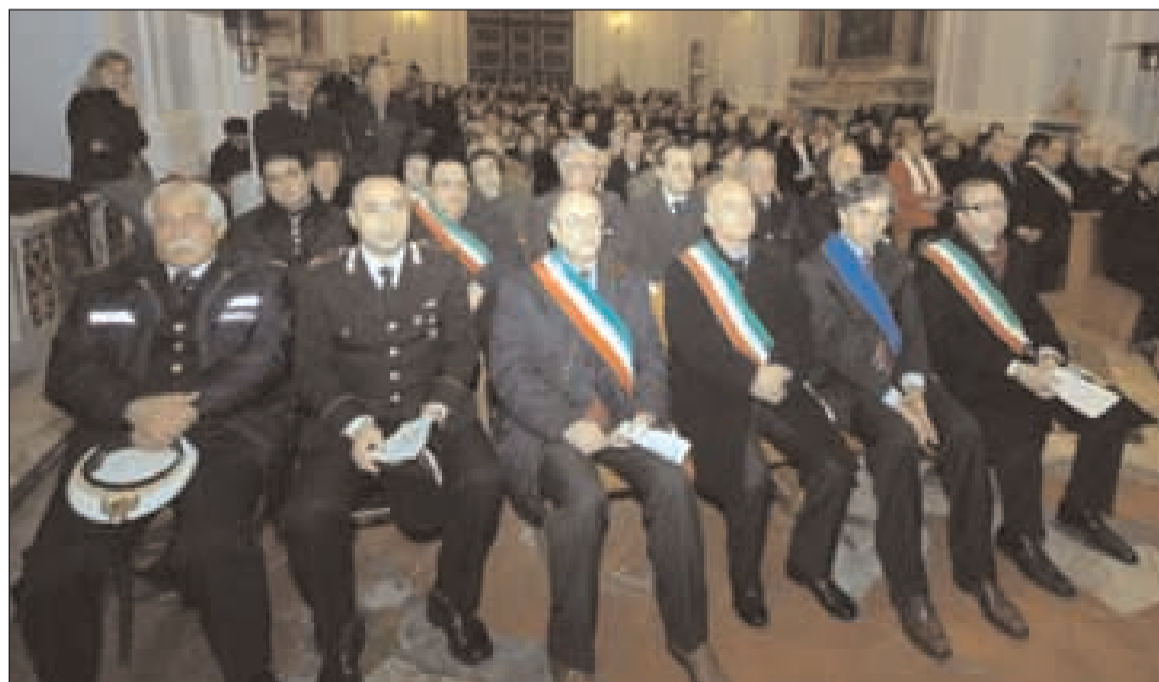
Particolare dei fedeli presenti al Te Deum

tanto da fermarsi ad accarezzarli. Una vita in comune con i parenti e discepoli e l'esperienza affettiva vissuta con loro fu così intensa da chiamarli amici e da piangere per la morte di uno di essi. Gesù