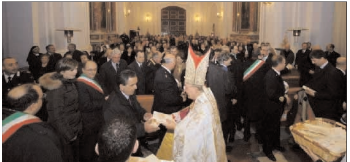
L'Arcivescovo distribuisce il testo del Te Deum a tutti i presenti