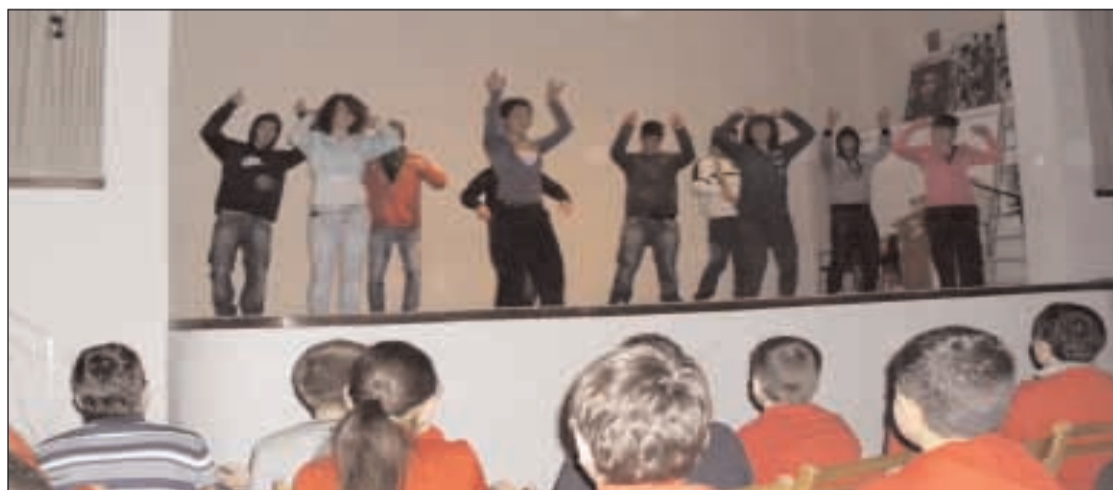
Un momento della rappresentazione che ha allietato la serata

I n occasione della giornata in cui la Chiesa celebra la Santa famiglia di Betlemme l'Azione Cattolica della comunità di Santa Teresa D'Avila e Madonna del Carmine hanno promosso una serata interamente dedicata alle famiglie. Il Papa proprio il 27 dicembre durante l'Angelus ha ricordato: "Ricorre oggi la domenica della Santa Famiglia. Possiamo ancora immedesimarci nei pastori di Betlemme che, appena ricevuto l'annuncio dall'angelo, accorsero in fretta alla grotta e trovarono "Maria e Giuseppe e il bambino, adagiato nella mangiatoia" (Lc 2,16). Fermiamoci anche noi a contemplare questa scena, e riflettiamo sul suo significato. I primi testimoni della nascita del Cristo, i pastori, si trovarono di fronte non solo il Bambino Gesù, ma una piccola famiglia: mamma, papà e figlio appena nato. Dio ha voluto rivelarsi nascendo in una famiglia umana, e perciò la famiglia umana è diven-