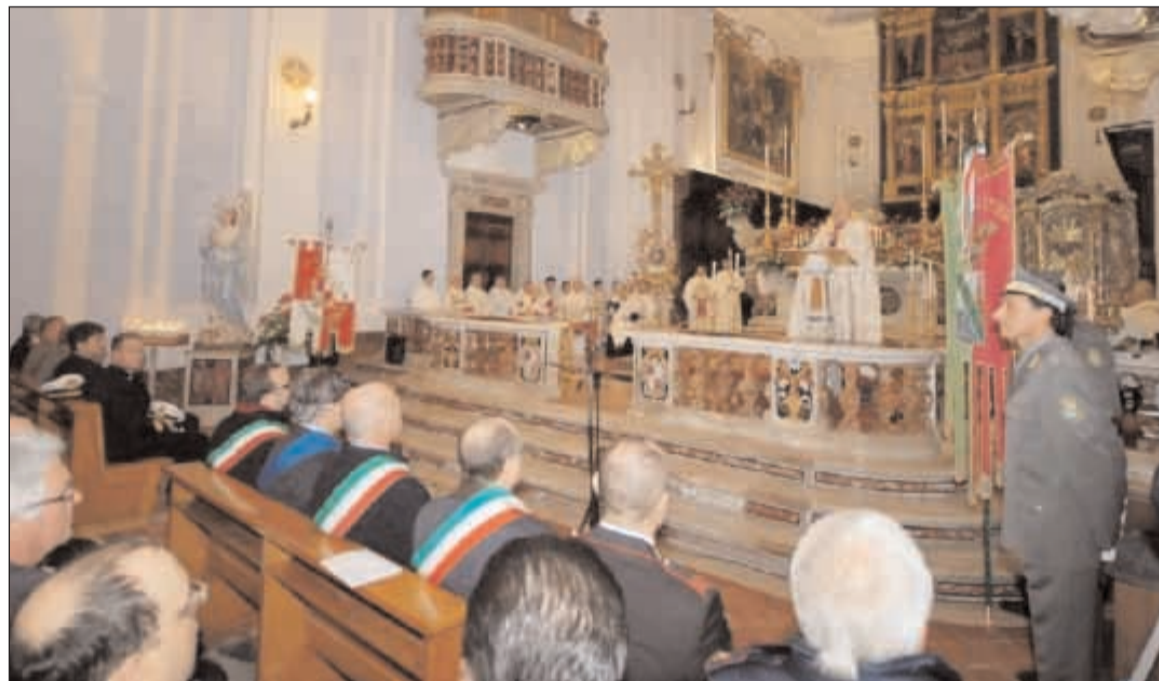
Nell'immagine le prime file dei banchi occupati dalle autorità, ai lati i gonfaloni di Gaeta e della Provincia di Latina

La vita di Gesù Cristo è stata una vita buona, bella e beata