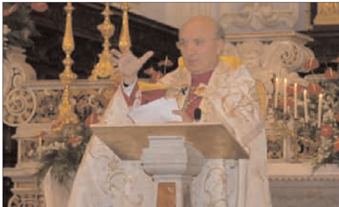
Un'espressione dell'Arcivescovo durante la sua omelia

Le piaghe d'oggi: alcol, sesso sfrenato, droga e gioco