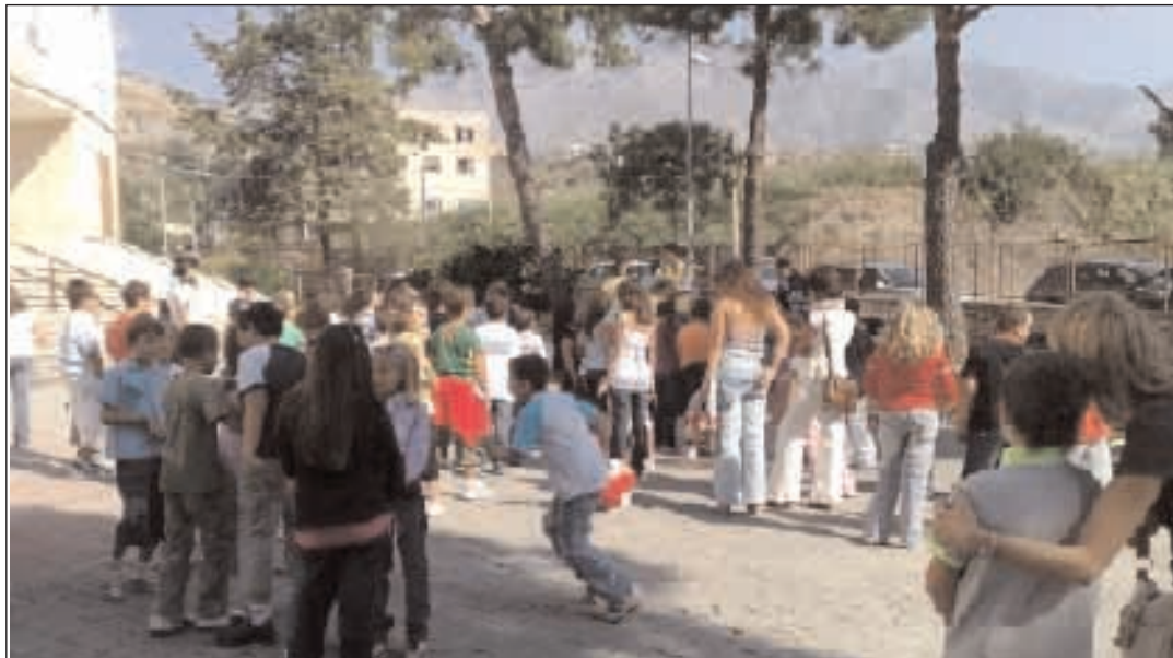
Il cortile antistante il primo circolo didattico De Amicis di Formia ha ospitato la due giorni della Festa del Ciao

Come ogni anno l'inizio delle attività annuali dell'Oratorio della Parrocchia Santi Lorenzo e Giovanni Battista di Formia coincide con il "Mese del Ciao". Ciao è il più semplice e diretto dei saluti che i ragazzi conoscono, segno della loro spontanea accoglienza, di quel modo genuino di allargare le braccia agli amici che, fermi alla porta, stentano a fare il primo passo. A conclusione di questa prima tappa del cammino di settembre, durante la quale i ragazzi acquistano familiarità con il tema che li accompagnerà per tutto l'anno, si celebra concretamente questo desiderio di aprirsi all'accoglienza dell'altro attraverso un momento di fraternità, che prende forma nella nota "Festa del Ciao", che offre la possibilità di vivere due giornate all'insegna del sano divertimento, della voglia di giocare e stare insieme, coinvolgendo quanti più amici è possibile. Come da programma, sabato 26 settembre alle ore 16.30, dopo lunghi giorni di fervidi preparativi, è cominciata la festa all'insegna dello slogan "Siamo in Onda" che sintetizza il cammino che l'Acr