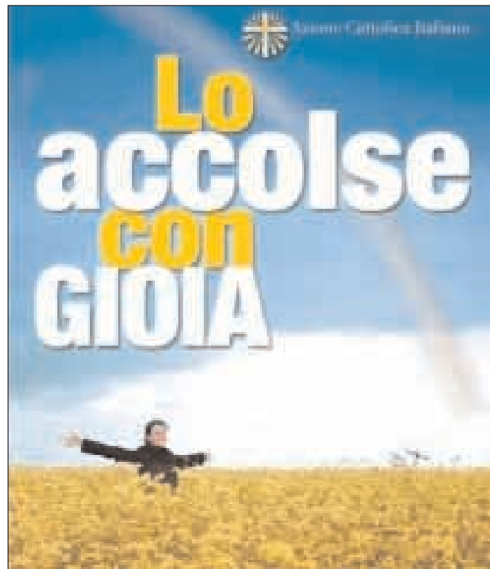
La locandina della ripresa di un nuovo anno associativo

è la realtà parrocchiale e di conseguenza al percorso formativo di Azione Cattolica. I lineamenti della festa non sono ancora del tutto noti; in via ufficiosa essa consisterà in una serata, quella di Venerdì 23 Ottobre, nella quale senza impegno i giovani del paese potranno incontrarsi non solo per parlare con molta tranquillità in un luogo "diverso", ma avranno modo anche e soprattutto di divertirsi. Quindi lasciamo con il cuore l'invito a tutti i giovani delle due comunità parrocchiali di Monte San Biagio, con l'augurio di vivere una serata piacevole, diversa dalle altre, sperando di lasciare