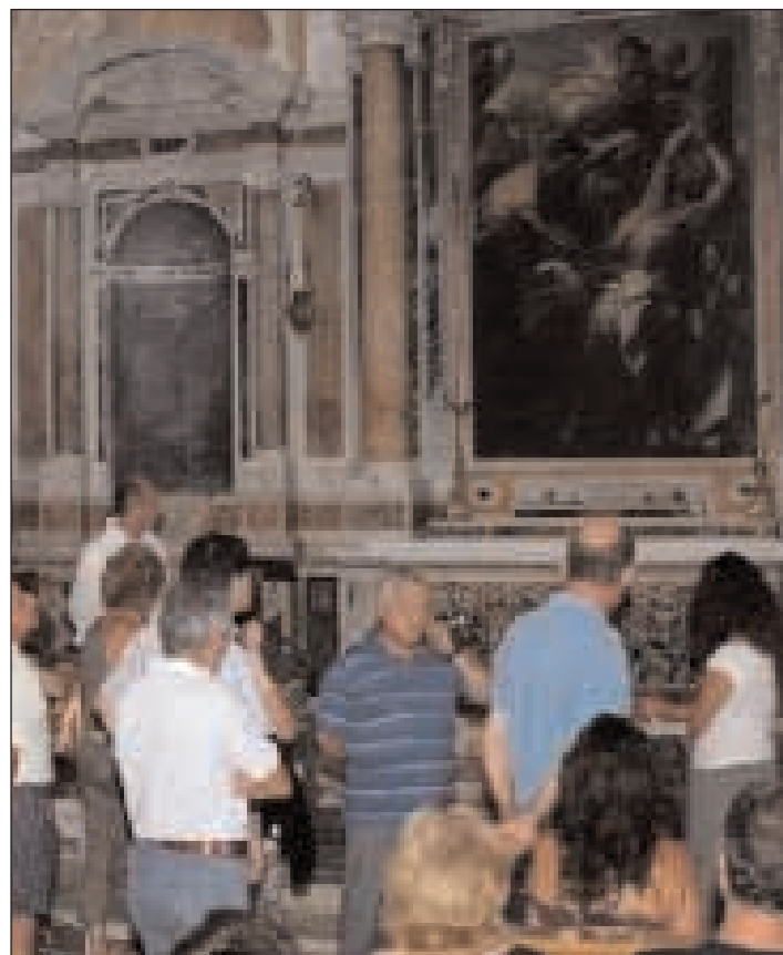
Visitatori nella Cripta della Cattedrale di Gaeta

gode dell'unanime consenso della Chiesa, della società civile e delle istituzioni. Da non trascurare che la loro disponibilità si tramuta, anche, per le giovani coppie in un sensibile risparmio economico, oltre a garanzie livelli di sicurezza indiscutibili. Nessun dubbio quindi sulla dovuta importanza del ruolo svolto dai nonni all'interno delle famiglie e della società in generale, anche nella società attuale, protagonista dell'inizio del terzo millennio cristiano. A tutti loro e ai loro adorati nipotini va l'attestato sincero di tutta la Chiesa diocesana e la benedizione bene augurante del loro Arcivescovo.