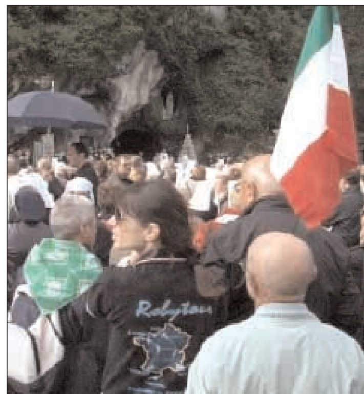
Il Roby Tour al santuario di Lourdes

Honfleur, a Parigi, Lione, Nizza e di nuovo Gaeta, a bordo del furgone di assistenza ai motociclisti. Quindi ieri, dopo aver fatto un giro per la città, con don Antonio Cairo, i centauri sono stati presenti alla funzione religiosa, che è seguita alla consegna de «La Candela della Pace», alla presenza anche dell'Arcivescovo S.E. Mons. D'Onorio. Un'esplicita richiesta avanzata dai centauri, provenienti dalle province di Latina, di Frosinone, di Caserta, di Napoli, di Salerno, di Chieti e di Rimini.