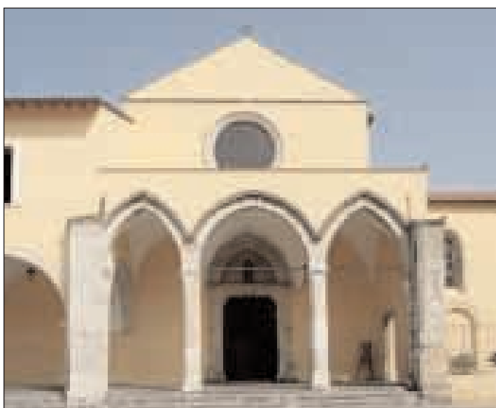
La Chiesa di San Francesco a Fondi