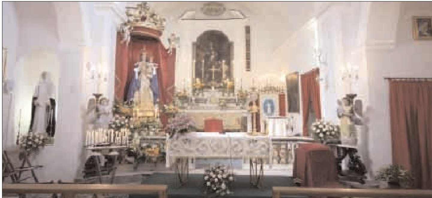
La Chiesa della Madonna del Rosario in via Aragonese a Gaeta