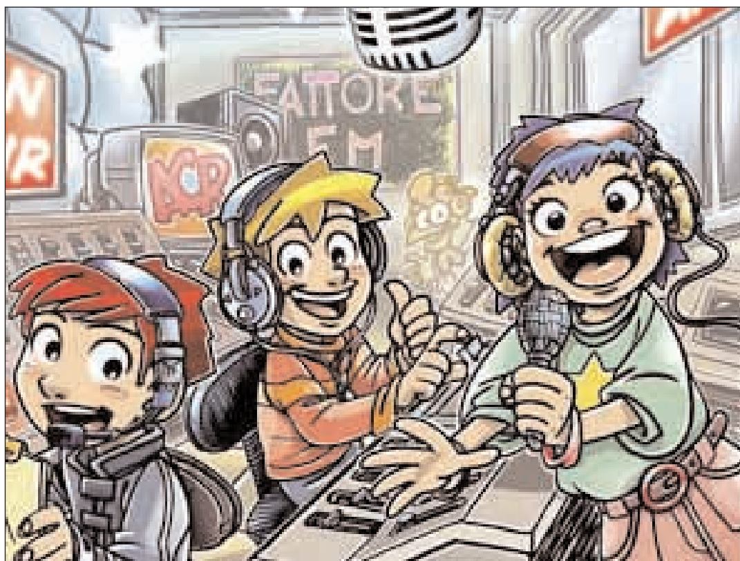
Siamo in onda

All'interno della tematica generale valida per tutti i soci "Lo accolse con gioia" l'Ac propone un cammino per ogni settore. L'Ac dopo aver passato un anno a riflettere con i ragazzi sui propri sogni e desideri passa al tema della novità. L'ambientazione dell'anno è la radio: "È l'immagine della Radio che accompagnerà i ragazzi e gli educatori nel nuovo anno targato ACR. Il ricercare la frequenza giusta, la musica ok, il programma con il dj preferito, il mettersi in ascolto e comunicare sono solo alcuni degli ingredienti del cammino. La radio è un mezzo di comunicazione usato e conosciuto dai ragazzi: a strada, a casa, con il cellulare, il lettore mp3, nelle loro orecchie arrivano le onde sonore delle trasmissioni radiofoniche e i brani dei loro cantanti di successo. Ti accompagna dovunque tu vada, ti può essere compagna mentre fai altre cose (c'è chi studia ascoltando la musica). Attraverso la radio c'è chi comunica e chi ascolta, chi trasmette e riceve, c'è chi cerca e chi si fa cercare; chi ascolta e chi ha qualcosa da dire.