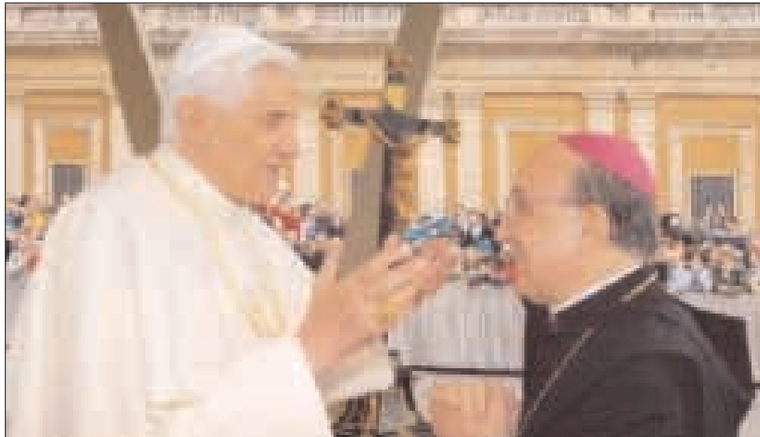
Il Santo Padre Benedetto XVI con l'Arcivescovo Mons. D'Onorio

C arissimi amici, ci ritroviamo in questo secondo appuntamento di catechesi fissato per la prima domenica del mese, in riflessione sul senso e sul valore della vita umana. Papa Ratzinger ha parlato recentemente di «inquinamento etico» individuando in esso una forma di malattia presente nella nostra società. Abbiamo varie forme di inquinamento, ma sicuramente quello indicato dal Papa è ciò che porta alla lenta distruzione dell'uomo e del mondo. L'inquinamento etico è il marcio nei rapporti sociali, la disonestà, i sotterfugi, i complotti a danno di un terzo, il fare di tutto per ricavare guadagni a danno del prossimo, approfittare dei più deboli e degli indifesi, far passare il male per bene, abusare dei propri poteri, usare gli altri come mezzo e, più in generale, seguire la legge della propria utilità personale anche a danno di un altro essere umano. E' necessario pertanto andare alla radice del problema: la formazione di una giusta coscienza morale e la conseguente ricaduta che le nostre azioni hanno sulla vita e in tutti gli ambiti della società. Come possiamo formarci una coscienza retta e orientata al Bene? Se l'uomo smarrisce il senso di Dio, cioè