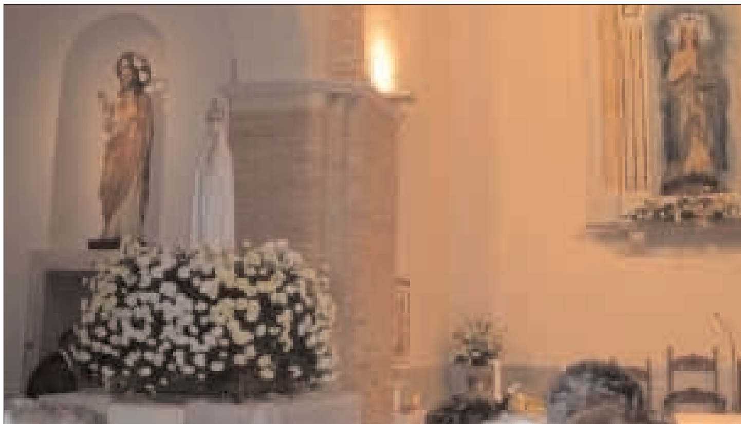
La statua pellegrina nella Chiesa dell'Immacolata di Scauri