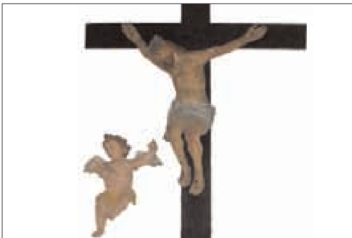
La croce esposta nella Cappella del Rosario in via Aragonese a Gaeta

N acque a Roma il 6 gennaio 1786. Da subito mostrò una religiosità fuori del comune basata sulla preghiera e sulla penitenza. Ordinato sacerdote il 31 luglio 1808, continuò nelle sue attività di apostolato tra i più bisognosi. Avviò da subito progetti di evangelizzazione verso i trasportatori e i contadini della campagna romana. Il sacerdote avviò le sue pratiche religiose proprio in un momento difficile per la chiesa romana, da lì a poco il Papa Pio VII fu imprigionato dalle truppe napoleoniche (6 luglio 1809). Lo stesso Gaspare subì l'occupazione francese, il 13 giugno 1810 si rifiutò di giurare fedel-