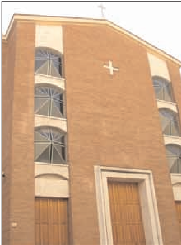
La Chiesa parrocchiale della Madonna del Carmine in Formia