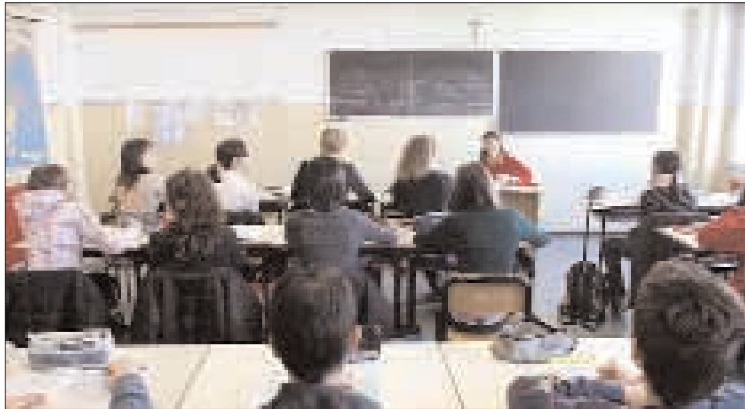
In scuola tra i banchi per divenire cittadini maturi e rispettosi della cultura multi-etnica

P ace, ambiente, sviluppo e diritti umani. Sono questi i temi del confronto Caritas - Scuole attivato dall'ufficio 'Mondialità' del sodalizio diocesano. In seguito alla positiva esperienza degli anni passati la Caritas diocesana di Gaeta promuove, anche per l'anno scolastico 2009 - 2010, presso tutte le scuole della diocesi, dei corsi relativi all'educazione alla 'Mondialità e alla Interculturalità'. La partecipazione ai corsi è completamente gratuita e, una volta stabiliti gli obiettivi specifici (ove richiesto anche tramite Pof, acronimo per piano offerta formativo, "ad hoc") sarà possibile selezionare gli opportuni sussidi audiovisivi inerenti ai temi prescelti. La Caritas diocesana di Gaeta, col suo ufficio "Mondialità", promuove questa iniziativa in tutte le scuole, ma anche nelle parrocchie della diocesi. Nelle scuole i corsi saranno svolti di preferenza nelle singole classi, per seguire meglio i singoli alunni. «È comunque - spiegano dal centro ascolto san Vincenzo Pallotti - sempre suggerito un coinvolgimento di tutto l'istituto». È bene programmare almeno un incontro mensile, della durata di un'ora. Pace, ambiente, sviluppo, diritti umani. Sono i quattro temi che suggeriamo attraverso percorsi didattici che privilegino atteggiamenti di solidarietà e cittadinanza attiva.