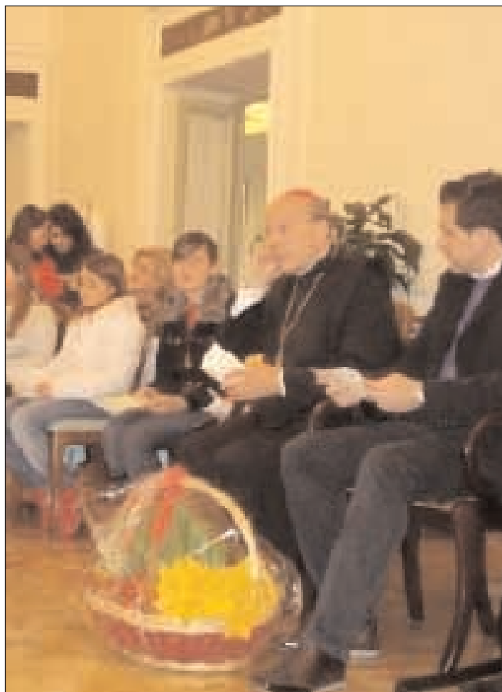
L'Arcivescovo Mons. D'Onorio in mezzo ai giovani

A vere dei momenti di formazione personale lontano dalla città e dalle proprie realtà per spezzare il tran tran quotidiano e fermarsi a pensare è indispensabile. Proprio per questo l'AC punta sui campi scuola estivi come occasioni forti per trascorrere delle esperienze uniche che possano lasciare il segno e gettare un piccolo seme. L'Arcidiocesi di Gaeta prevede per l'estate 2009 esperienze per qualsiasi età diversificate tra loro ma comunque significative per il proprio percorso di vita oltre che spirituale. Partendo dai più piccoli anche quest'anno sia i campi parrocchiali che interparrocchiali di ACR che si svolgeranno durante tutto il periodo estivo seguiranno il sussidio nazionale "Tu seguimi" improntato sulla figura di Pietro. Lungo un percorso strutturato in modo specifico per un campo scuola, anche l'esperienza estiva può diventare una forte opportunità di incontro e dialogo con il Signore: un'occasione di svago e di nuovi incontri. L'apostolo Pietro accompagnerà i ragazzi nel cammino di ricerca che li porterà a vivere la bellezza dell'essere discepolo nella propria esperienza quotidiana. Anche i giovanissimi e i giovani posso-