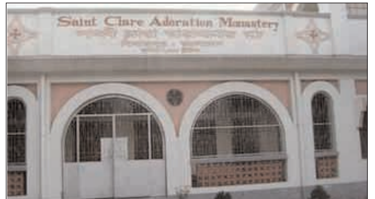
Il Monastero delle Clarisse di Dinajpur Dacca

sono consegnate a vivere per Cristo, nascoste in Lui, donate per la Chiesa che cresce: sono come le radici che nutrono la pianta. Le radici non si vedono, ma senza di loro la pianta muore. Per questo motivo la Chiesa ha proclamato come protettrice delle Missioni Santa Teresa del Bambino Gesù, dottore della Chiesa. Questa giovane carmelitana è vissuta nel suo convento a Lisieux, donando a Dio le sue preghiere e le sue sofferenze per sostenere i missionari. Infine le monache offrono al Signore, Agnello immolato per l'umanità, la loro vita, unendosi a questa offerta. Abbiamo visitato il monastero dove vivono 11