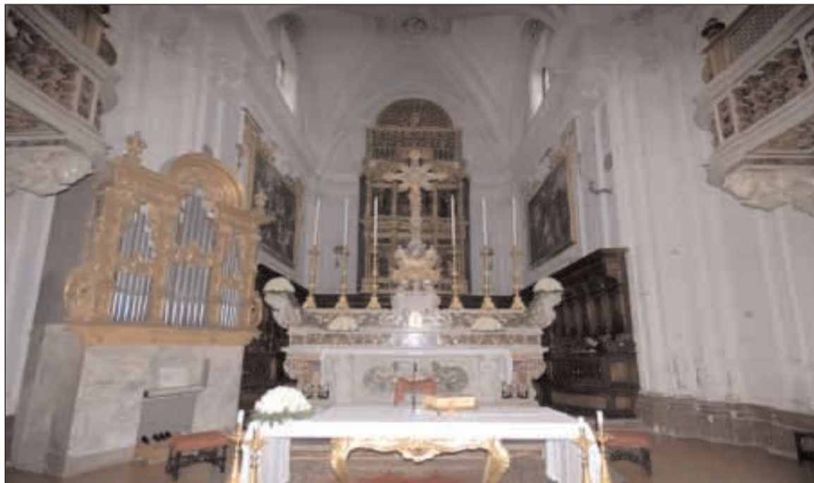
L'organo del Santuario dell'Annunziata prima del restauro

L o storico evento di questi giorni riferito al prestigioso organo del Santuario della SS. Annunziata, ci permette di indicare alcuni temi relativi allo strumento: le sue origini, la sua storia, comprese le sue vicissitudini non proprio positive del secolo scorso. Nel 1677 a causa di una crisi economica la Santa Casa dell'Annunziata è costretta a ridurre il progetto del 1674 commissionato a Dionisio Lazzari: le due cantorie, previste in marmo, vengono costruite in legno e di due organi se ne realizza soltanto uno. Alla metà degli anni Ottanta del Seicento venne realizzato il nostro organo ad opera di Giuseppe de Martino. Tra le poche persone che ebbero accesso alla cantoria figurerebbe anche il famoso compositore Alessandro Scarlatti (1660 - 1725). Durante la permanenza di Carlo di Borbone in Gaeta organista dell'Annunziata era il maestro Francesco Antonio Merenna (1730 - 1760): proprio all'inizio del suo mandato suonerà l'organo per il futuro Carlo III di Spagna. Forse in questo periodo verrà aggiunta la pedaliera. Dopo trent'anni di onorato servizio il Merenna voleva lasciare il posto di organista al figlio Martino, ma per varie questioni l'organo sarà affidato a Pasquale dell'Aquila fino al 1785. Solo allora Martino Merenna divenne organista e incise la sua firma sul coperchio della tastiera (datandola, però, al 1760). Nel 1840 l'organo venne restaura-