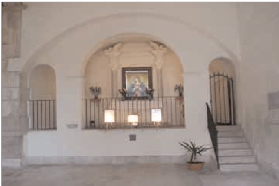
La cappella di Santa Maria de la Soledad all'interno della Porta Carlo V

re d'Inghilterra Edoardo VII fa visita al re Vittorio Emanuele III. Il 1915 fu una data storica per la posa del primo blocco del molo sommergibili e la costruzione del nuovo porto militare che rappresenteranno nel tempo una grossa realtà economica e sociale non solo per Gaeta ma per l'intero golfo. La mostra, resterà aperta la mattina e il pomeriggio fino all'8 dicembre, è ricompresa anche nell'ambito delle iniziative promosse dalla Marina Militare di Gaeta per la ricorrenza della patrona Santa Barbara.