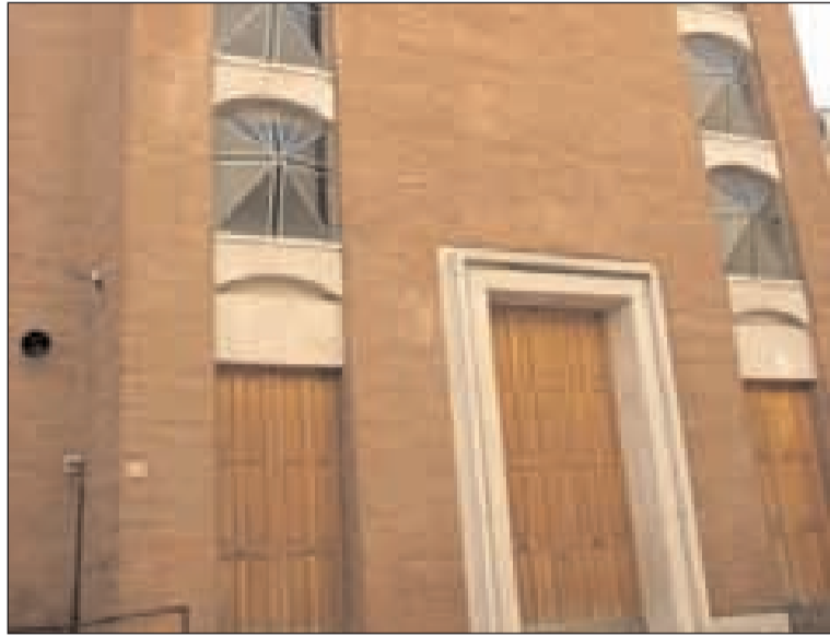
La Chiesa Madonna del Carmine di Formia

M artedì 8 dicembre la Chiesa celebra la ricorrenza dell'Immacolata Concezione. Per accogliere in un modo diverso e profondo, in un pieno raccoglimento Maria nei nostri cuori presso la Chiesa della Madonna del Carmine dopo la messa vespertina sarà possibile partecipare ad una veglia di preghiera. Il momento è stato organizzato e curato dal gruppo giovani di Ac Madonna del Carmine-Santa Teresa D'Avila. Prendendo spunto dal percorso formativo annuale dell'associazione dal titolo "Lo accolse con Gioia" l'intera