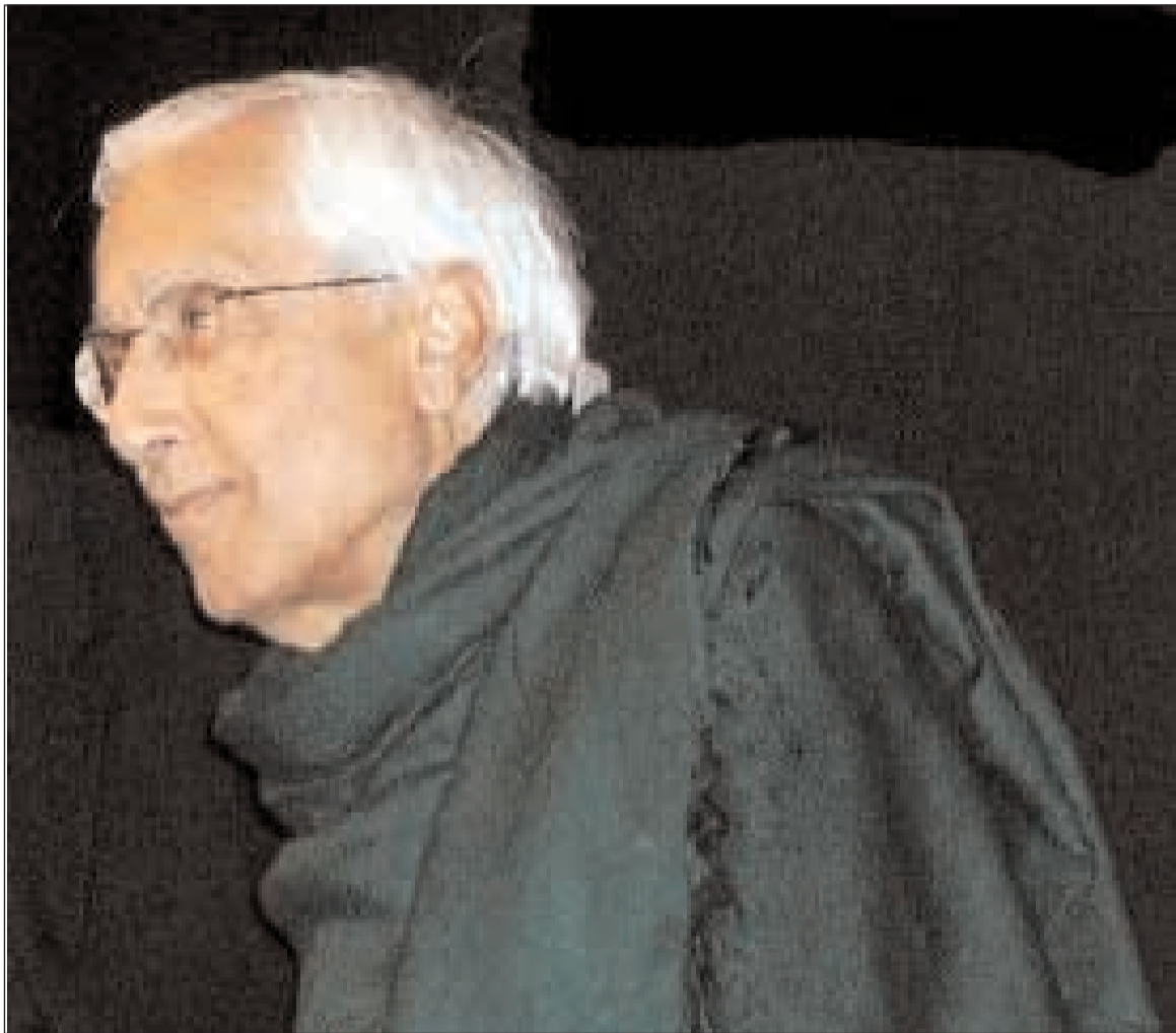
Il sacerdote, filosofo e sociologo spagnolo Raimon Panikkar, citato dall'Arcivescovo nella sua omelia come attenderle nel tempo intermedio. Il quando avverranno è adesso: il cristiano non evade, ma abita il quotidiano, intercede, letteralmente cammina in mezzo, cerca di rialzarsi continuamente da dentro, cosa significa attendere; è il tempo più sacro, più creatore, più felice. Attendere allora è infinito del verbo amare. Tutte le creature attendono, anche il grano attende la nuova spiga, le pietre

S iamo nel tempo liturgico chiamato Avvento e la parola ha, nella sua radice latina il significato di venire accanto, farsi vicino. E' il tempo in cui tutto si fa più vicino: Dio si fa vicino all'uomo, l'altro si fa vicino a me e io mi faccio più vicino al mio cuore. Allora a ben pensarci è sempre tempo d'Avvento, è sempre tempo di abbreviare distanze e di conquistare vicinanza. Avvento è allora quel tempo magnifico che sta tra il gemito delle cose e la venuta di Cristo, è la lunga ora tra le doglie e il parto, è il tempo di riacquistare la vista soprattutto quella interiore, di cui ci ha parlato il Vangelo di Matteo riguardo ai due ciechi che andavano dietro Gesù urlando la guarigione dalla cecità. In ogni tempo Dio giudica il mondo e lo trova lontano. Ma invece di sdegnarsi è lui stesso che si carica delle distanze, si incarica di tutti i passi. Dio ha giudicato l'uomo e l'ha trovato lontano. E invece di condannarlo si pone in cammino a ricucire i lembi della lontananza. Il Signore giudica me e mi trova con il cuore