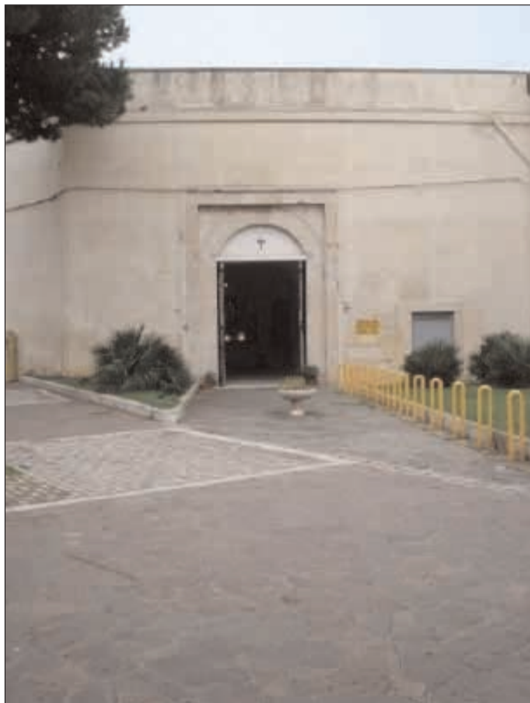
L'ingresso alla Porta Carlo V

Una interessante mostra fotografica dal titolo "Gaeta e la Marina" è in corso a Gaeta fino a martedì prossimo presso un sito suggestivo e di alto valore storico, la Porta Carlo V- Cappella di Santa Maria di Soledad nel quartiere medievale. Il monumentale accesso principale alla città, costituito da un grande androne fra due porte, venne posto proprio da Carlo V sotto un'opera di protezione molto ben organizzata chiamata la "Cittadella". Proprio lì nel 1660 il generale spagnolo che governava la piazza di Gaeta Don Alonso De Monroy edificò una cappellina alla Madonna, facendovi sistemare un quadro della vergine Addolorata, che gli spagnoli onorano sotto il titolo di Santa Maria di Soledad. Della sua manutenzione si è da sempre occupato il personale della Marina Italiana. Ed il legame forte e indissolubile, storico, sociale, economico che lega la città di Gaeta alla Marina Militare dal 1861 ai giorni nostri, è il tema della mostra fotografica, realizzata grazie al contributo dell'Ufficio Storico MM, e che vuole essere senza alcuna pretesa, un viaggio nel tempo e nella memoria alla riscoperta di luoghi e percorsi, oggi profondamente mutati, ma sempre presenti nel cuore e nel ricordo dei promotori della lodevole iniziativa, un gruppo di amici militari e civili, amanti della propria città, delle proprie tradizioni e della Marina Militare. Un lavoro di passione e di volontariato, sostenuto dalla preziosa e necessaria collabora-