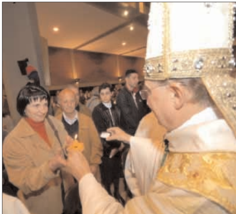
L'Arcivescovo e i laici nel corso dell'apertura del Sinodo Diocesano

In sintonia con lo spirito del Sinodo diocesano, cammino da percorrere insieme per un risveglio di fede e di prassi, la Consulta Diocesana delle Aggregazioni Laicali propone a tutti i laici un percorso formativo per... essere sale e luce per risplendere di opere buone e belle secondo il desiderio del Signore Gesù... (Mons. Fabio Bernardo D'Onorio). Il percorso proposto, vuole essere occasione per ritrovarsi, fermarsi insieme e riscoprire due caratteristiche fondamentali dei discepoli di Gesù: l'essere sale della terra e luce del mondo, per poter celebrare nella liturgia il mistero di Cristo morto e risorto, annunciarlo come Vangelo vivente e testimoniarlo abitando nel mondo per costruirne la storia come storia di uomini amati dal Signore. Le immagini del sale e della luce sono complementari e ricche di senso. Nell'antichità, sale e luce erano ritenuti elementi essenziali della vita umana. «Voi siete il sale della terra...». Una delle funzioni primarie del sale è quella di dare condimento agli alimenti. Quest'immagine ci ricorda che, mediante il battesimo, tutto il nostro essere è stato profondamente trasformato, perché "condito" con la vita nuova che viene da Cristo. Il sale è la grazia battesimale che ci ha rigenerati, facendoci