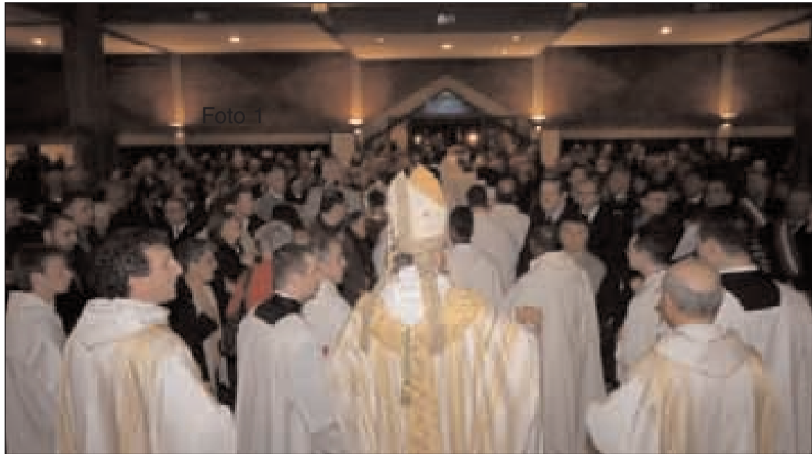
L'Arcivescovo S.E. Mons. Fabio Bernardo D'Onorio al termine di una funzione religiosa