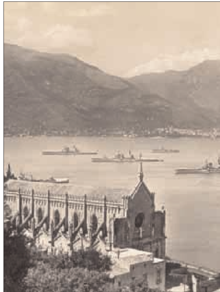
La Flotta navale nella rada di Gaeta in una foto del '38

pizzico di orgoglio, il ruolo importante che Gaeta ha rivestito insieme alla Marina Militare nella storia dell'ultimo secolo". La sequenza fotografica è costituita da circa 140 scatti, che ripercorrono un periodo storico che va dal 1913 circa ai giorni nostri, riscoprendo l'importanza della base della Marina Militare e della rada di Gaeta, che ogni anno ospitava la squadra navale, per importantissime manovre