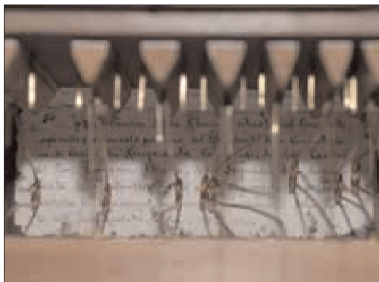
Cartiglio ricordo del trasferimento del 1927 dietro i ventilabri