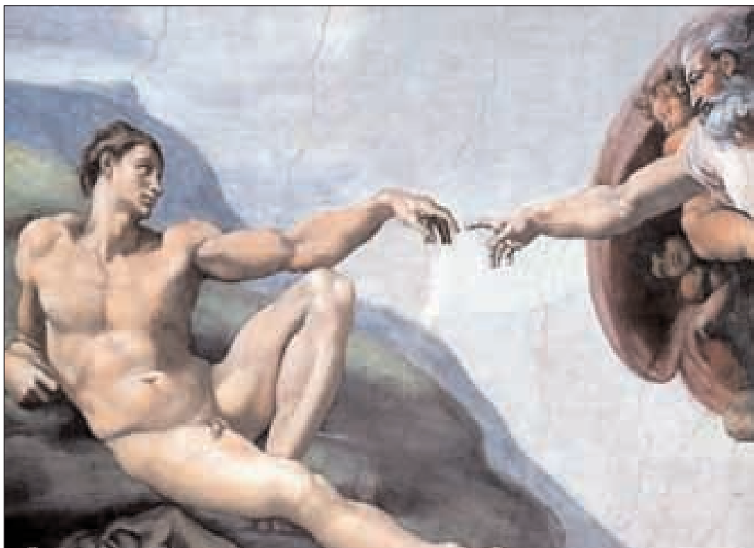
Michelangelo, la Creazione di Adamo

energie morali e spirituali quando è adeguatamente custodita, e viene detta redenzione, con riferimento al rapporto della creatura col trascendente, ma è anche liberazione storica per gli oppressi, che persistono nella confidenza nel Dio, che è, appunto, il Goel, ovvero il Liberatore storico. Che i cultori di una fede consumistica possano realizzare, grazie al Sinodo Diocesano, un rapporto più vero e più autenticamente filiale col Signore del cielo e della terra, e tutti noi credenti, un po' più provveduti spiritualmente, si possa essere vivamente incentivati a tendere verso un impegno di testimonianza alla fede che sia autenticamente maturo e coerente rispetto alle convinzioni che la chiesa, negli anni, ha suscitato nei nostri animi, rendendoci un servizio prezioso, che deve ispirarci una sempre maggiore e più autentica fedeltà verso la chiesa appunto, connotante l'intera nostra esistenza, si da influire anche sui lontani dalla fede. E l'auspicio è che tanti possano essere guadagnati ad essa.