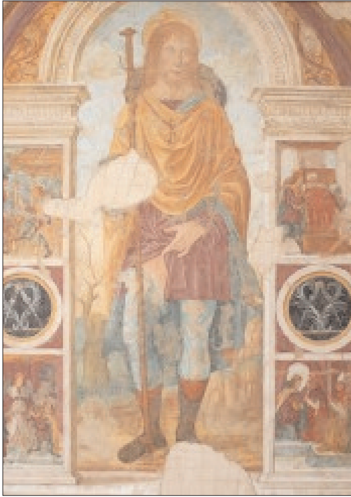
Affresco di San Rocco

atti della visita pastorale redatti da Mons. Giuseppe Zino, notaio e persona di fiducia del vescovo, si evince che Mons. Pignatelli rilevò che il luogo di culto in esame aveva l'altare maggiore con il coro ligneo e gli altari di San Sebastiano con la statua in argento dello stesso santo, oltre all'altare di San Rocco e quello del Rosario. La rappresentazione dell'affresco è stata già pubblicata su questo stesso settimanale il 21 febbraio scorso a illustrazione di un servizio a firma del direttore del museo diocesano don Antonio Punzo; in questa occasione, invece, facciamo cenno ad alcune immagini "secondarie" presenti nella pittura quattro - cinquecentesca. Prima di tutto parliamo dell'emblema ai lati del santo: un tondo nero con due simboli sovrapposti, un compasso e di una coppia di rami di palma su una linea di piano. Il compasso, nel quattrocento, era usato come simbolo dai costruttori di cattedrali. Ma a livello allegorico, il compasso è anche segno di armonia, che la stessa malattia può compromettere e ledere.