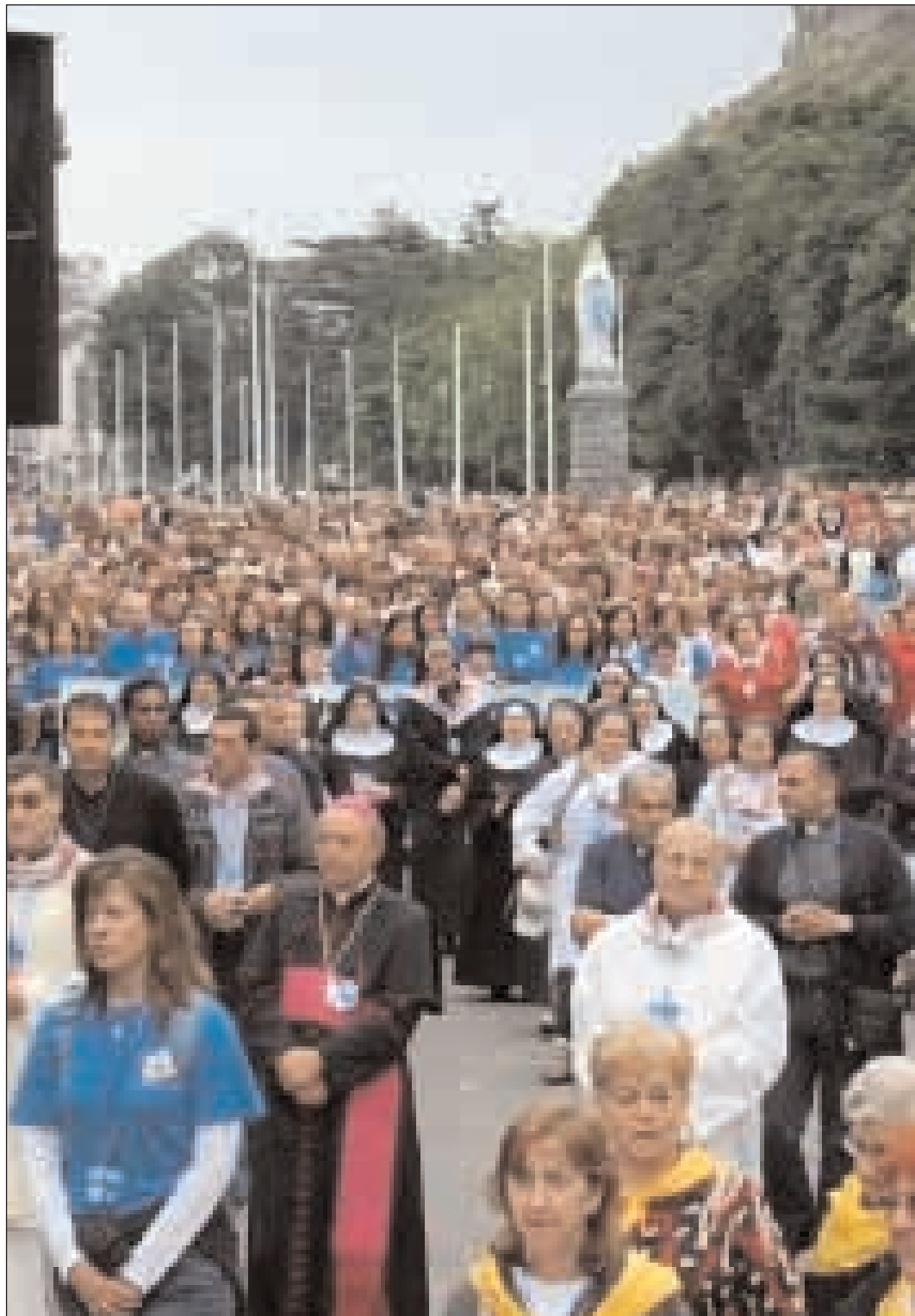
L'Arcivescovo di Gaeta in processione a Loudes

«Un segno dei tempi. La dignità della donna e la sua vocazione - oggetto costante della riflessione umana e cristiana - hanno assunto un rilievo tutto particolare negli anni più recenti. Ciò è dimostrato, tra l'altro, dagli interventi del magistero della Chiesa, rispecchiati in vari documenti del Concilio Vaticano II, il quale afferma poi nel messaggio finale: 'Viene l'ora, l'ora è venuta, in cui la vocazione della donna si svolge con pienezza, l'ora in cui la donna acquista nella società un'influenza, un irradimento, un potere finora mai raggiunto. E' per questo che, in un momento in cui l'umanità conosce una così profonda trasformazione, le donne illuminate dallo spirito evangelico possono tanto operare per aiutare l'umanità a non decadere'». Così si apre la lettera apostolica "Mulieris dignitatem" dell'indimenticabile sommo pontefice Giovanni Paolo II sulla dignità e vocazione della donna in occasione dell'anno mariano. Il nostro Arcivescovo S.E. Mons. Fabio Bernardo D'Onorio nel dedicare un suo messaggio alla donna in occasione della ricorrenza internazionale della Giornata della Donna del prossimo 8 marzo ha voluto ricordare l'apertura della lettera apostolica "Mulieris dignitatem" Evidenzia il Presule che "le parole di questo messaggio riassumono ciò che