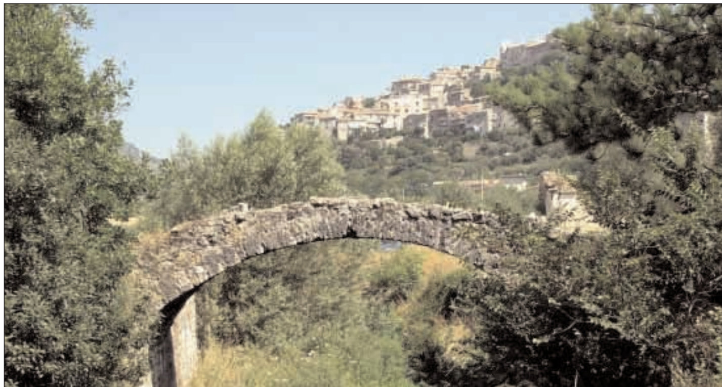
Il paesaggio Aurunco, sullo sfondo Ausonia