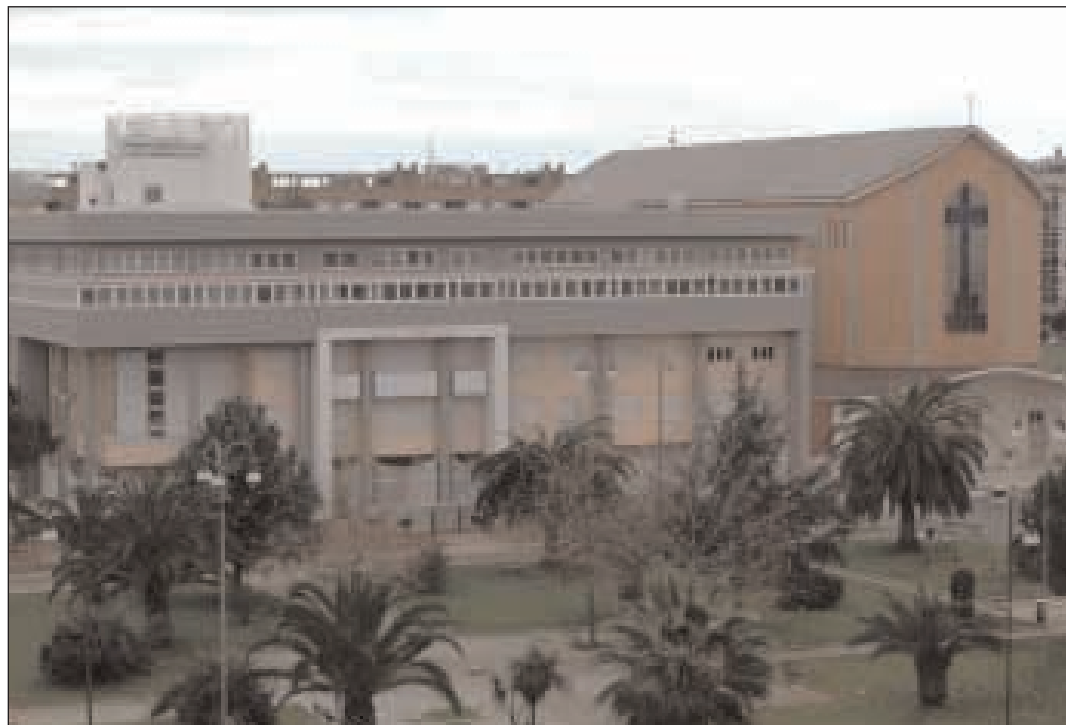
La Curia di Latina

L'Ufficio Catechistico e la Sezione per l'Ecumenismo e il Dialogo Interreligioso dell'Arcidiocesi di Gaeta stanno organizzando l'adesione di un numero adeguato di persone, fedeli interessati in genere e di insegnanti in particolare, al convegno delle diocesi del Lazio in programma presso la Curia di Latina mercoledì 18 marzo sul tema "Il Vangelo di Gesù - Gesù senza Vangelo - Confronto fra fede cristiana e nuovi culti". L'iscrizione è di 10 euro, ridotta a 5 euro per gli studenti, pranzo completo euro 10, quindi per un totale di 20 euro. A tutti sarà data la cartolina del convegno. Si sta verificando il trasporto su pullman per i partecipanti se vi saranno una cinquantina di adesioni. La sola spesa sarà equamente ripartita tra tutti i beneficiari. Per informazioni si possono contattare gli organizzatori con