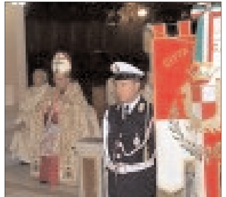
L'Arcivescovo di Gaeta S.E. Mons. Fabio Bernardo D'Onorio

occorre, come il Goel, ovvero come il Dio della liberazione storica, una volta consegnatasi a Lui con confidenza viva, perseverandovi. Il Sinodo Diocesano, quale prezioso strumento spirituale e culturale nelle mani di coloro, che sono chiamati a gestirlo, ha tra i suoi scopi, sia consentito insistervi, quello di condurre determinati fedeli a capovolgere letteralmente una concezione meramente strumentale della fede, dato che dai predetti si ricorre a Dio solo quando se ne avverte la impellente necessità, magari trascurando i più elementari doveri cristiani. La fede è dei cuori liberi, di cuori ancorati al desiderio sincero di offrire a Lui il meglio del loro sentire quali innamorati della Sua bellezza e della Sua perfezione, soprattutto quali incantati dal Suo Amore, di cui la testimonianza più alta è la Crocifissione del Figlio, da Lui voluta al fine di riorrificare integra alla creatura umana la dimensione interiore compromessa dal peccato del primo uomo. Essa è sorgente inesauribile di