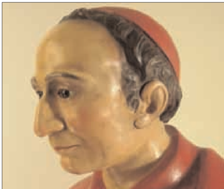
Un particolare dell'icona del santo