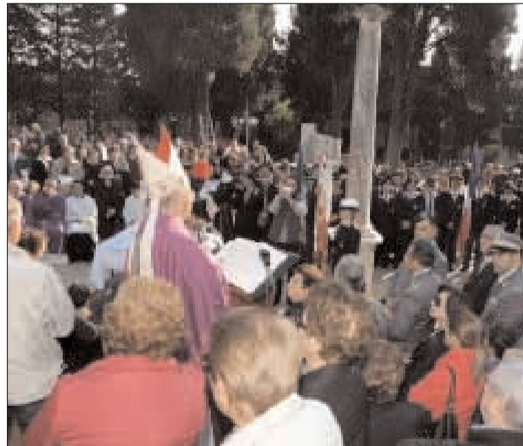
L'Arcivescovo durante la funzione religiosa