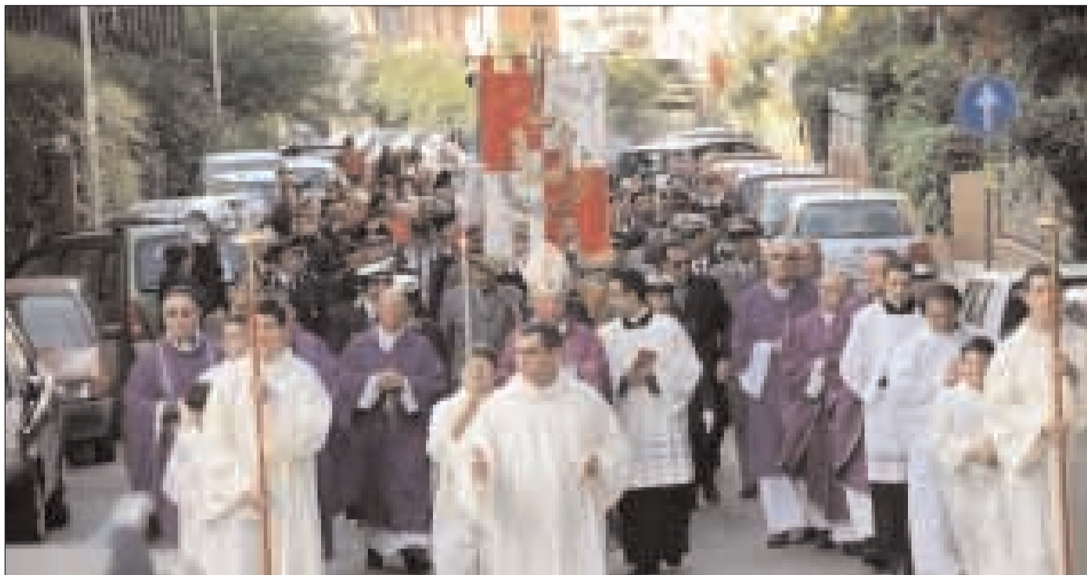
Il corteo guidato dall'Arcivescovo attraversa Gaeta