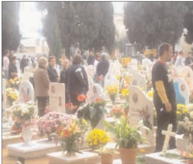
I fedeli tra le tombe dei loro cari nel cimitero di Gaeta