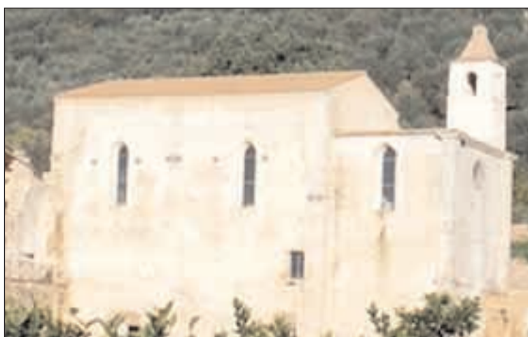
Il Monastero di San Magno

del Pilar Corso Resina di Ercolano, con alle spalle un'esperienza sacerdotale ventennale. Il suo intervento muoverà a partire dalla famosa frase evangelica: «Beati i poveri in spirito». Alle 18.30, quindi, ci avviciniamo alla chiusura dalla giornata di meditazione. Il programma prevede la Celebrazione Eucaristica, al termine del quale seguirà una fraternità con castagne e vin brulè. Una grande occasione per osservare quella immaginaria linea verticale che conduce verso lo Spirito, in un luogo di pace assoluta. «Per info e adesioni - spiegano gli organizzatori - è possibile consultare il sito internet www.abbazia-disanmagno.it o scrivere al seguente indirizzo mail segreteria.monastero@gmail.com ».