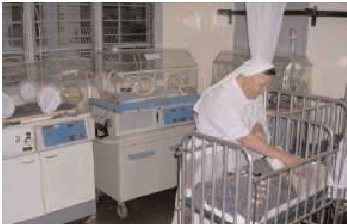
Suora impegnata nel nido di un ospedale