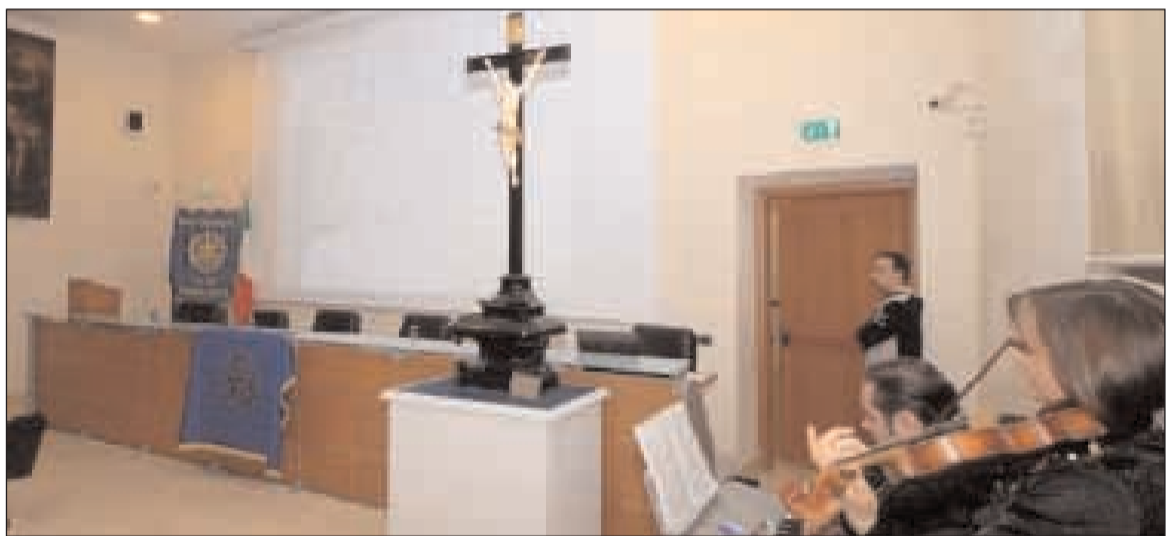
L'ammirazione dell'icona donata da Papa Pio IX

Festa d'autunno. E' il titolo della Giornata di comunione e di fraternità programmata per domenica 15 novembre presso il monastero di San Magno a Fondi. L'evento muove le mosse dall'ascolto della Parola di Dio e sarà scandita dalla preghiera. L'evento devozionale è articolato in diversi momenti, di cui il monastero sarà il ritrovo. Il primo appuntamento è fissato per le 9 con la lode del mattino. Alle 10, invece, Meditazione e Deserto saranno le coordinate di un momento di sentira riflessione. Alle 13 è fissato un piccolo break con il pranzo a sacco. Alle 15.30, invece, è fissato l'incontro con don Pasquale Incoronato, parroco della Comunità di Santa Maria