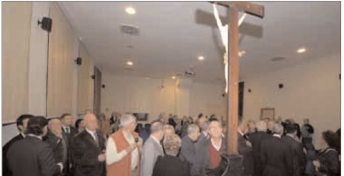
Polimnia: una fase dell'evento. A sinistra il Crocefisso