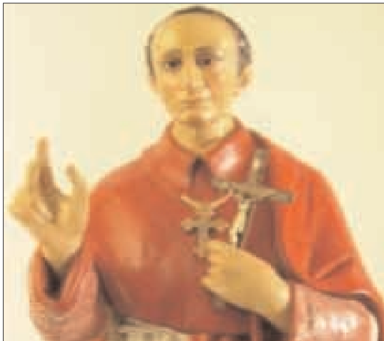
L'icona di San Carlo Borromeo