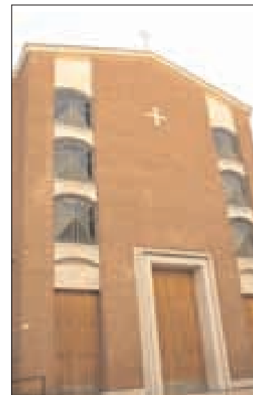
La Chiesa del Carmine di Formia