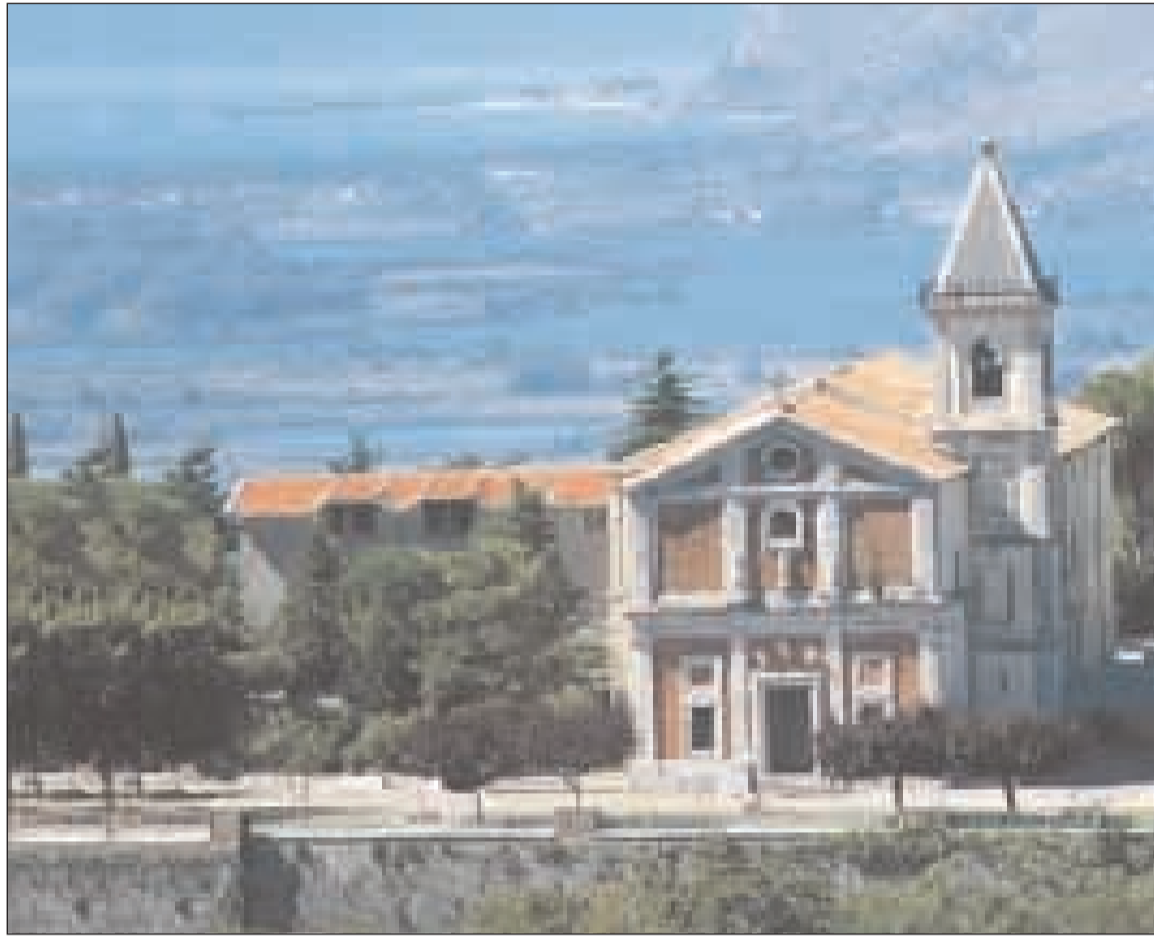
Il Santuario del Colle di Lenola

T re giorni dedicati alle prime applicazioni dell'esortazione pastorale dell'Arcivescovo Mons. D'Onorio. E' quanto registrato a partire da martedì 3 novembre. Un momento teologico immerso nella beata serenità del Santuario del Colle di Lenola. Papa Paolo VI ha affermato: «La pratica degli esercizi costituisce non solo una pratica tonificante e corroborante per lo spirito, in mezzo alle dissipazioni della chiassosa vita moderna, ma altresì una scuola ancora oggi insostituibile per introdurre le anime ad una maggiore intimità con Dio, all'amore della virtù e alla scienza vera della vita, come dono di Dio e come risposta alla sua chiamata». Cosa siano gli esercizi spirituali, nella vita ordinaria, ce lo spiega don Adriano di Gesù, rettore del Santuario, il quale analizza: «Gli esercizi spirituali nella vita ordinaria sono un percorso di approfondimento della propria fede che, attraverso il dialogo con il Signore a partire dalle Scritture e dalle esperienze quotidiane, porta a riordinare la propria vita in base ai valori e allo stile di Cristo. L'approfondimento avviene tramite: una integrazione della fede con la vita; un cammino di discernimento per impostare la propria vita secondo la volontà di Dio; una "Scuola di Preghiera" per entrare in comunione profonda col mio creatore e Signore. Una integrazione della fede con la vita»