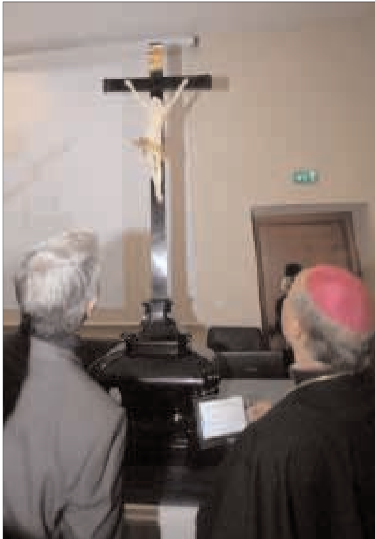
L'Arcivescovo osserva il Crocefisso donato da Papa Pio IX alla Chiesa di Gaeta

L a Conferenza Episcopale Italiana in merito alla decisione negativa sull'esposizione dei crocifissi nelle scuole pubbliche italiane ha emesso un comunicato nel quale si evidenzia che: «La decisione della Corte di Strasburgo suscita amarezza e non poche perplessità. Fatto salvo il necessario approfondimento delle motivazioni, in base a una prima lettura, sembra possibile rilevare il sopravvento di una visione parziale e ideologica. Risulta ignorato o trascurato il molteplice significato del crocefisso, che non è solo simbolo religioso ma anche segno culturale. Non si tiene conto del fatto che, in realtà, nell'esperienza italiana l'esposizione del crocefisso nei luoghi pubblici è in linea con il riconoscimento dei principi del cattolicesimo come "parte del patrimonio storico del popolo italiano", ribadito dal Concordato del 1984. In tal modo, si rischia di separare artificiosamente l'identità nazionale dalle sue matrici spirituali e culturali, mentre "non è certo espressione di laicità, ma sua degenerazione in laicismo, l'ostilità a ogni forma di rilevanza politica e culturale della religione; alla presenza, in particolare, di ogni simbolo religioso nelle istituzioni pubbliche...". Considerazioni che condivido pienamente. Dobbiamo finirli noi cat-