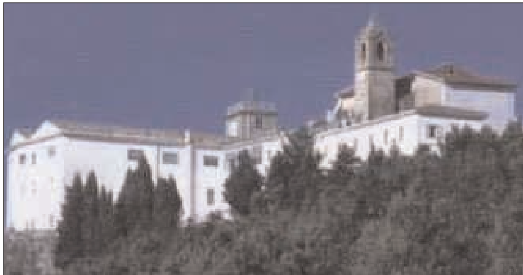
Il Santuario della Civita a Itri