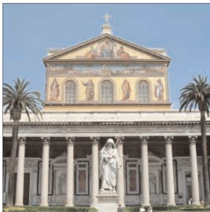
La basilica di San Paolo a Roma meta dei trenta giovani

cattolica settore giovani. Sul volantino di presentazione del campo si legge: "Abbandona la tua stanza e mettili in viaggio. La libertà si vive nel cammino ma bisogna accettare di essere aperti, poveri, leggeri, duttili con pochi bagagli. Ci si mette in cammino per riscoprire le proprie radici nella semplicità e preparare le proprie ali al domani". Da queste piccole citazioni si evince il senso e la motivazione della scelta di proporre un'esperienza così forte e se si vuole faticosa ai giovani. Riscoprire le radici, la bellezza delle cose semplici, lo spirito di adattamento, la condivisione, la stanchezza del cammino ma la soddisfazione di seguire una strada sono emozioni troppo lontane dalla normale realtà, ormai divenute