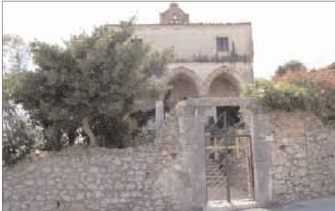
L'esterno della Chiesa Santa Maria della Libera a Marina di Minturno

che poterono legittimarla come proprietà ceduta. Non sono noti i titoli che la chiesa assunse prima dell'anno 1438, ma si è certi che dopo l'anno 1439 fu detta Santa Maria della Libera, perché, quando la terribile pestilenza afflisse Minturno, tutta la popolazione traettese si recava presso la chiesetta per invocare l'aiuto della Vergine, che giunse presto miracoloso. Ancora oggi si venera la Madonna della Libera e, la terza domenica di settembre, nella località di Fontana Perrelli, si dà luogo a una caratteristica festa accompagnata da una tipica fiera. La Regia Sovrintendenza all'Arte