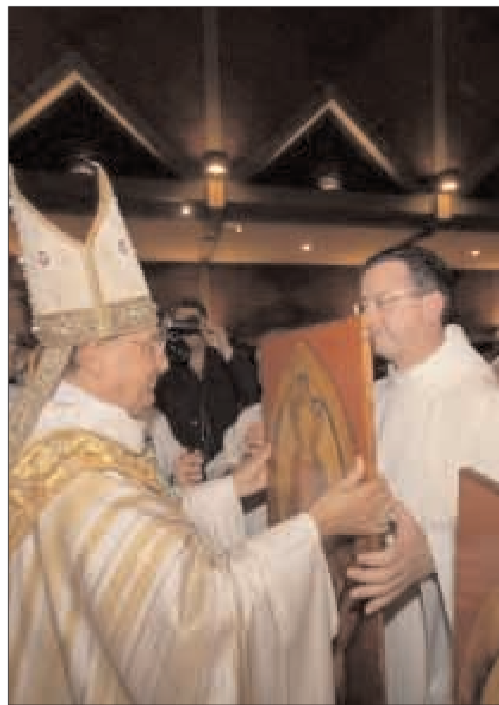
L'Arcivescovo consegna l'icona del Sinodo diocesano ai parroci

dall'Onnipotente, significa superare l'assurdità del pessimismo, e la profezia delle sventure. Alla chiesa di Laodicea il «Testimone fedele e verace» dice: «compra da me ...collirio per ungerti gli occhi e recuperare la vista» (Ap 3,18). Come Chiesa non ci si può lasciare travolgere dall'aria tutta mondana di prevedere solo catastrofi e fallimenti, ma raccogliendo un invito del card. Tettamanzi alla prolusione di apertura del Convegno di Verona, «oltre che parlare di speranza, dobbiamo abituarci a parlare con speranza». Se il Sinodo è il luogo dove si narrano le cose belle che una Chiesa possiede, il cuore sinodale non può non essere capace di leggere la realtà che lo circonda con occhi positivi, senza per questo voler alterare la verità, che quando è tale affascina sempre e convince dal di dentro, anche se sembra ferire. Si potrebbe chiamare questa seconda caratteristica: vocazione al «guadagno della speranza». 3. Gli uomini di