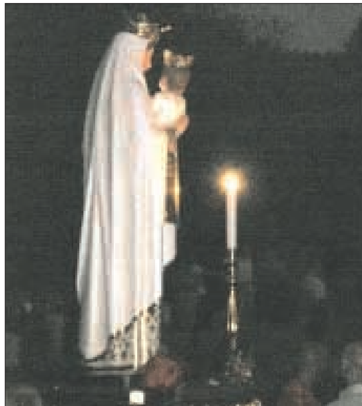
La Madonna delle Grazie in processione per le vie di Gianola

statua della Madonna verrà portata nella chiesa parrocchiale, da dove era stata rimossa in occasione della celebrazione. Sempre oggi sul sagrato della Chiesa della Madonna delle Grazie avverrà la deposizione del gonfalone. Domani, invece, presso il campetto sportivo polivalente, sempre di Gianola ovviamente, andrà in scena la serata animata da Fuego Latino. Un'occasione per stare insieme all'insegna di balli di gruppo, liscio, latino americano e karaoke. Alle 22.30, invece, sarà l'ora dell'estrazione dei biglietti della lotteria a premi. Sabato, 15, a sigillo dell'edizione 2009 della festa e in occasione della solennità dell'Assunzione della