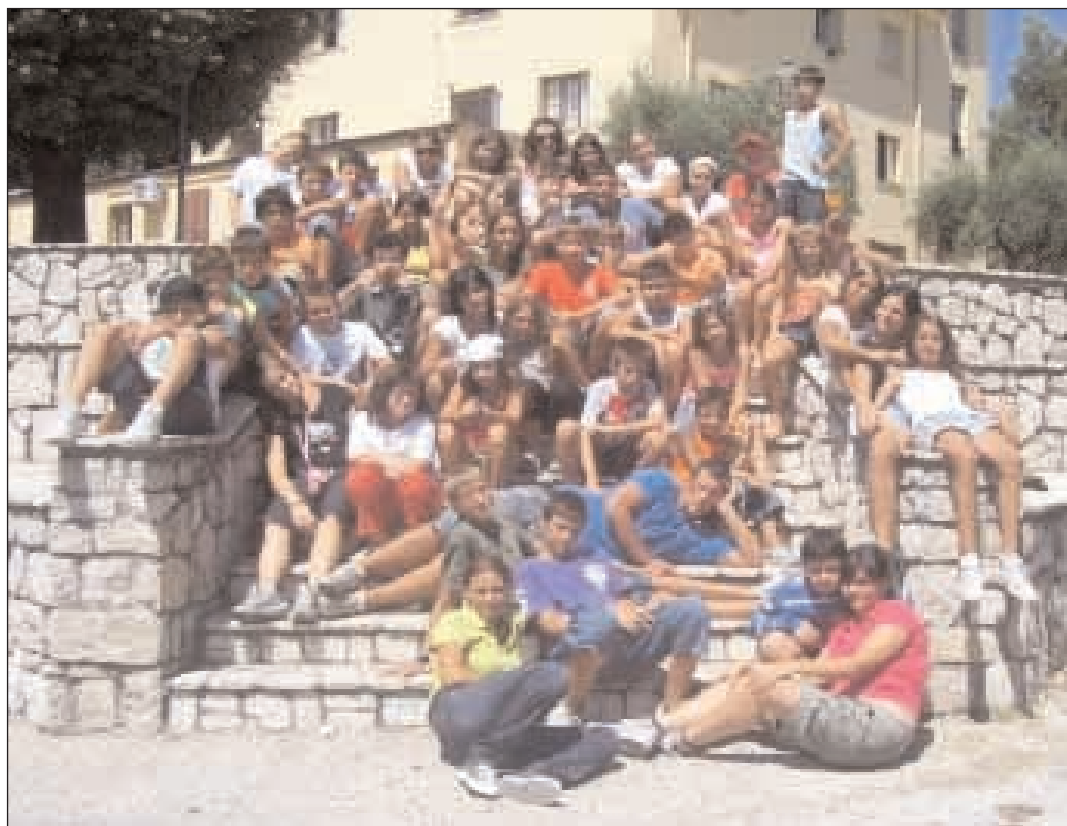
Foto di gruppo per i giovani dell'Ac e i loro accompagnatori

D al 3 al 6 agosto 40 ragazzi delle parrocchie Madonna del Carmine e Santa Teresa D'Avila di Formia hanno trascorso quattro giorni presso il santuario Santi Cosma e Damiano di Pontecorvo in occasione dell'annuale camposcuola estivo. Frutto dell'integrazione tra le due comunità in seguito alla momentanea chiusura per lavori della chiesa centrale di Santa Teresa le parrocchie condividono tutti i momenti della vita cristiana dalla santa messa al catechismo dei ragazzi. Per il secondo anno il camposcuola ha avuto come base un sussidio elaborato dal centro nazionale dell'azione cattolica su cui strutturare e preparare le varie giornate a misura di ragazzo così come è tipico dello stile dell'acr. Filo conduttore del campo è San Pietro, esempio di discepolo che ha rinnegato Gesù ma ha ritrovato la speranza, gli ha dichiarato il suo amore e ha fondato la sua Chiesa. Il camposcuola in realtà è la tappa finale di un cammino annuale sui sogni e i desideri dal titolo "Mi basti tu!"