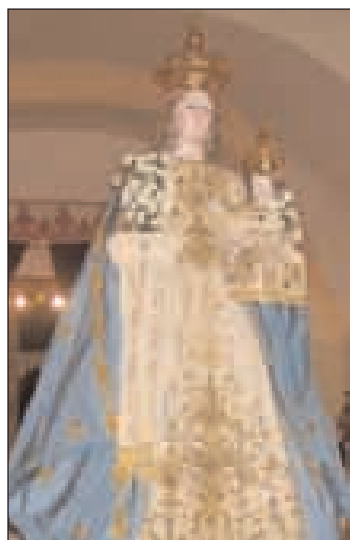
La Madonna di Porto Salvo in partenza richieste, che in questo anno non può negarci dopo l'attestata devozione che le abbiamo dimostrato, anche con il nostro contributo alla sua naturale bellezza.

Non possiamo lasciare inespresi i segni che Dio semina nella nostra storia, bisogna interpretarli, esprimerli, chiarificarli in parole. Dio con tale evento ci invita, attraverso Maria Santissima di Porto Salvo, a un vero e sincero cammino di conversione, di passare dal peccato alla gloria. Ogni manifestazione mariana, Lourdes, Fatima, Medjugorie e altre hanno sempre l'invito alla conversione e alla preghiera: "convertitevi e pregate". Anche questa sera Maria Santissima di Porto Salvo ci dice: "convertitevi e pregate!". Il restauro non è un evento sommario e necessario, dovuto al solo e semplice passare del tempo che corrode ogni cosa, ma è dovuto anche alla nostra disattenzione cristiana. I nostri peccati, le nostre mancanze, i nostri silenzi, le nostre cattiverie, i