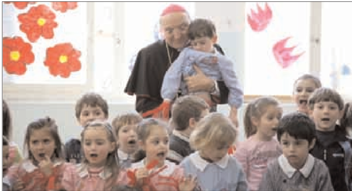
L'Arcivescovo tra scolari della diocesi

A uguri a tutti voi! Che il Bambino Gesù ricolmi della sua benedizione la grande famiglia dell'Azione cattolica della nostra arcidiocesi. Carissimi tutti di AC, girando per le nostre parrocchie non si fa fatica a lasciare che gli occhi siano colpiti dagli slogan sulle locandine e sui manifesti che la cara Azione Cattolica Italiana ha predisposto per questo anno associativo. In particolare mi riferisco alle frasi: "Lo accolse con gioia". Che fa riferimento al capitolo 10 di Luca che narra l'incontro di Gesù con Zaccheo e a quello dove delle mani compongono il perimetro di una casa, al cui centro è ben evidente la scritta "Accoglienti per scelta". Queste frasi mi portano ad affermare: chi più di un socio o di un simpatizzante dell'AC, dal più piccolo al più grande, può sintonizzarsi meglio sulla frequenza d'onda del tempo di Avvento che stiamo vivendo e prepararsi ad accogliere il Dio che viene nel Bambino di Betlemme? Se tutto il cammino che avete iniziato per quest'anno vi sta aiutando a riscoprire la gioia dell'accoglienza di Dio e di ogni uomo, il Natale si pone come un momento di grande meditazione su questo tema. Non dimentichiamo che per Giuseppe, Maria e il Bambino Gesù, il