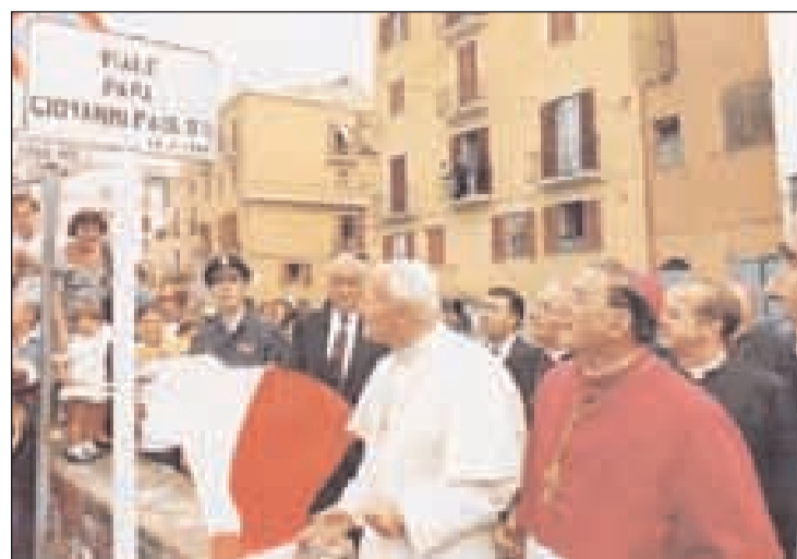
Il Santo Padre e l'arcivescovo Mons. Farano dinanzi alla targa poi scomparsa vivo il ricordo di un giorno storico Padre stesso denominò "La Giornata di Gaeta".

lare iniziativa, evento nell'evento, venne ripresa e diffusa da tutte le testate giornalistiche tra cui lo stesso Osservatore Romano. Oggi, a quasi quattro anni dalla scomparsa di Karol Wojtyła, la lapide commemorativa non c'è più. I cittadini del quartiere si chiedono le motivazioni per cui si è proceduto alla rimozione della lapide e si augurano che al più presto quella insegna ritorni nel luogo dove passò Giovanni Paolo II il 25 giugno 1989, mantenendo