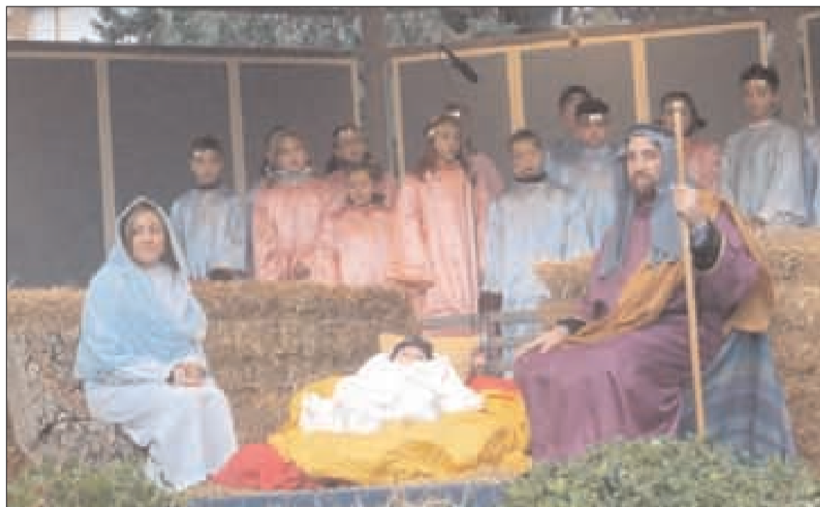
Una dolce immagine del Presepe Vivente

Nel pomeriggio dell'Epifania si è svolta, nel parco - giardino della Parrocchia di San Paolo a Gaeta, la prima edizione del Presepe Vivente. Ambientato nel mercato di Betlemme, in un giorno speciale dell'Anno 0, il Presepe si è suddiviso in due "quadri" tra loro armonizzati: la Sacra Famiglia, interpretata da una giovane mamma e da un barbuto San Giuseppe, con al centro un bambino di pochi mesi, che tranquillamente e beatamente si è goduto tanto affetto e calore. Intorno al quadro della Natività un bel coro di bambini, in abiti variopinti, che per oltre un'ora ha interpretato melodie natalizie tradizionali e moderne, inframmezzate dalla lettura di brani evangelici e di riflessioni di autori antichi e contemporanei sul mistero e la dolcezza del Natale. Vari pastori e donne popolane, nei loro tipici abiti, erano mescolati tra il pubblico, creando una nota di gioiosa curiosità. Il secondo "quadro" comprendeva il mercato vero e proprio, con vari artigiani: il pescatore, il ramaio, la cucitrice di merletti, la vasaia, lo scalpellino della pietra, tutti nella loro attività. Iniziato alle 15 si è concluso alle 19, con un'ampia e costante partecipazione di pubbli-