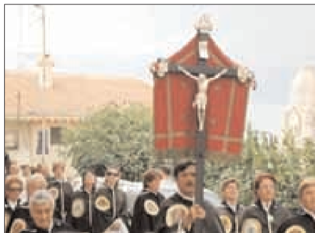
Nelle immagini gli aderenti alla Confraternita del Santissimo Rosario con le tradizionali mantelline che indicano la loro appartenenza

Il calendario degli incontri in programma nel 2010