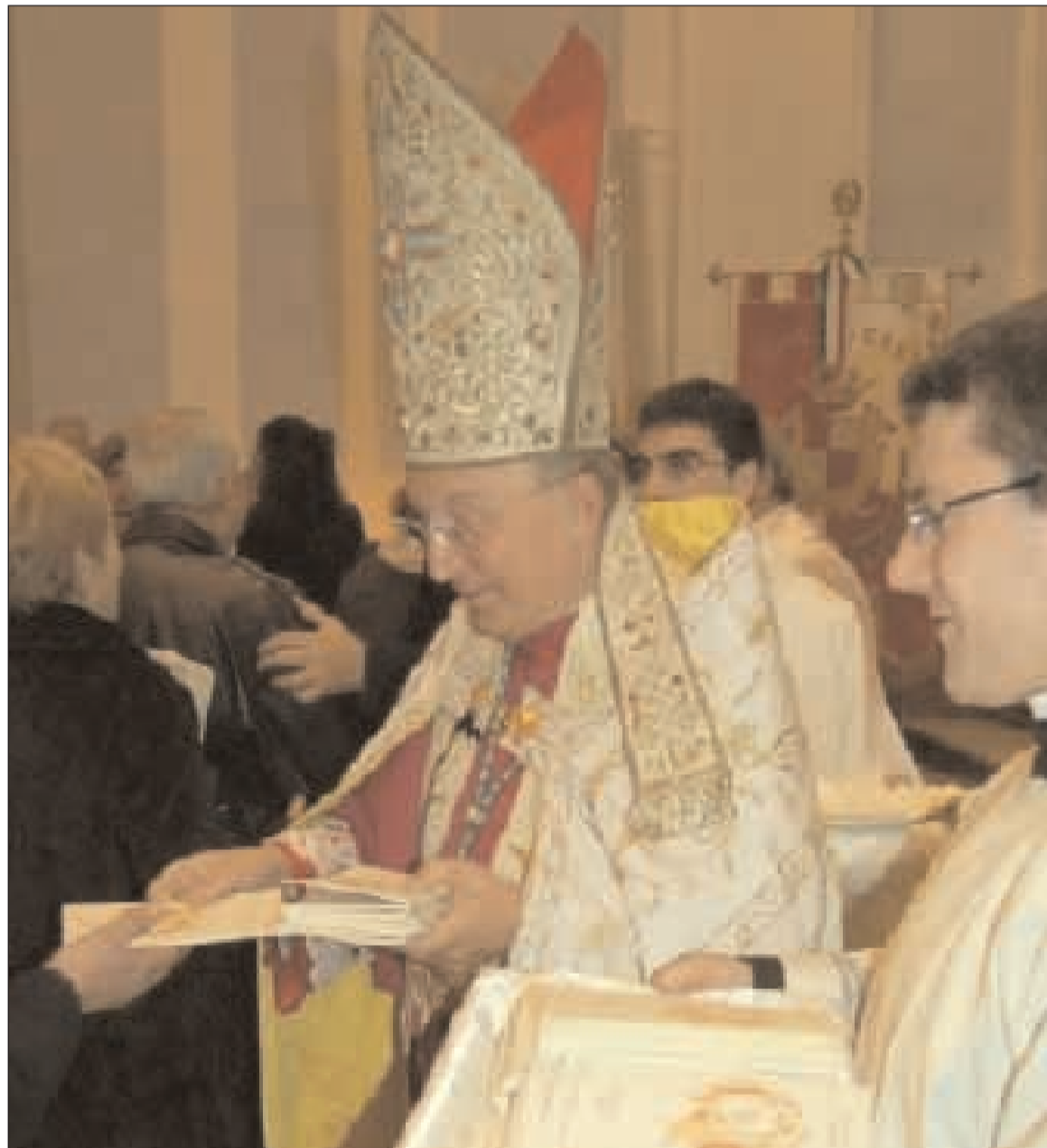
L'Arcivescovo distribuisce ai fedeli il testo del Te Deum 2009