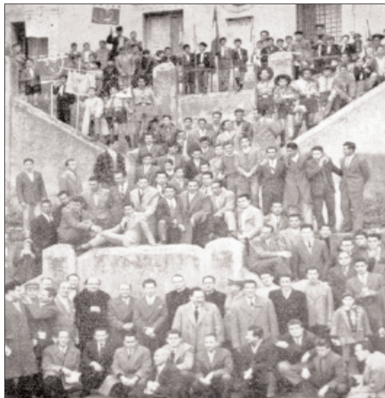
Raduno ex allievi nell'anno 1959

Il raduno nell'ottantesimo della fondazione salesiana a Gaeta