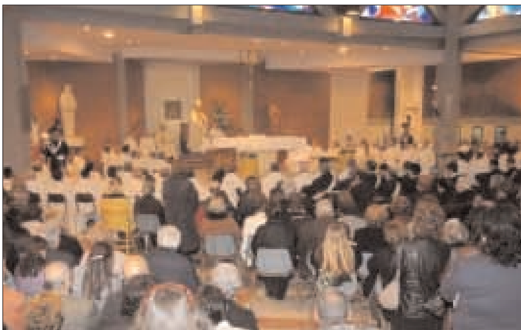
Particolare dell'assemblea del popolo di Dio durante la funzione

Annunziare Cristo come salvezza può aver senso solo se si riesce a comunicarlo come una proposta totale, capace di rispondere globalmente a tutte le aspettative umane, presenti e future, spirituali e temporali, personali e sociali e tra queste la presenza del male e il problema della sofferenza. Il nostro Dio salvatore non è lontano dalla sofferenza dell'uomo: nella vicenda di Gesù di Nazareth egli si rivela intento a guarire le infermità e ad asciugare le lacrime delle sue creature. Gesù, infatti, pur proponendo un messaggio di alto profilo non ha trascurato di chinarsi sull'umanità sofferente rivelando così il vero volto di Dio, che non rimane indifferente al dolore dell'uomo. Pensate: il breve tempo della vita pubblica di Gesù è stato in gran parte assorbito ad ascoltare e curare una sterminata folla di ciechi, di storpi, disperati, ai quali, pur non essendo indifferenti alla vita dello spirito, in quel momento stava a cuore di essere guariti, consolati, sostenuti nella quotidiana lotta per l'esistenza. Perciò ancor oggi l'azione della Chiesa e l'annuncio del Vangelo non possono prescindere dall'orizzonte concreto e lacerante del dolore. Da qui come da una cattedra prendono la parola tutti i sofferenti del mondo e da parte nostra la compassione e la vicinanza diventano il principio di autenticità di ogni prassi credente. (Continua a pag. 215)