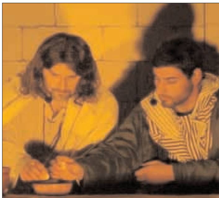
Gesù e Giuda Iscariota intingono il pane nello stesso piatto