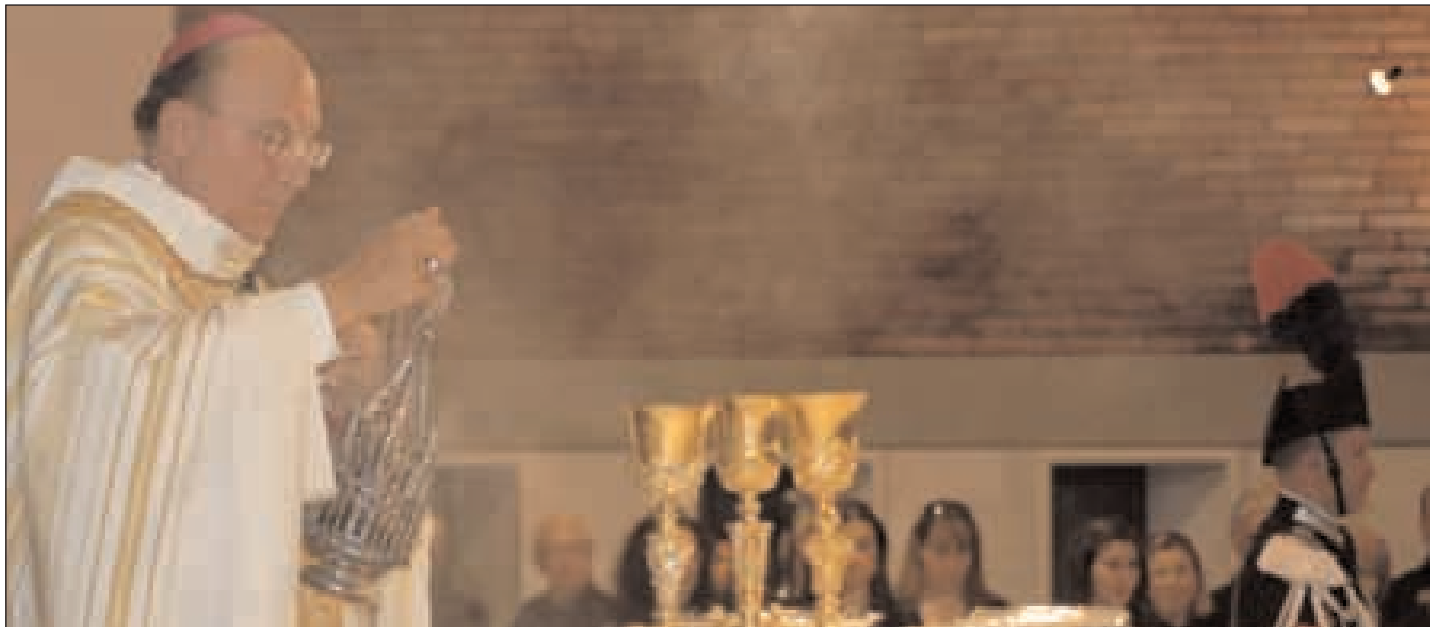
Il nostro Arcivescovo mentre incensa l'altare durante la messa crismale