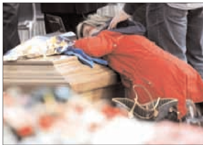
La disperazione sui feretri in fila

000401120727. Offerte sono possibili anche tramite altri canali, tra cui: Intesa Sanpaolo, via Aurelia 796, Roma - Iban: IT19 W030 6905 0921 0000 0000 012; Allianz Bank, via San Claudio 82, Roma - Iban: IT26 F035890320030157 0306097; Banca Popolare Etica, via Parigi 17, Roma - Iban: IT29 U0501803200000000011113; CartaSi e Diners telefonando a Caritas Italiana tel. 06 66177001