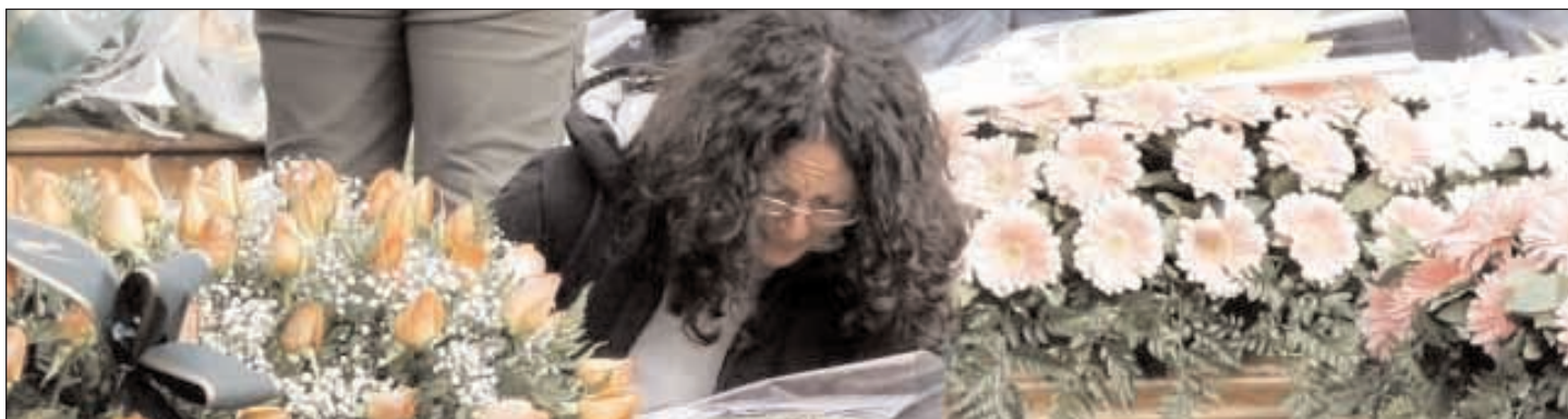
Una giovane affranta dal dolore