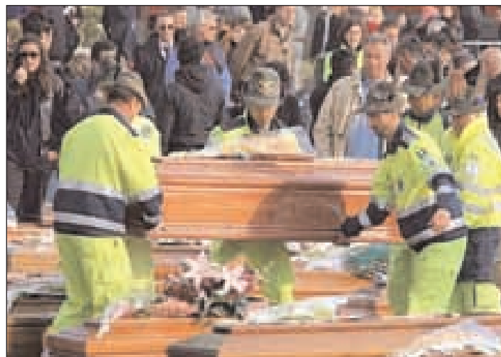
Gli alpini volontari della Protezione Civile ai funerali di venerdì scorso

che una sua amica è riuscita a fuggire incolume mentre sotto le macerie sono rimaste lei e la sua amica del cuore, quella con cui aveva anche vissuto l'adolescenza nella casa famiglia che l'aveva amorevolmente ospitato.