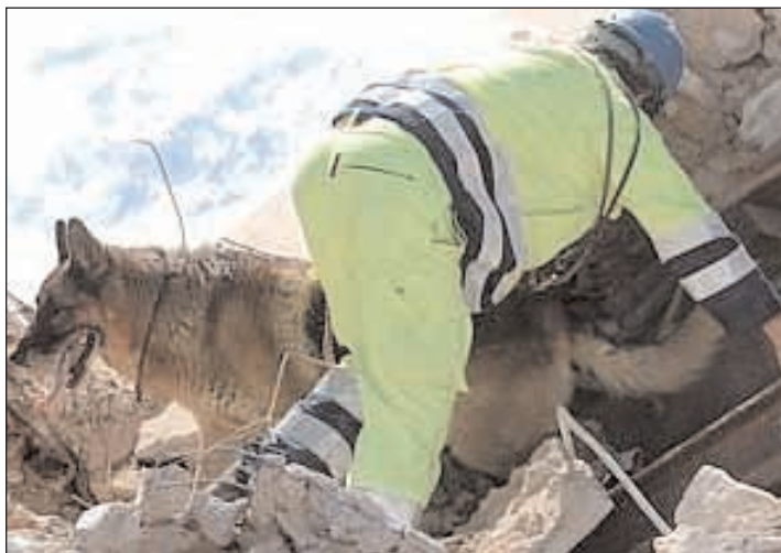
Soccorritori in azione con i cani antifrana