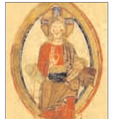
Particolare della sezione 3 dell'Exultet I (sec. XI) al Museo Diocesano di Gaeta. Gesù racchiuso in una mandorla dorata dalla quale escono i piedi nudi poggianti su un piedistallo. Il Cristo giudice è seduto in maestà, benedice, quasi alla maniera greca, ha la barba e i baffi, mostra le guance rosse; indossa una tunica rossa con pallio bruno fasciato alla vita con un drappo dorato.

sempre la gioia dell'incontro con il Confratello e del nostro raggiungere la sua con il dono della stima e dell'amicizia. Ti ringrazio per tutta la tua attenzione nei miei riguardi, che spero contraccambiate sempre. Ti ricordo le date dei nostri appuntamenti successivi: 29 aprile la nostra Gita a Lanciano; 21 maggio incontro di preghiera accanto all'urna di San Giovanni Bosco presso la Parrocchia Cuore Immacolato di Maria a Formia. La gioia e il volto del Risorto sia sempre in noi.