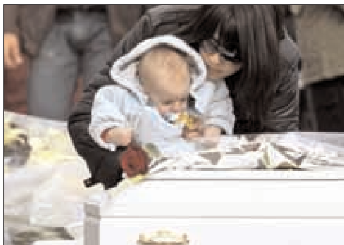
La tragedia ha colpito tutti, piccoli e grandi