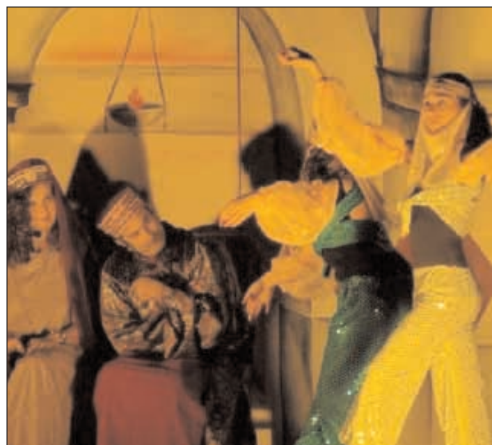
Re Erode e la consorte assistono alla danza di Salomè