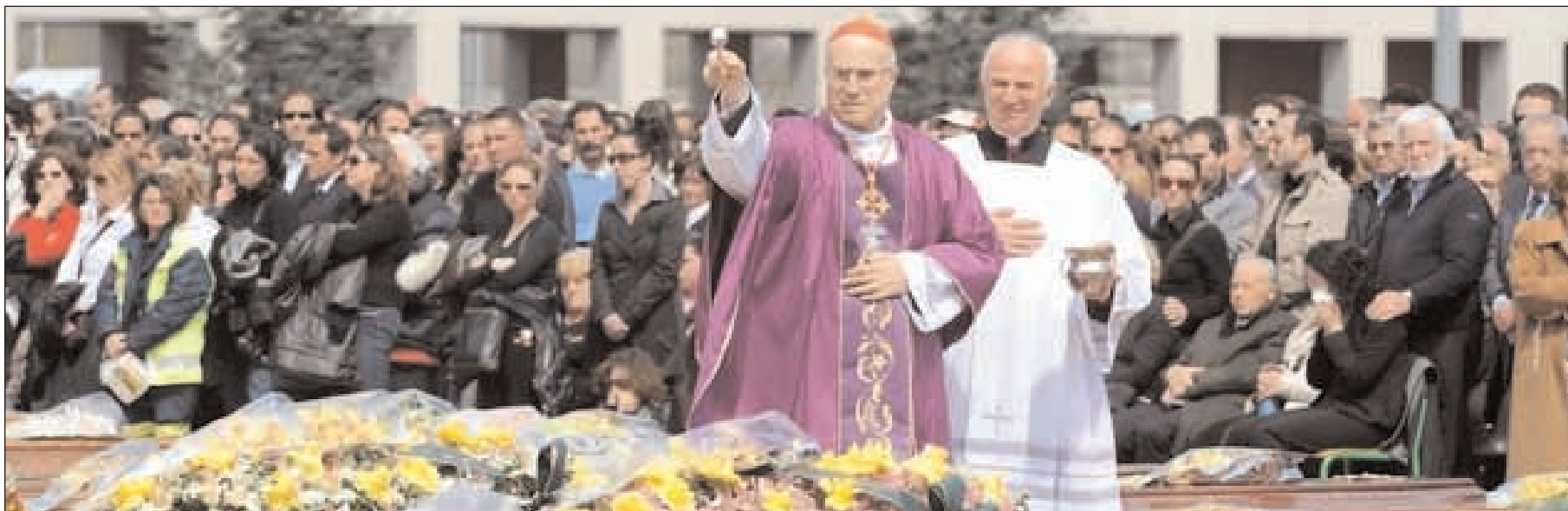
Il Cardinale S.E. Mons. Bertone mentre benedice le oltre duecento bare presenti nel piazzale d'armi