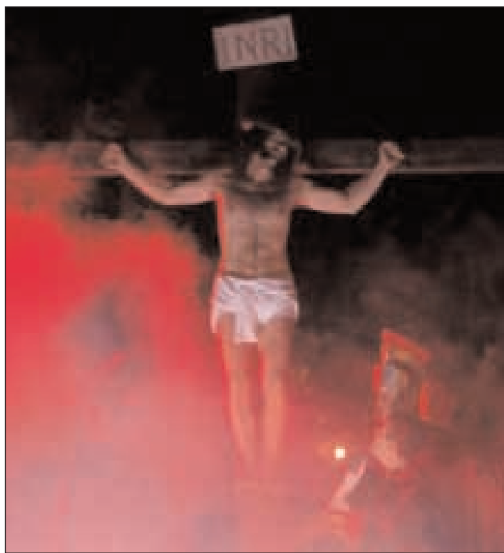
Gesù Cristo crocifisso