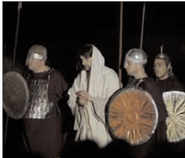
L'arresto di notte di Gesù da parte delle guardie del tempio