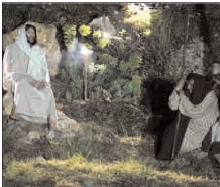
Gesù si raccoglie in preghiera, con i suoi discepoli poco distante