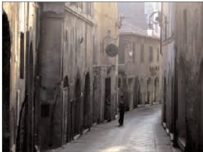
Anagni, località che ha accolto gli esercizi spirituali

N ella tranquilla cornice della Villa Leonina del Pontificio Collegio Leoniano di Anagni dal 27 al 30 agosto si sono svolti gli esercizi spirituali organizzati dall'Azione Cattolica diocesana predicati da Don Gianluigi Valente. L'itinerario è stato ben strutturato ed efficace. È iniziato con atteggiamento di gratitudine e invocazione dello Spirito Santo pur riconoscendo la difficoltà di rinascita e di riscoperta per rispondere alla chiamata a incamminarsi come i Pastori in mezzo a questa umanità, ai disordini della nostra vita. Ci siamo lasciati visitare da Dio. Lo abbiamo accompagnato nella profondità e intimità del nostro cuore in agitazione. Il dialogo è iniziato. Pian piano "la tempesta è stata sedata". Nella Verità abbiamo acquistato fiducia nel Signore anche se peccatori. Ci siamo lasciati osservare. Siamo inadeguati ad accoglierlo ma, con la Grazia dello Spirito Santo Egli viene come, dove e quando vuole. Egli viene nella