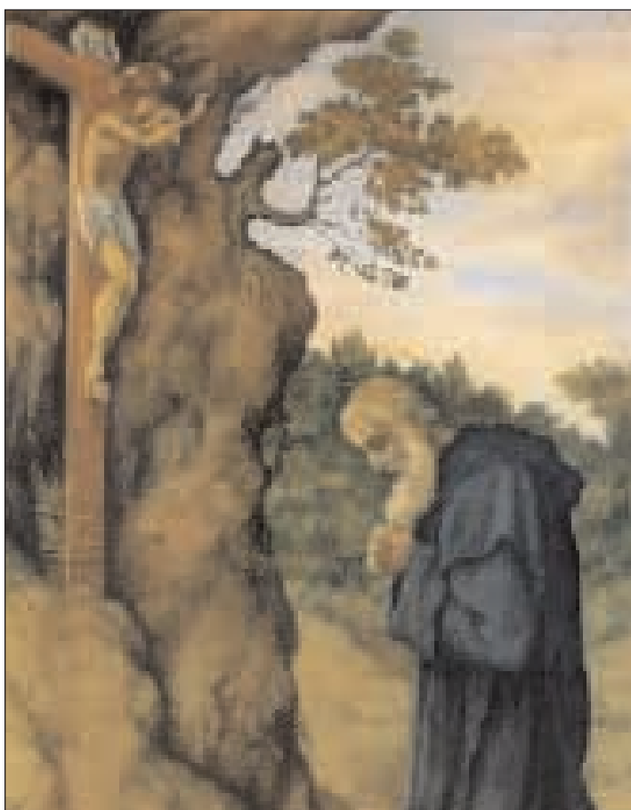
San Nilo nell'iconografia cristiana