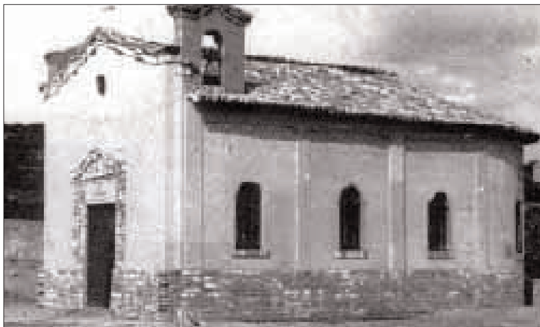
La Chiesa di San Nilo nel 1939