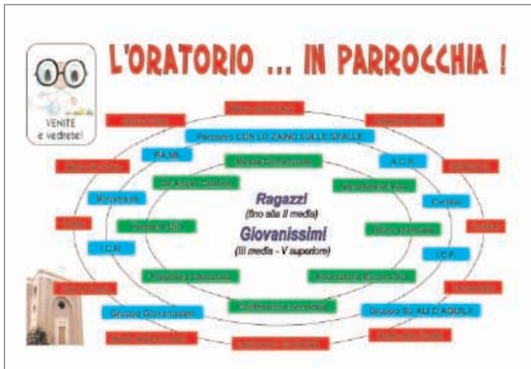
Lo schema dell'oratorio della parrocchia dei Santi Lorenzo e Giovanni Battista

dei ragazzi e dei giovani nella realtà parrocchiale. Fanno parte di tale dimensione: il Gruppo Sportivo Virtus, i laboratori oratoriali (calcio, pallavolo, art-attack, musica, ecc.) ed il progetto Aiuto allo Studio; Dimensione della formazione (cerchio intermedio), verso la quale gli operatori pastorali tendono a dirigere i ragazzi e i giovani, affinché l'oratorio non si limiti ad essere una ludoteca, ma diventi luogo primario di formazione di cristiani e cittadini, attraverso la trasmissione di valori inalienabili quali il rispetto della persona, il dialogo, la tolleranza, il senso di responsabilità. attualmente è costituito da: Iniziazione Cristiana fanciulli e ragazzi, Azione Cattolica Ragazzi, gruppo Ra. Mi. (ragazzi missionari), ministranti, gruppo giovanissimi e giovani di Azione Cattolica. Dimensione della spiritualità: è il cerchio più interno e, al tempo stesso, l'obiettivo finale dell'Oratorio; per spiritualità si intende un atteggiamento, un modo di vivere in senso strettamente cristiano, e più in generale essa rappresenta un modo per riflettere sulla propria vita e sulla direzione che le si vuole imprimere. Dopo la pausa di agosto, lunedì 7 settembre l'oratorio ha riaperto le porte con il Mese del Ciao, periodo dedicato all'accoglienza dei ragazzi e dei giovani che culminerà con la Festa del Ciao prevista per i giorni 26 e 27 settembre.