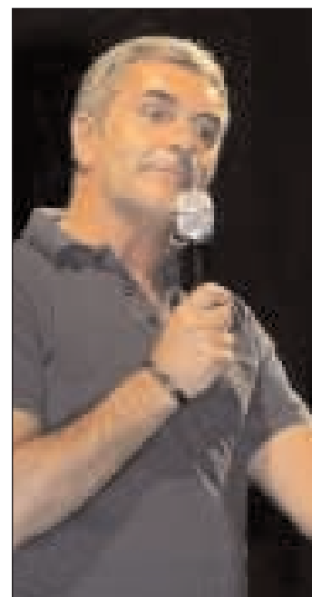
Il comico napoletano Simone Schettino