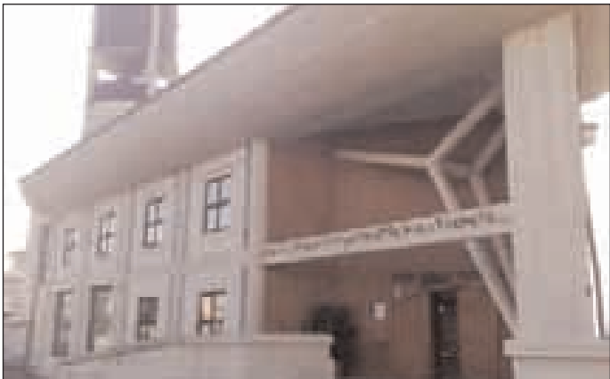
La Chiesa Sacro Cuore di Maria di Formia

D opo un'estate ricca di esperienze formative si ricomincia alla grande sempre in compagnia dell'Ac. A dare il via alle attività, come ogni anno, il centro diocesano organizza la cosiddetta "presentazione dei testi" ovvero l'illustrazione della tematica annuale e la prima occasione di incontro con tutti i vari settori. L'appuntamento è per domenica 20 settembre presso la Parrocchia Sacro Cuore di Gesù a Formia. La scelta del luogo non è per niente casuale anzi si è cercato di coinvolgere una comunità dove l'Ac non è ancora nata ma che è volenterosa a muovere i primi passi nell'associazione. Alle 15.30 sono previsti gli arrivi, alle 16 la preghiera introduttiva e una riflessione spirituale sulla tematica annuale, alle 16.30 la presentazione del-