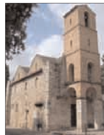
Chiesa della Madonna di Castagneto

cessione della venerata statua della Madonna. Alle 19 Santa Messa presso la Chiesa di San Giuseppe e per finire in gran bellezza, sempre nel Piazzale Mercato, serata di festa con il gruppo musicale "Tequila Band". A seguire lotteria di beneficenza a cura dell'associazione culturale San Giuseppe Lavoratore. Un evento reso possibile dalla disponibilità e dinamismo della Chiesa di San Giuseppe Lavoratore.