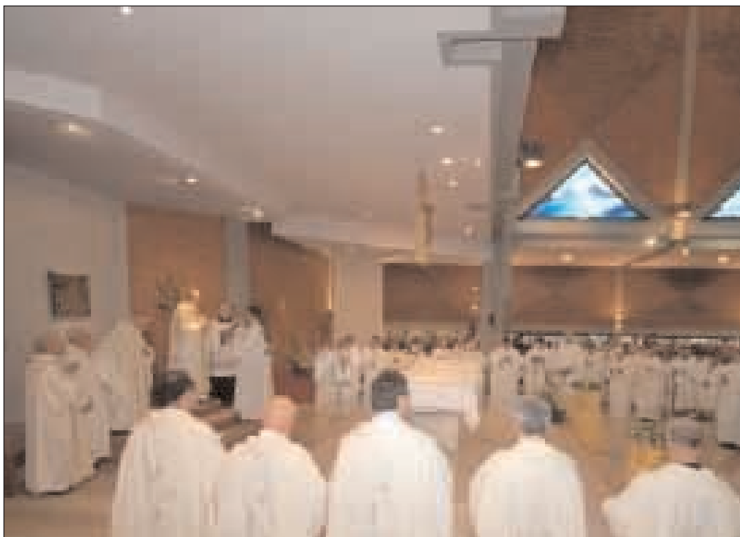
L'apertura del Sinodo diocesano a Gaeta

l'atteggiamento ideologico di chi proclama la propria indipendenza di pensiero e di azione da qualsivoglia rapporto con la Chiesa, con il suo insegnamento, con la sua autorità. Il fenomeno è divertente (e chiedo scusa ai lettori se mi sono permesso una digressione tale): per qualificare se stesso nell'atto in cui rivendica alla propria totale estraneità alla Chiesa e la propria totale autonomia dalla Chiesa, l'uomo moderno, non sa far di meglio che ricorrere a una parola tipica e propria della teologia cattolica e del diritto canonico. Chiusa la digressione a noi interessa che la consultazione sinodale sia laica nel senso più bello del termine. Nella accezione che traspare anche da Lumen Gentium 31 il laico appare come colui che "manca di qualcosa". Ora, colui che "manca di qualcosa" è colui che ha uno spazio ancora da occupare, colui che ha uno spazio è colui che è alla ricerca, colui che è alla ricerca è colui che ha un'attenzione speciale all'accoglienza. Laico è chi rendendosi conto dei propri limiti e dei propri vuoti non assolutezza se stesso ed è costantemente aperto all'altro. Può forse una Chiesa in Sinodo perdere questa certezza di Chiesa che cerca e che accoglie? Quando ci si dispone all'ascolto e si consultano gli uomini di buona volontà non è bene riscoprire quel poco di laicità che ci deve essere in tutti intesa come capacità di non assolutizzare se stessi e la propria esperienza? (5 - continua)