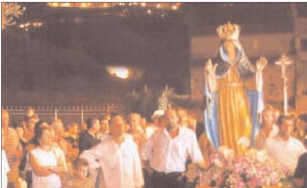
La processione dell'icona di Maria Santissima della Libera