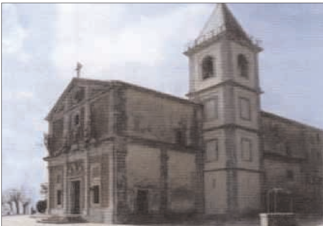
Il Santuario della Madonna del Colle