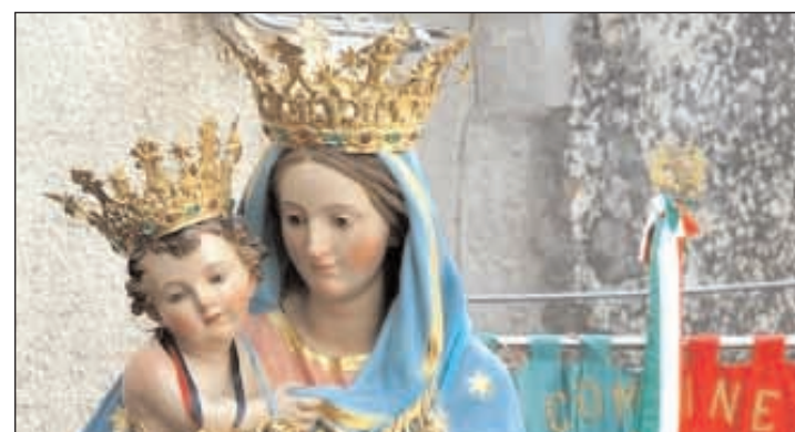
L'icona della Madonna del Colle

Ultimo atto della Festa organizzata a Formia in onore alla Vergine