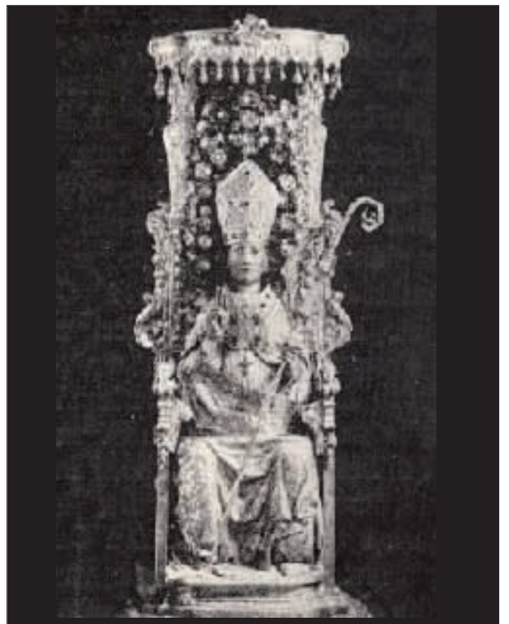
La statua di Sant'Erasmus in una foto del 1903 impressa sulla croce

PELLA, proprio durante questo episcopato si realizzarono buona parte delle statue argentee dei santi patroni. Anche l'altare maggiore della Cattedrale venne beneficiato dalle attività del Vescovo de Torres: nel 1710 fece completare il rivestimento in marmo sopra la mensa ponendo ai lati del tabernacolo il suo stemma. Anche la chiesa dei Santi Apostoli Pietro e Paolo venne fondata dal medesimo vescovo il 28 giugno 1711 nell'attuale Piazza Di Liegro (rasa al suolo nel 1807), anche in questo caso vi fu un donativo personale per la costruzione. Giuseppe II Guerriero de Torres venne sepolto nella chiesa di S. Caterina. Ma ritornando agli abbellimenti della Cripta della Cattedrale, sappiamo che il busto di Sant'Erasmus venne adattato, nel 1718, a figura completa con il santo in abiti pontificali, con pastorale gotico, in atto di benedire, seduto su