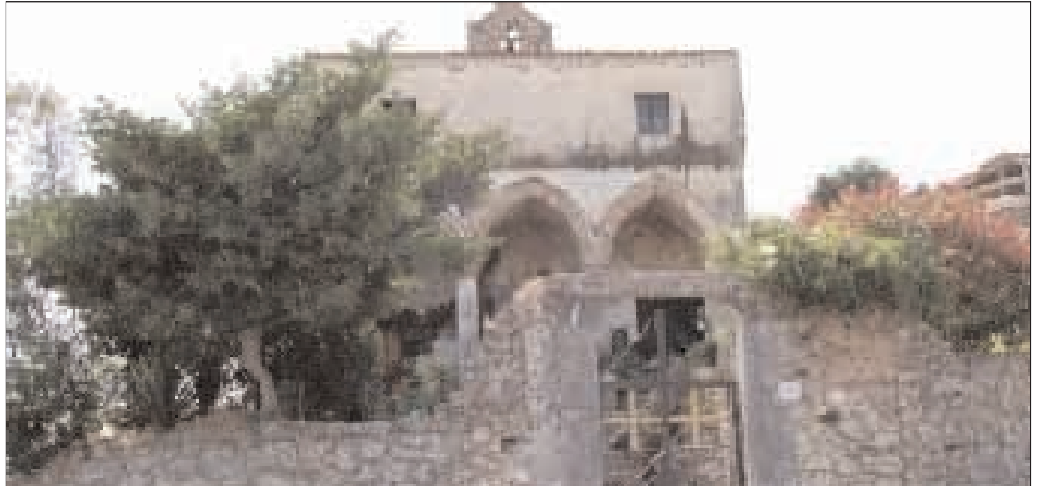
La Chiesa della Libera a Fontana Perrelli