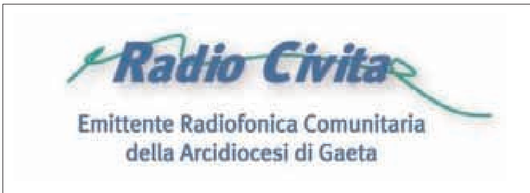
Il logo di Radio Civita