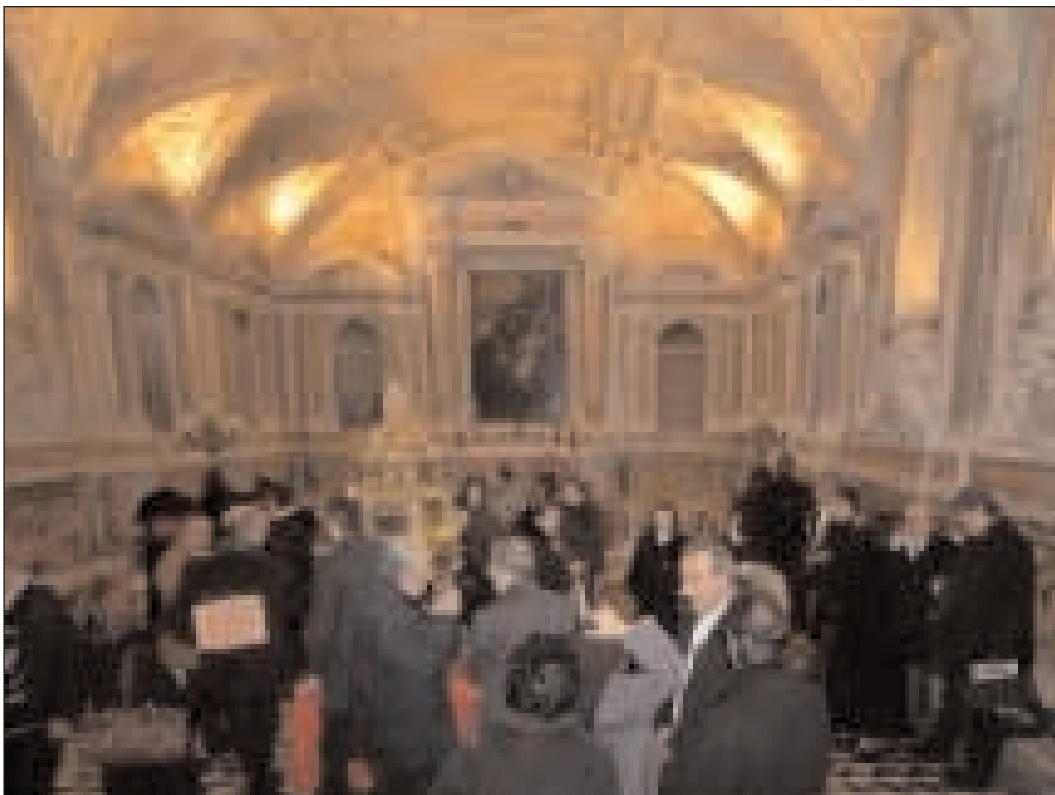
La cripta della Cattedrale affollata in occasione della visita guidata dopo la presentazione dell'affresco di San Rocco