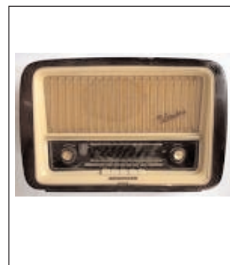
Una radio al passo con i tempi

(duecento radio cattoliche in Italia insieme) una costante e aggiornata informazione nazionale in onda ogni ora e varie rubriche di approfondimento su lavoro, vita, opinioni, storie e personaggi. Inoltre vengono trasmesse in diretta molti degli eventi organizzati presso le sale