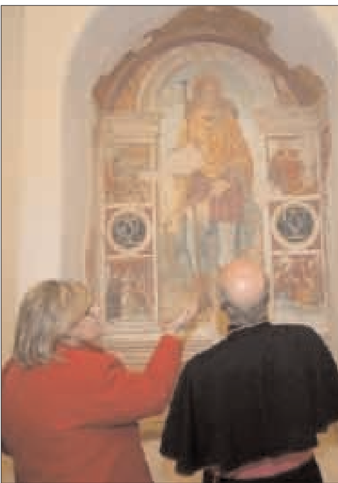
La Soprintendente e l'Arcivescovo ammirano l'affresco di San Rocco nel Museo

Ora, da un lato, l'opera torna ad essere ammirata dagli studiosi d'arte e dal vasto pubblico, dall'altro, va ad arricchire il nostro Museo Diocesano che acquista ancor più spessore e valenza, cosa che senz'altro si può ascrivere a tutto merito sia dell'Arcivescovo, impegnato in prima persona.