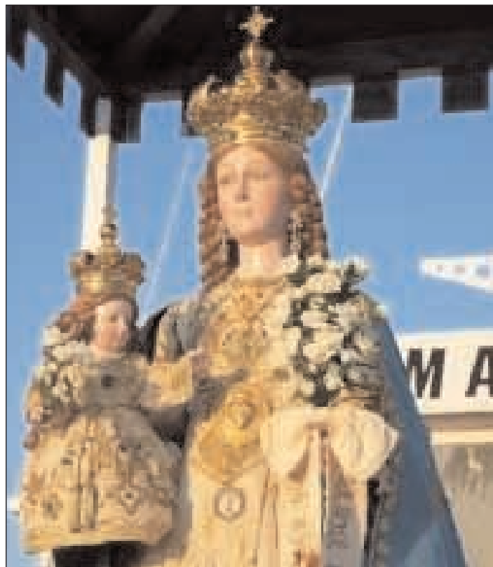
L'icona della Madonna di Porto Salvo