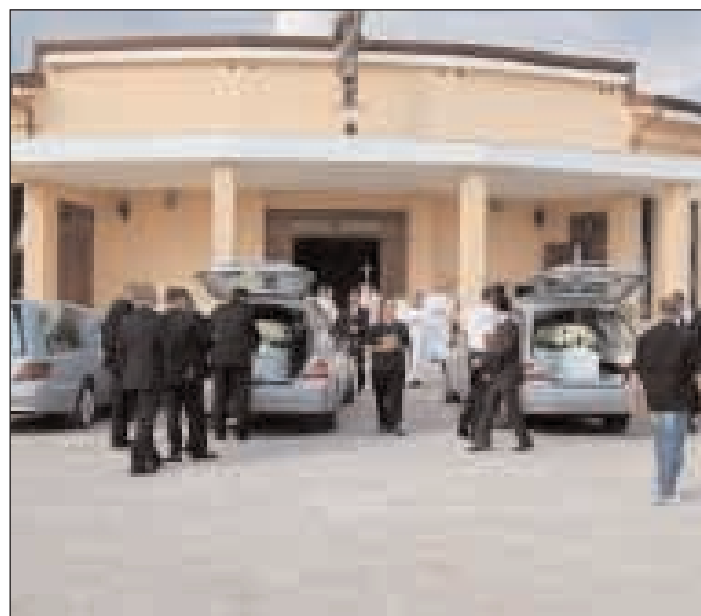
L'arrivo delle salme nel piazzale della Chiesa del Buon Pastore