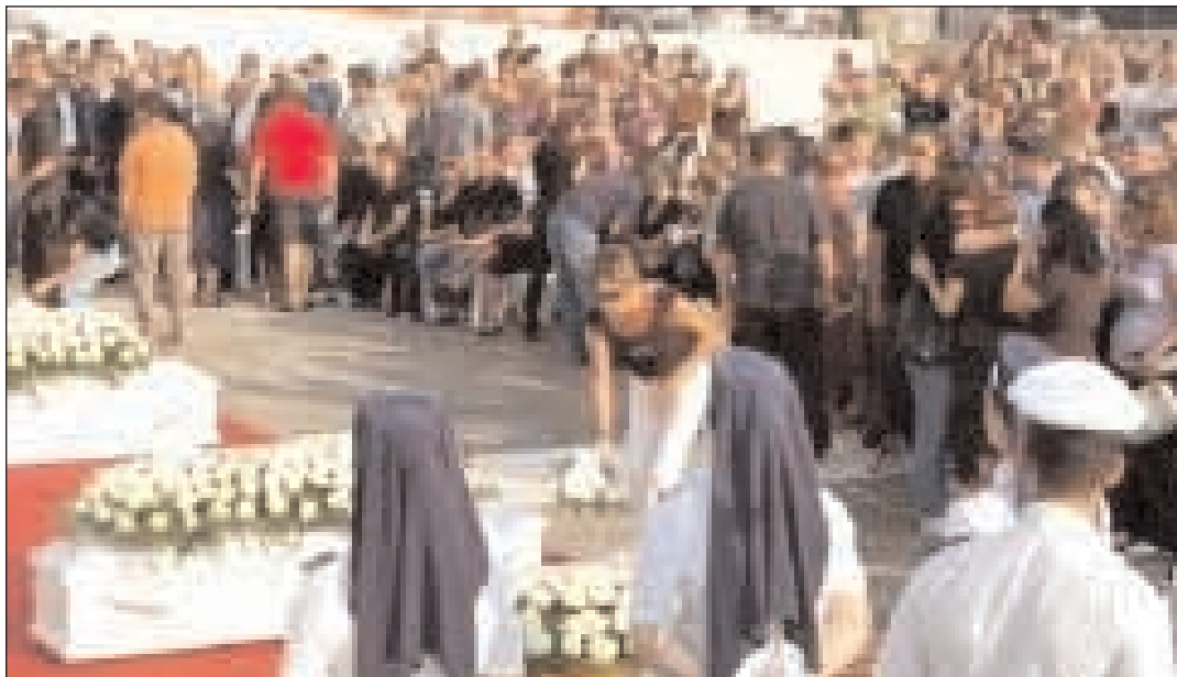
L'omaggio ai quattro ragazzi