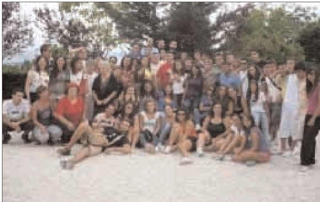
I giovanissimi di seconda fascia e gli accompagnatori ad Amendola