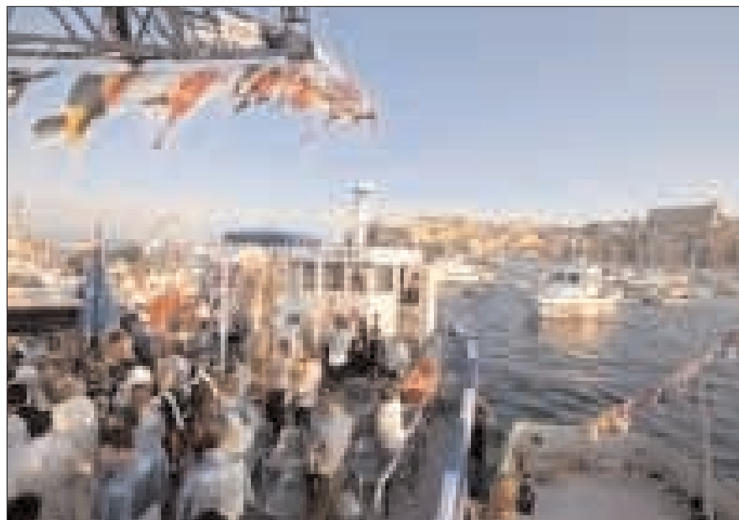
La Spicamar trasporta la Madonna di Porto Salvo