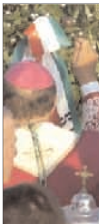
L'Arcivescovo benedice la corona