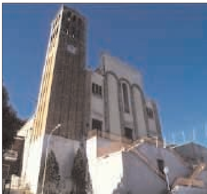
La parrocchia dei Santi Cosma e Damiano sita nel comune omonimo

croce nel nimbo e con la mano destra benedice alla maniera greca; la Madonna indossa la tunica blu (segno di umanità) e il manto porpora (segno di regalità); l'Odigitria mostra, sul capo e sulle spalle, tre stelle (simbolo della verginità prima, durante e dopo il parto); gli inserti in oro sulle vesti di Gesù e della Madonna rappresentano la gloria di Dio. Particolarmente commovente è stato l'arrivo della statua della Madonna a Gaeta da Ortisei, la cerimonia di accoglienza, svoltasi nella paradisiaca cornice della spiaggia dell'Ariana e del Baja Blanca, ha donato un momento di alta spiritualità per tutti i partecipanti, parrocchiani di San Nilo e turisti presenti in città. La benedizione dei lidi al tramonto con la Madonna portata a spalla sul bagnasciuga, cerimonia presieduta dal nostro Arcivescovo, è stata la degna conclusione in preparazione dell'evento del giorno seguente: il trasferimento dell'Odigitria via mare dall'Ariana a Serapo con la fiaccolata sulla spiaggia e l'arrivo nella chiesa parrocchiale.