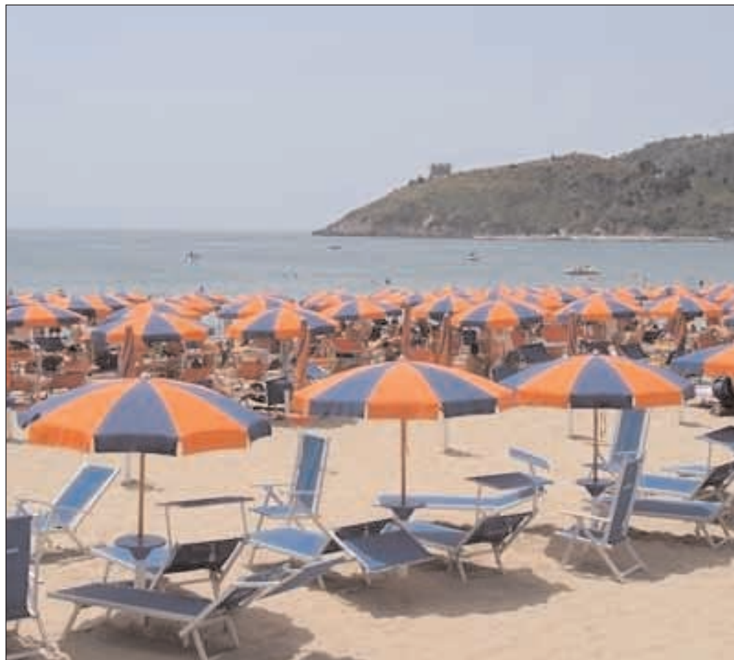
La spiaggia di Scauri