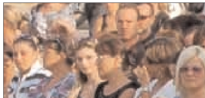
Il dolore della Piazza

rispecchio e rivedo in quelle parole gran parte dei miei coetanei. «Nessuno vi negherà mai spazi di incontro, nessuno vi impedirà di far festa ma vi supplico, non strapazzate la vostra vita ma siate sempre uomini», afferma con convinzione l'Arcivescovo dall'alto del suo compito. «Vivete sempre da uomini»: queste le parole che mi risuonano dentro vedendo quello strazio. Durante il canto di Comunione penso che se