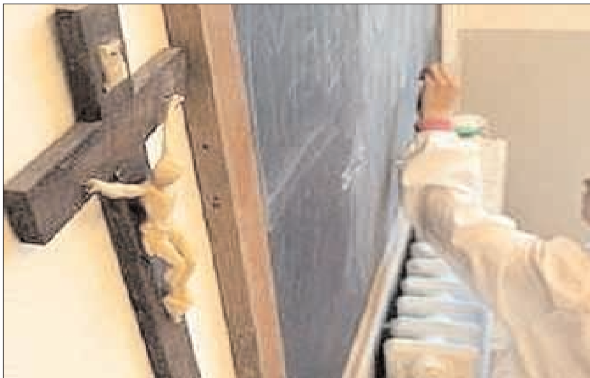
Crocefisso in aula

le regole che dovrebbero caratterizzare le relazioni interpersonali. Nel rapporto, se così possiamo definirlo, tra le Agenzie Recupero Crediti, i cittadini e le Associazioni dei Consumatori, il primo aspetto che si registra non senza disappunto, è l'arroganza dei toni, la minacciosità dei termini usati nella corrispondenza, la determinazione nell'agire senza prima accertare se veramente esistono le ragioni per pretendere il pagamento di determinati importi, la convinzione dell'impunità. Inoltre non sono da trascurare le responsabilità delle imprese che affidano l'incarico, le quali, in teoria dovrebbero essere le prime a valutare con attenzione la reale legittimità responsabili della loro condotta. Sono numerosi i casi di richieste di pagamento che giungono al sequestro dell'auto o di altri beni fino all'iscrizione dell'ipoteca sulla casa dei malcapitati, i quali per il mancato pagamento di cifre, a volte molto modeste, si vedono ipotecare persino beni di valore notevolmente superiori all'importo dovuto». La Lega Consumatori Lazio evidenzia: «Tutto ciò, e questo è l'aspetto più inquietante, può avvenire anche all'insaputa dell'interessato. Pensare di fare causa ad