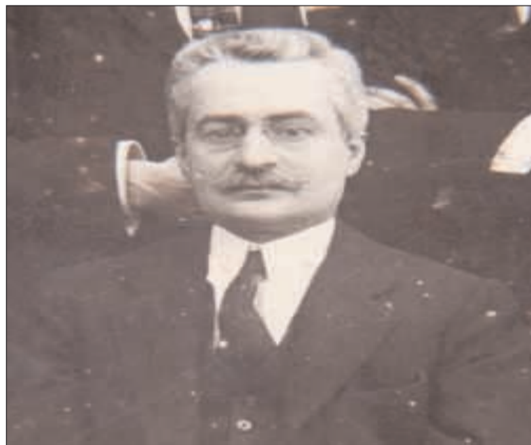
San Giuseppe Moscati