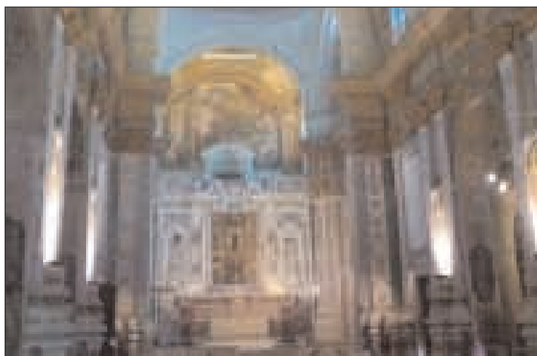
Il Museo Diocesano Donnaregina di Napoli

tuti nell'ambito del culto e degli orientamenti nella vita della Chiesa in Italia. Certamente interessanti sono stati gli interventi dei direttori e/o curatori dei musei di recente istituzione e le esperienze di coloro che stanno progettando e allestendo in questo momento nuovi allestimenti. Nel convegno si è dato spazio anche alle nuove tecnologie in funzione dei diversamente abili. Alla quattro giorni napoletana dell'Amei hanno partecipato buona parte delle diocesi italiane. Particolarmente gradito è stato l'intervento del Cardinale Crescenzo Sepe, Arcivescovo di Napoli, che ha ospitato il conve-