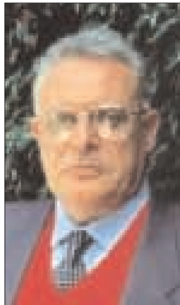
Prof. Francesco Paolo Casavola

Dall'Arcidiocesi di Amalfi - Cava dei Tirreni, con cui il nostro Arcivescovo S.E. Mons. Fabio Bernardo D'Onorio ha attivato proficue sinergie, ci inviano un invito con richiesta di pubblicazione sul nostro periodico. Acconsentiamo senz'altro, lieti anche dell'attenzione che ci siamo conquistati presso la prestigiosa sede episcopale di Amalfi che vede Arcivescovo S.E. Mons. Orazio Soricelli. Si tratta del Simposio Nazionale della Cultura «Le radici del futuro», che si tiene ad Amalfi dal 21 novembre 2009 al 21 marzo 2010. Sabato prossimo 21 alle 10 presso la Sala Museale