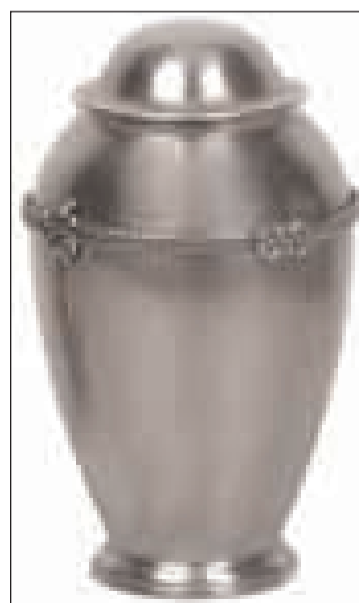
Un'urna per le ceneri

1974, tenendo conto di alcuni adattamenti suggeriti da trentacinque anni di uso. In particolare, sarà introdotto un formulario per quanti scelgono la cremazione. Come è noto, la Chiesa, pur preferendo la sepoltura tradizionale, non riprova tale pratica, se non quando è voluta in disprezzo della fede, cioè quando si intende con questo gesto affermare il nulla in cui verrebbe ricondotto l'essere umano. Per questo in futuro si promuoverà una riflessione a tutto campo sul senso della vita e della morte a fronte di una cultura che mascherava o esorcizzava la fine. Si vuole così risvegliare la memoria dei defunti attraverso la preghiera, bandendo ogni forma di ricerca del macabro e del demonismo. La memoria dei defunti e la familiarità con il camposanto sarà un modo concreto per contrastare la prassi di disperdere le ceneri o conservarle al di fuori del cimitero o di una chiesa.