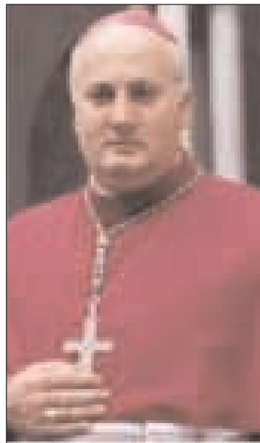
Mons. Orazio Soricelli

del Crocifisso in Amalfi avrà luogo la cerimonia di apertura del simposio della Cultura con una «Lectio magistralis» di Francesco Paolo Casavola, presidente del Comitato Nazionale di Bioetica, sul tema «Scienza ed etica si incontrano, per ragionare sul tema della vita, sulla sua difesa e sulla qualità della morte stessa». Considerata l'attualità e la rilevanza dell'argomento, nell'attuale momento storico, l'Arcidiocesi di Gaeta invita tutti a intervenire. Ricordiamo che il professore Casavola è stato in passato preside della Facoltà di Giurisprudenza dell'Università Federico II di Napoli e presidente della Corte Costituzionale.