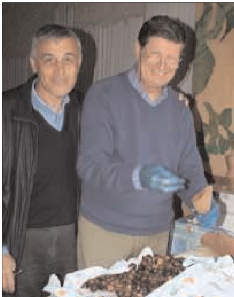
Un momento della preparazione delle castagne

Grazia hanno organizzato una simpatica "Castagnata pro Missione Congo". Le Suore dell'Orto godono da sempre