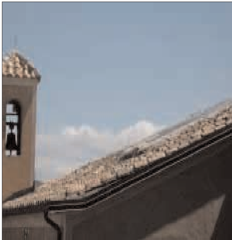
Il particolare del tetto della Chiesa di San Bartolomeo crollato