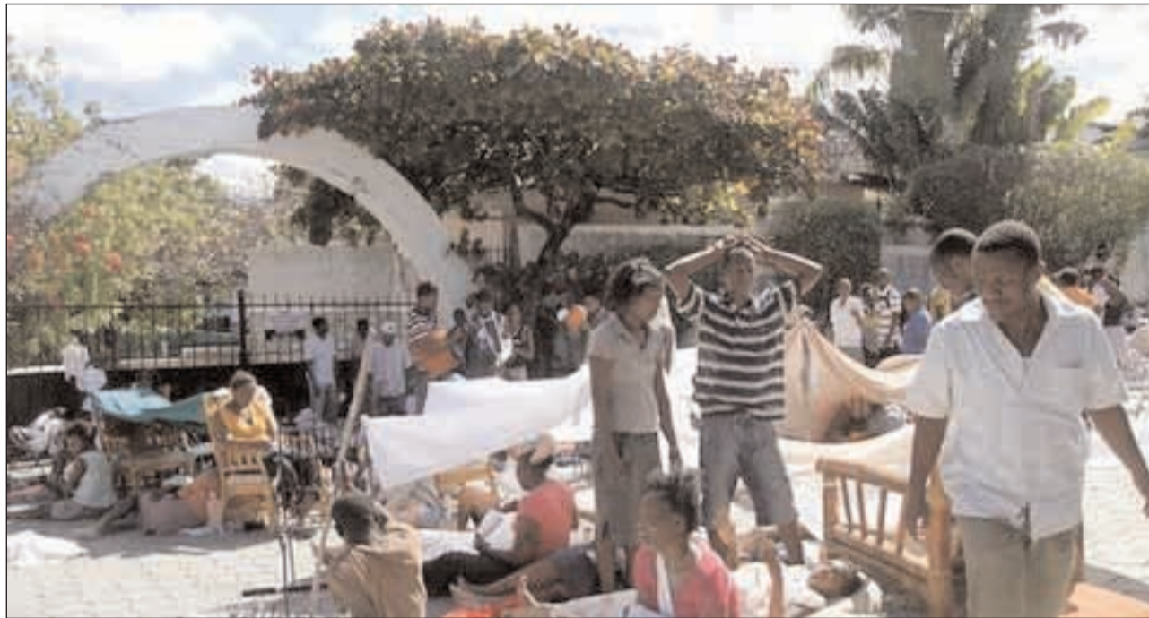
Haiti sconvolta dal terremoto

L a Chiesa Cattolica italiana esprime la propria vicinanza alla popolazione, vittima delle violentissime scosse di terremoto, che hanno seminato morte e distruzione ad Haiti, in particolare nella capitale, Port-au-Prince, e nella parte ovest dell'isola caraibica. La Presidenza della Conferenza Episcopale Italiana ha invitato le comunità ecclesiali a pregare per quanti sono stati colpiti dal tragico evento e a sostenere le iniziative di solidarietà promosse dalla Caritas italiana con l'obiettivo di alleviare le sofferenze di quella popolazio-