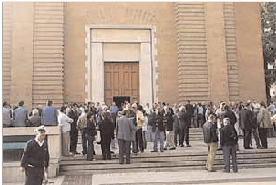
La Chiesa dei Santi Lorenzo e Giovanni Battista di Formia

È cominciato venerdì e terminerà oggi uno degli appuntamenti più attesi dalla comunità parrocchiale dei Santi Lorenzo e Giovanni Battista: la Tenda della Pace. La Tenda della Pace è una idea nata nel 2004 dal Gruppo Giovani della Comunità parrocchiale. Attraverso le attività che caratterizzano le tre giornate, si può riuscire a capire il messaggio che ogni anno si vuole lanciare e cosa oggi rappresenta la Pace nelle nostre parrocchie, nella nostra città, nella nostra vita quotidiana e anche nella nostra interiorità. La riflessione, il confronto, il dialogo, il fare comunione ed il semplice stare insieme: sono questi gli ingredienti che hanno sempre caratterizzato questa straordinaria iniziativa. L'edizione 2010, intitolata "Se vuoi coltivare