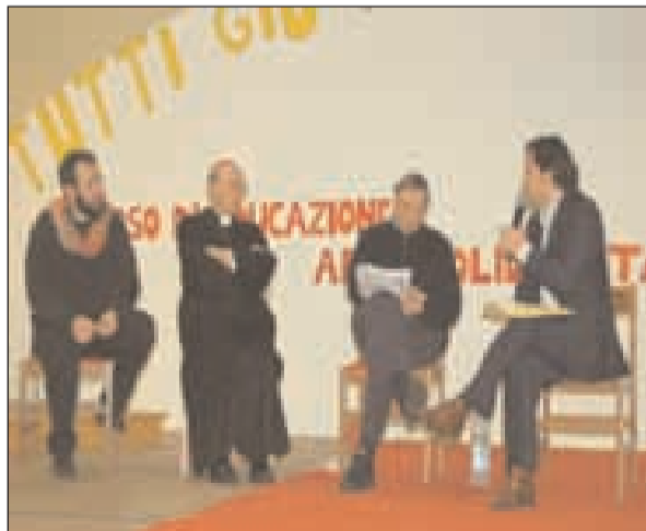
Al centro il nostro Arcivescovo affiancato da don Ciotti di Libera

Libera al Parlamento perché venga ritirato l'emendamento alla legge finanziaria che prevede la vendita dei beni confiscati alle organizzazioni mafiose che non si riescono a