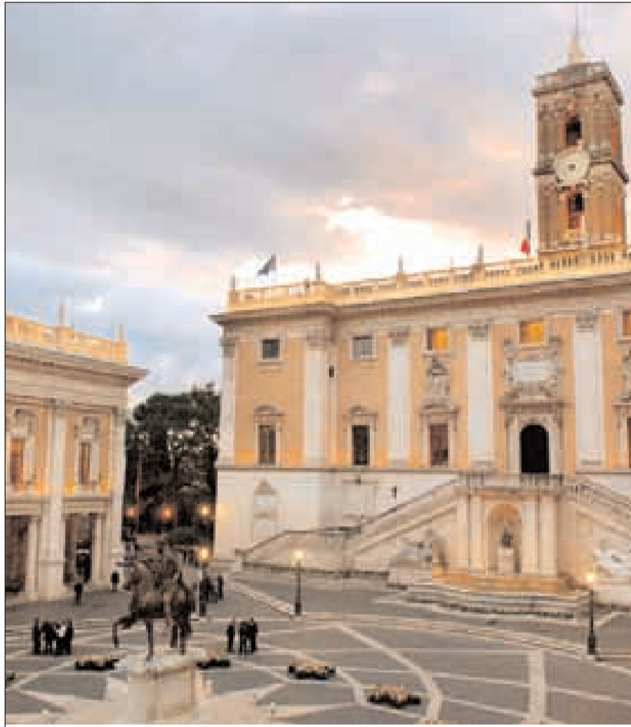
Il Campidoglio a Roma