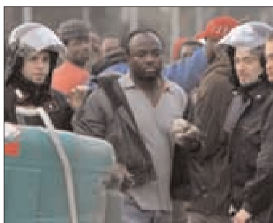
I disordini a Rosarno