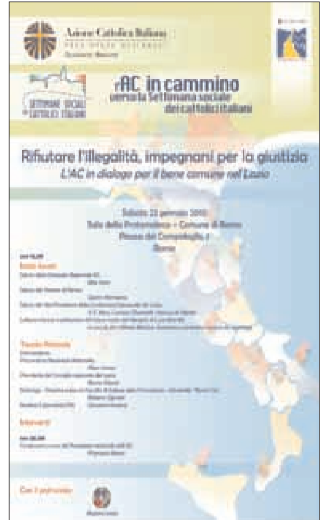
La locandina della tavola rotonda