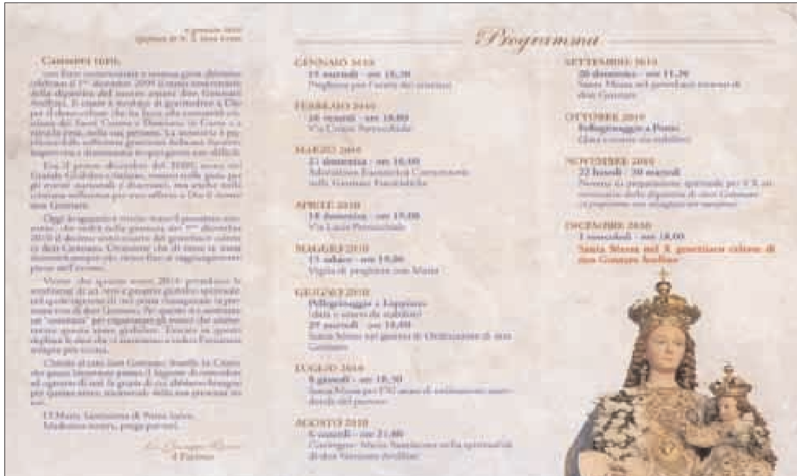
La locandina degli eventi in programma per il X Genetliaco