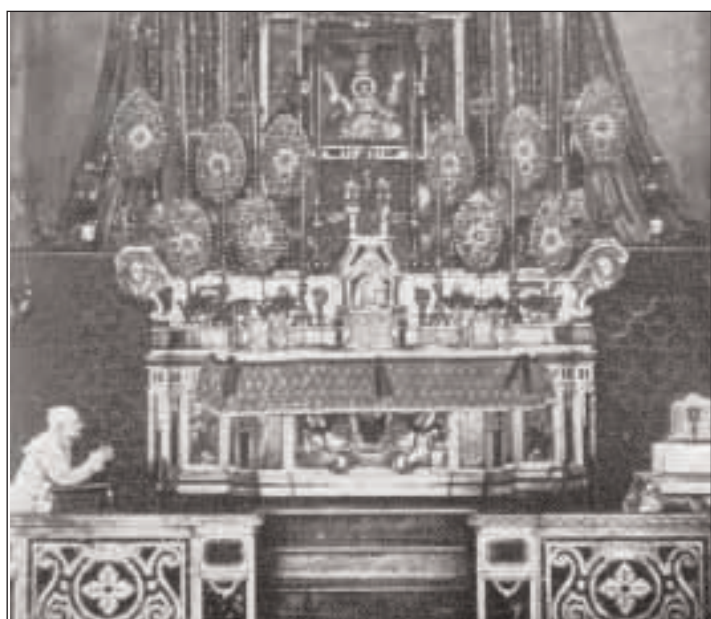
La visita di Papa Pio IX al Santuario darà l'idea allo studio fotografico Calise - Gaeta di realizzare, negli anni successivi, un riuscito fotomontaggio con il Pontefice in preghiera a lato dell'altare e, in bella mostra, il calice lasciato in dono dallo stesso pontefice. L'artificio dell'abile fotografo gaetano sarebbe stato un rarissimo esempio di fotografia di un Pontefice prima della metà del secolo da ascrivere dunque alla storia della fotografia; qui, invece, il Papa appare notevolmente più anziano rispetto al ritratto realizzato per la medagliistica durante il soggiorno in Gaeta; inoltre è posto in posizione defilata rispetto ad un naturale seggio d'onore posto al centro della balaustra.

senti sull'icona con elementi decorativi in oro e pietre dure. È ancora vivo il ricordo della visita di Giovanni Paolo II agli ammalati proprio nel Santuario della Civita il 25 giugno 1989. Per completezza bisogna ricordare l'anno 2002 quale ultima discesa in Itri della miracolosa immagine in occasione del 225 anniversario dell'incoronazione. All'epoca l'immagine era stata di recente restituita al Santuario (19 aprile 2002) dopo un restauro filologico che ne aveva rimosso le corone. Ritornando all'avvenimento del 1491 probabilmente non tutti sanno che il Santuario conserva un calice realizzato proprio nell'anno di consacrazione, oggi esposto nella mostra "Gli Argenti di Gaeta" presso Palazzo De Vio: si tratta di un manufatto in rame, argento e oro che presenta sulla base polilobata un'epigrafe con la data dell'8 agosto 1491. Il calice presenta sul nodo esagonale un pomolo con motivi vegetali e 4 piastre d'argento graffite con rappresentazioni araldiche e figure a soggetto religioso. È significativo che su una delle quattro piastre romboidali ci sia incisa l'immagine della Madonna con il Bambino in braccio entrambi incoronati. Il calice, ma soprattutto gli stemmi e l'epigrafe meriterebbero approfondimenti e studi specialistici.