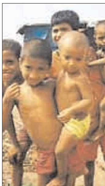
I bambini del Bangladesh

I nstillare patriottismo nei giovani! Così inizia un articolo del Daily Star del 29 giugno 2009, in cui si plaude alla decisione del comitato competente di incorporare la Storia della Guerra di Liberazione del Bangladesh nei testi di storia, a partire dalla scuola secondaria. Nella classe VIII (la nostra III secondaria) viene addirittura riproposto lo storico discorso tenuto il 7 marzo 1971 dal Padre della Patria: Bangabandhu Sheikh Mujibur Rahman e la formazione del primo governo del paese, con le sue attività sino alla proclamazione dell'indipendenza. Lettere e saggi dei martiri dell'indipendenza saranno incluse nei testi di storia, a partire dalla classe VI (la nostra I secondaria). La proposta, pre-