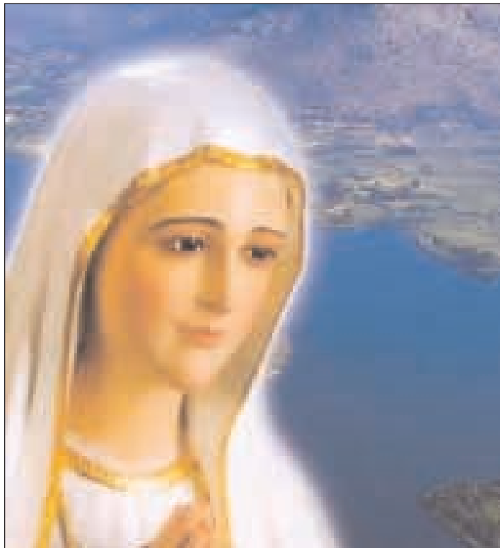
La statua itinerante di Fatima