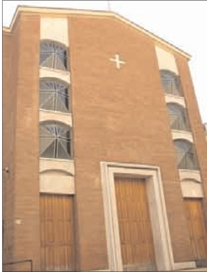
La Chiesa Madonna del Carmine a Formia

un gruppo di essi che si chiamarono poi "Fratelli della Beata Vergine Maria del Monte Carmelo", costruirono una cappella dedicata alla