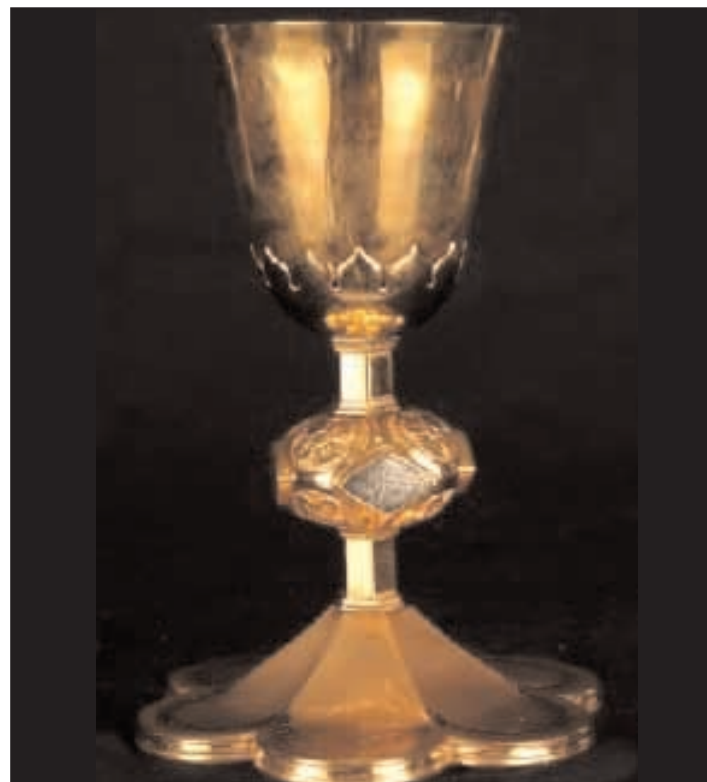
Il calice realizzato nel 1491 e al centro della mostra 'Gli Argenti di Gaeta'

della prima pietra del nuovo santuario: i lavori terminano nel 1826. Nel 1839 venne fusa la statua argentea della Madonna grazie al contributo della popolazione del territorio. Il 10 febbraio 1849 il Papa Pio IX, accompagnato da Ferdinando II di Borbone, giunge in Itri e proseguì a cavallo verso il Santuario dove lo attende l'Arcivescovo Luigi Maria Parisio (1827 - 1854) e il clero diocesano. Il Pontefice celebra l'Eucarestia e dona al Santuario un calice in argento. Oltre al calice, alla Civita si conserva il camice che utilizzò il Papa per la celebrazione e alcune epigrafi a ricordo