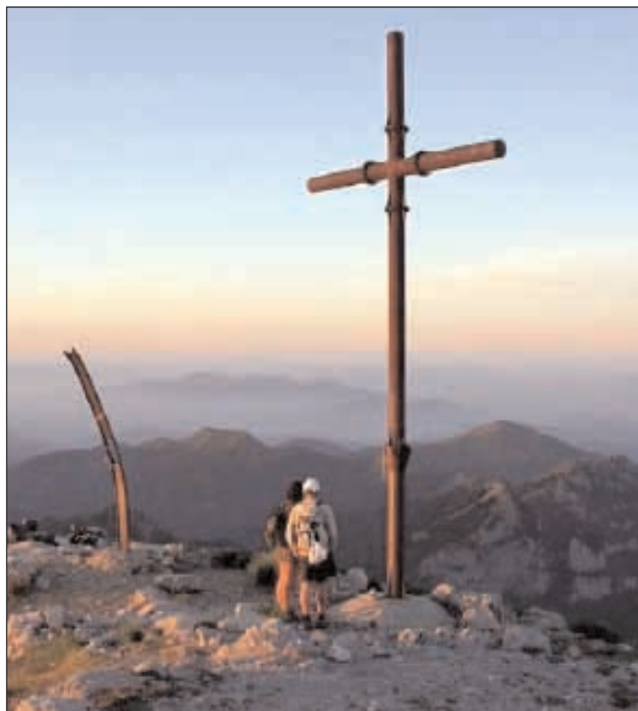
La contemplazione come valore principale per ogni buon cristiano

T rattare della contemplazione è, indubbiamente, arduo nell'oggi, in cui il fare è in cima alla scala dei valori, cui si congiunge il rincorrere innumerevoli cose. Eppure la contemplazione ci riguarda tutti dal momento in cui affermiamo di avere scelto, autenticamente, la fede cristiana. Un tempo si poteva dire che riguardasse soltanto i monaci e le monache degli ordini, appunto, contemplativi. Ma molte cose hanno spinto a fare uscire la contemplazione dalle mura dei conventi ad essa precipuamente ordinati. Il secolo ventesimo ha rappresentato, anzi, - sotto il profilo della riscoperta della contemplazione, quale impegno riguardante anche i laici, per cui un modello tipico si pone Maria di Magdala, che usava sostare in contemplazione ai piedi di Gesù, -- un secolo singolare. Intorno agli anni cinquanta "Semi di contemplazione" - Edizione Garzanti - avvincente opera del famoso monaco Thomas Merton, entrato in una trappa degli Stati Uniti dopo una esperienza non proprio edificante, rende la contemplazione un valore di agevole intelligenza con il suo stile contrassegnato da immediatezza. Jacques Maritain, filosofo francese, che ebbe grande notorietà, anch'egli, intorno alla metà del secolo, e fu amico di Paolo VI, tratta anche lui