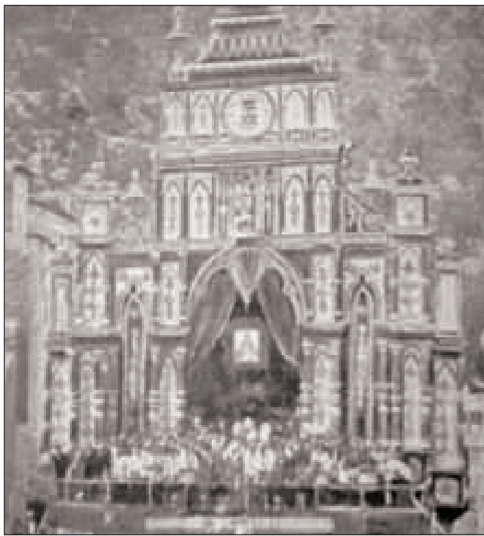
La seconda incoronazione dell'icona della Civita ad opera di Pio IX