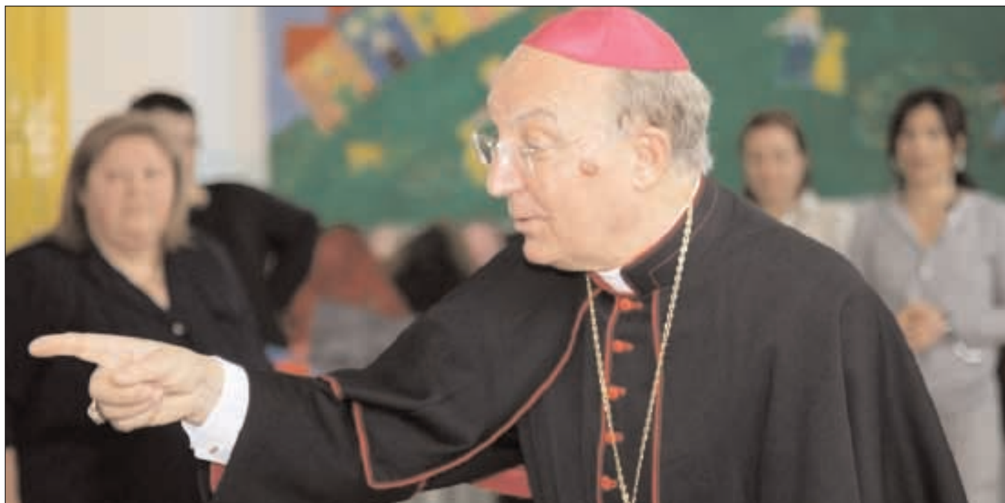
L'Arcivescovo di Gaeta durante una visita scolastica sembra indicare la rotta da seguire