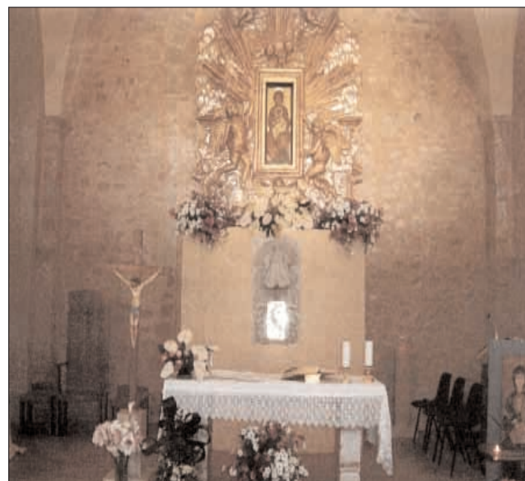
L'altare e l'icona mariana