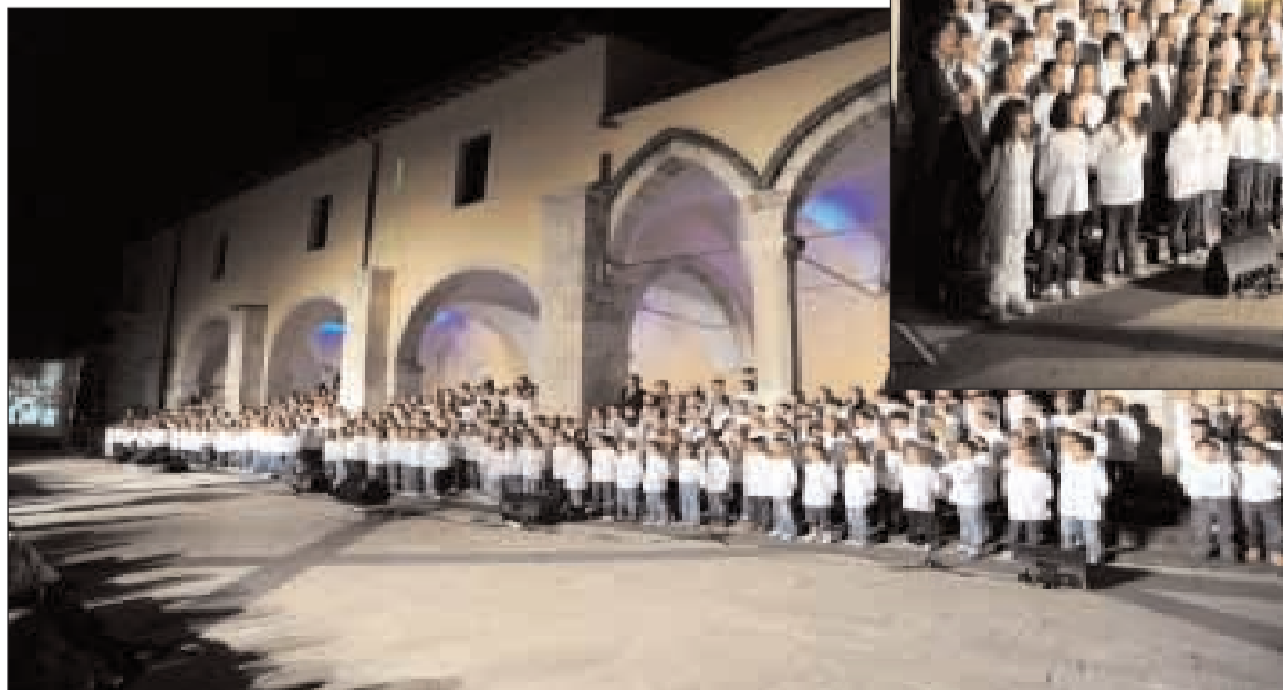
Due momenti dello straordinario evento