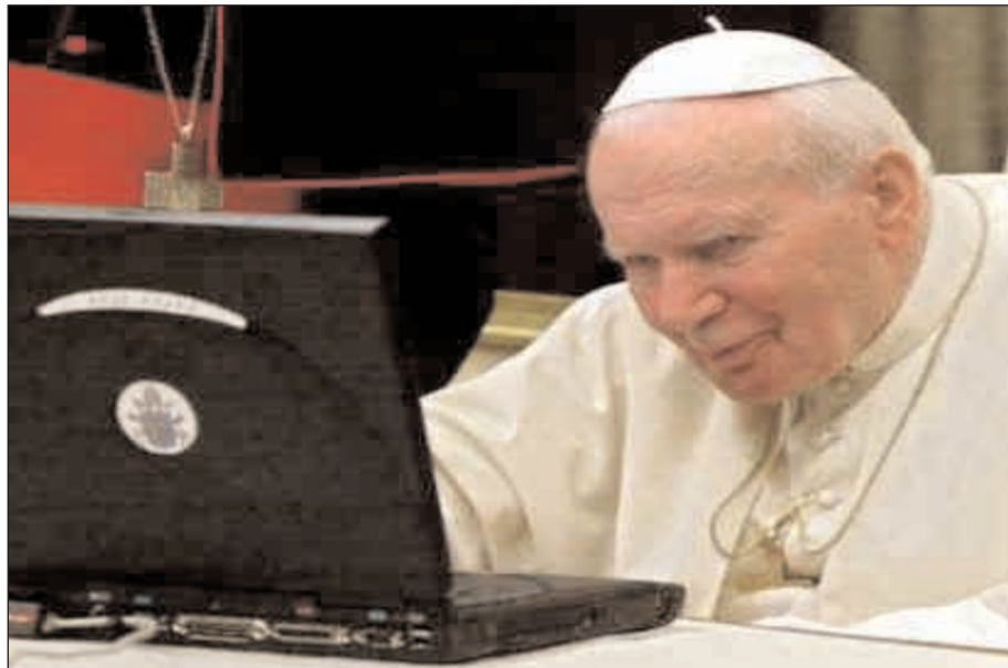
Il compianto Giovanni Paolo II ha vinto la sua sfida col web