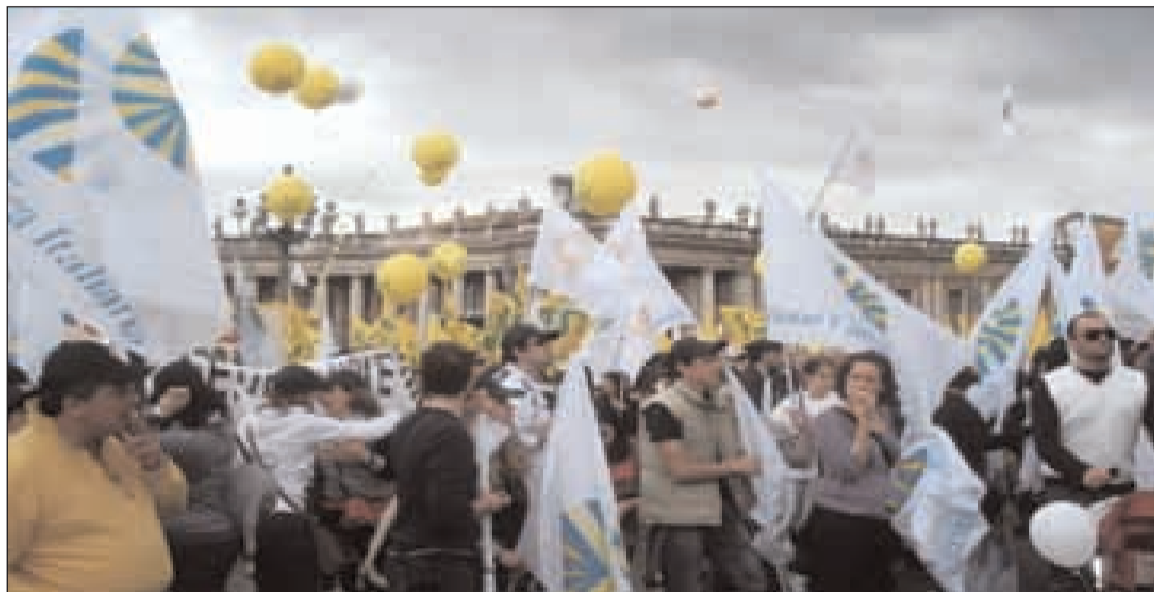
Le diverse delegazioni presenti in Piazza San Pietro