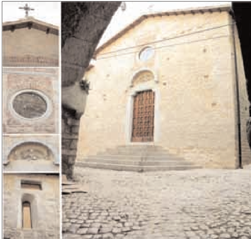
Il Santuario di Maria Santissima delle Grazie a Sonnino