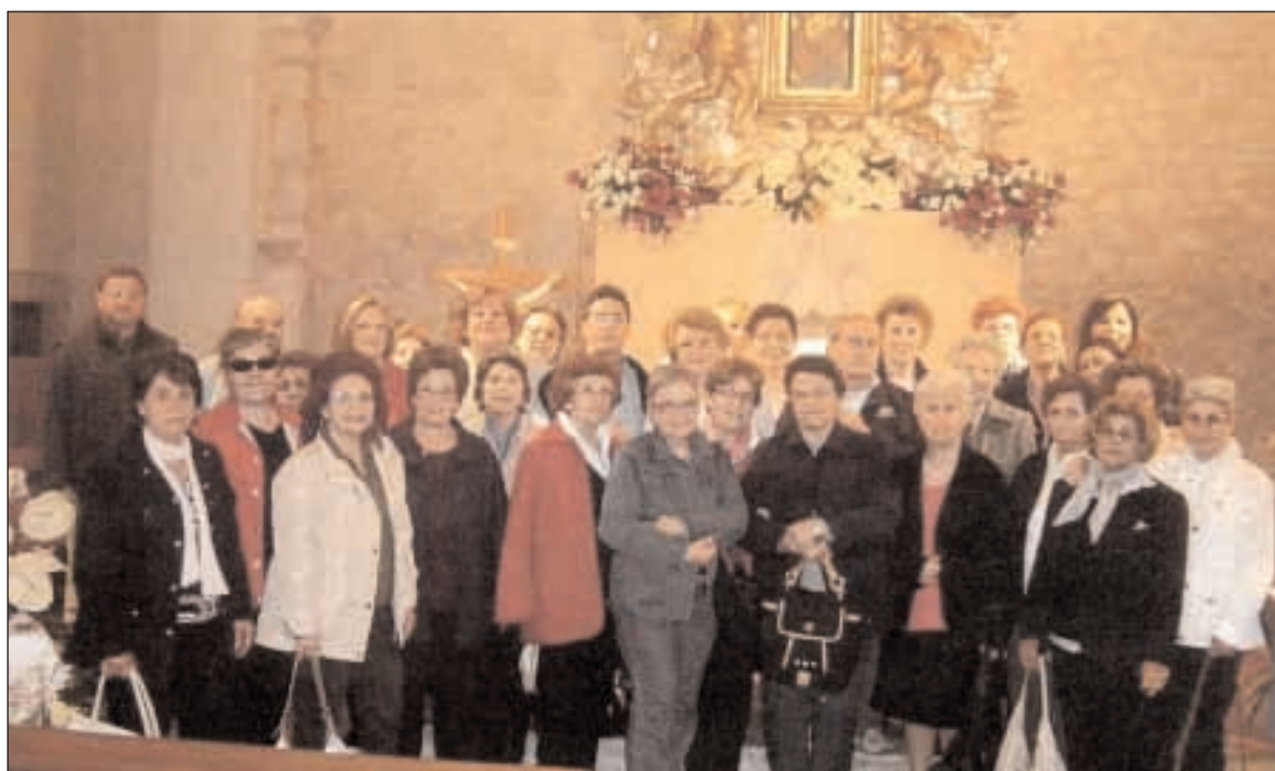
Foto di gruppo per gli appartenenti alla Confraternita

'Portella'(Piazza Garibaldi).Alla conta serale mancavano sette miti pecorelle ed il pastorello tutto preoccupato, guardava da anfratto in anfratto per ritrovarle prima del buio. Dopo tanto vagare le sue speranze stavano scemando, quando un flebile belato indicò all'angosciato giovinetto la cima del colle. Giunto trafelato in tale sito vide tra la sua grande meraviglia e commozione che le sette pecorelle veneravano genuflesse una splendente immagine della Madonna. Gridò al miracolo con tutto l'ardore del suo giovane petto, e dopo poco tempo tutte le pendici del colle Sant'Angelo brulicavano di pastori e di massaie che salmodiando si recavano a venerare la Madonna apparsa sull'albero. Nello stesso posto venne costruita in primo tempo una piccola nicchia, successivamente una Cappella, indi una Chiesa ed ora un fastoso santuario per la gloria di Maria Santissima". E da quasi duemilacinquecento anni con Provvedimento Pontificio la Madonna delle Grazie di Sonnino è stata assunta a patrona del paese in riconoscimento delle tante grazie che la Vergine ha elargito. Proprio qualche anno fa (2004-2005) grazie ad un brillante e meticoloso lavoro di restauro quell'antico e significativo monumento, simbolo di fede, di arte, di cultura e di storia, ha riacquisito il suo antico splendore.