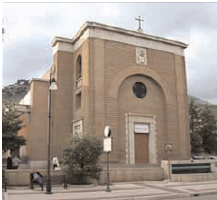
La Chiesa di San Giovanni Battista e di San Lorenzo diacono. La strategia di base sta nel coinvolgimento a tutti i livelli, dei ragazzi che si devono sentire protagonisti di una storia che loro stessi costruiscono giorno per giorno, con la collaborazione di

In questi giorni gli educatori dell'Oratorio della parrocchia Santi Lorenzo e Giovanni Battista sono impegnati nell'organizzazione del GREST 2010. GREST sta per GRUppe ESTivo. E' un'esperienza estiva caratterizzata da una intensa forza educativa, basata sulla convivenza di ragazzi/e di diverse età e animatori che insieme giocano, imparano, lavorano, si divertono con lo stile proprio dell'oratorio. Si differenzia da altre proposte ricreative "laiche" per una sua particolare attenzione alla dimensione religiosa che traspare dal clima educativo, ma anche dalla proposta esplicita di Gesù Cristo nei momenti di riflessione e preghiera, ben armonizzati con il tema e la struttura organizzativa.