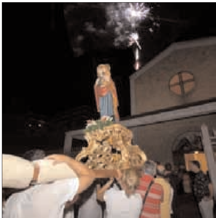
Particolare della processione devozionale

L a Madonna Odigitria (colei che istruisce, che mostra la direzione), altrimenti nota anche come Vergine Odigitria, Theotókos Odigitria e Panagía Odigitria, è un tipo di iconografia cristiana diffusa in particolare nell'arte bizantina e russa del periodo medioevale. L'iconografia è costituita dalla Madonna a mezzo busto (nel caso della statua, a busto intero) con in braccio il Bambino Gesù seduto in atto benedicente che tiene in mano una pergamena arrotolata e che la Vergine indica con la mano destra (da qui l'origine dell'epiteto).