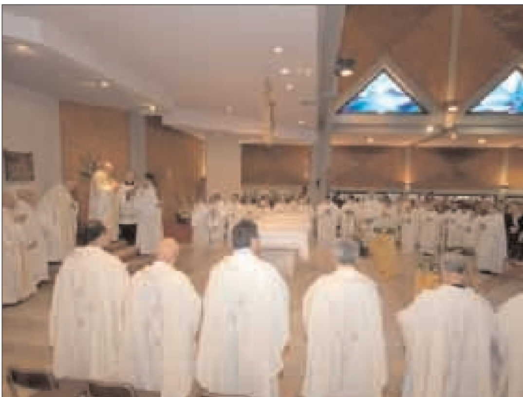
Apertura del Sinodo Diocesano in Gaeta