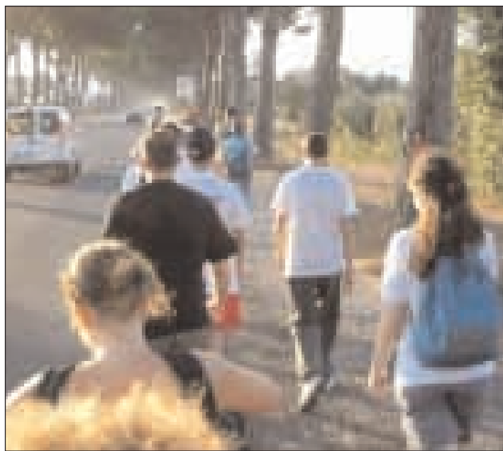
In viaggio verso Roma come San Paolo

Q uali sono i motivi che solitamente spingono una persona a mettersi in viaggio? Scoprire, fuggire, vivere, conoscere, dimenticare... sono davvero numerosi, e sicuramente le ragioni che hanno spinto noi, 34 giovani dell'Arcidiocesi di Gaeta, a intraprendere l'avventura dell'Homo Viator sono tutti validi e differenti. L'importante, però, è che ognuno ha avuto il coraggio e la voglia di «abbandonare la propria stanza e mettersi in viaggio». Il cammino è iniziato ufficialmente alle sei del 10 Agosto quando il gruppo dei "folli viandanti", forse ancora preda dell'incoscienza ma sicuramente carico di energia e di voglia per «volare oltre i limiti dell'ordinario», è partito dal Monastero di San Magno a Fondi per raggiungere, dopo ben 17 km, la parrocchia di San Domenico Savio a Terracina. Lì abbiamo avuto il piacere e la fortuna di incontrare i membri dell'associazione "Io con Te" che, tramite attività di teatro e di scuola di ballo, unisce ragazzi diversamente abili, e non, lavorando con loro e le loro famiglie facendo una bellissima opera di integrazione. Dopo questo interessante incontro e un delizioso pranzo, offerto dalla Caritas parrocchiale, di nuovo in cammino, questa volta verso Pontinia, dove ci ha gentilmente ospitato la parrocchia di Sant'Anna. La stanchezza, a questo punto, ha iniziato a farsi sentire. I primi autografi di Dio (le tanto temute vesciche) hanno cominciato a fare capolino, ma i due timbri presenti