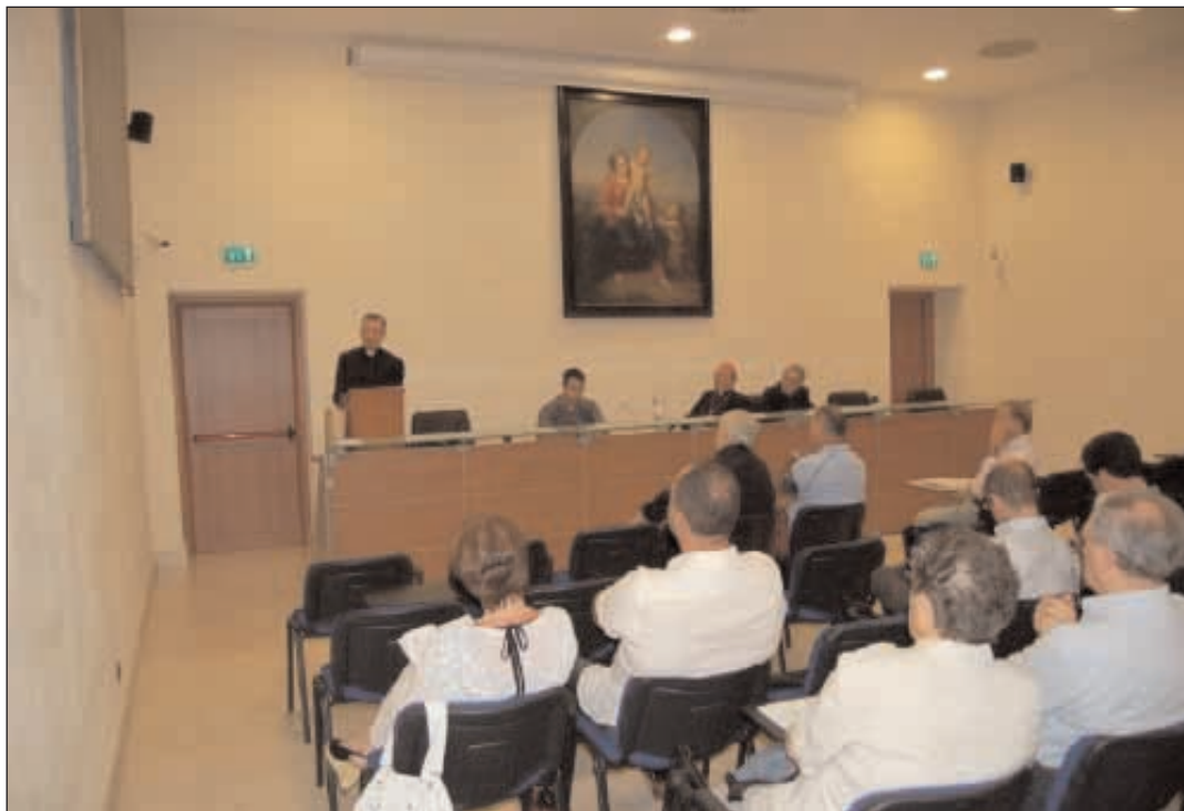
La sala delle conferenze durante l'esposizione di don Pietro Antonio Ruggiero

D ire che il Sinodo è luogo di ascolto e di dialogo potrebbe apparire pleonastico, ma non di certo superfluo. Si tratta, infatti, in primo luogo di quell'ascolto della Parola che deve precedere ogni assemblea sinodale. Così san Cirillo d'Alessandria racconta del Concilio di Efeso (431): «Allora il santo Sinodo non senza difficoltà e tra le ritrosie di alcuni fu radunato nella santa chiesa, detta di Maria, e costituì suo membro anzi come suo capo Cristo; infatti sul santo trono fu collocato il venerando Evangelo, il quale poco mancò che non gridasse ai santi vescovi: giudicate secondo giustizia, decidete fra i santi Vangeli e i clamori del mondo» (Apologeticus, in Cyrilli Alexandrini Opera, ed Aubert VI, Parigi 1638 in Il libro dei Vangeli nei Concili ecumenici, Roma 1963,40). Ed un altro presidente di concilio, Tarsio di Costantinopoli, afferma: «Essendoci seduti tutti, costituimmo presidente Cristo. Fu deposto infatti nel sacro seggio il santo Evangelo che a tutti noi convenuti, uomini sacri, diceva: giudicate secondo giustizia: decidete fra la Chiesa di Dio e le novità del mondo» (Idem.) E' chiaro, dun-