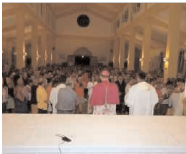
La Chiesa di San Nilo affollata di fedeli