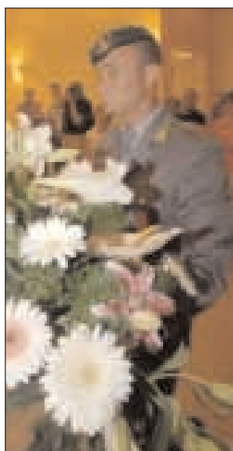
L'omaggio delle autorità militari