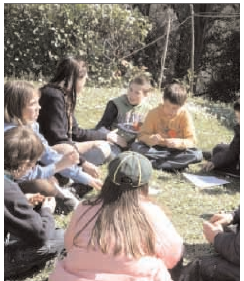
Un gruppo di giovani escursionisti dell'Azione Cattolica

“condizione indispensabile per la pace, è quello di amministrare con giustizia e saggezza le risorse naturali della Terra” da qui il titolo del suo messaggio “Se vuoi coltivare la pace, custodisci il creato” e il titolo della festa “CustodiAMO la Pace”. Gli educatori in collaborazione con i catechisti, mediante attività e giochi, illustreranno ai ragazzi, i problemi concreti che minacciano il creato (inquinamento, disboscamento, spreco di risorse energetiche, ecc...) e cercheranno di sensibilizzarli al problema con lo scopo finale di “piantare” un piccolo seme nel loro cuore, da custodire, al fine di cercare delle soluzioni mediante piccoli gesti che tutti loro potranno svolgere quotidianamente.