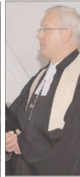
Primo piano del pastore luterano serve una forte convinzione.

cose. I testimoni sono convinti che la loro visione sia quella giusta. I testimoni sono capaci di influenzare il giudizio su una situazione. Testimoni di tutto ciò sono oggi i Cristiani, che in questo mondo si trovano di nuovo ad affrontare situazioni di imbarazzo e di diffidenza. Tante sono oggi giorno le indicazioni etiche e i modi di interpretare la giustizia, l'ospitalità, l'onestà che circolano e si accavalano in modo disordinato. I grandi propositi che la civiltà umana si è posta nel corso della sua storia travagliata sono spesso naufragati. L'uomo non è mai riuscito a giustificare il proprio essere. Troppo spesso le buone intenzioni sono rimaste tali. In questa situazione