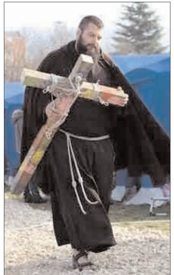
Un francescano con un crocifisso in una delle tendopoli

nali (cfr. aggiornamenti sul sito). La distanza della nostra diocesi dal luogo colpito dal terremoto non ci permette di realizzare i primi tre punti ma in molte parrocchie è già partita o è già stata effettuata la vendita dei cesti di specialità abruzzesi. Infatti dal sito del centro nazionale arrivano note positive: