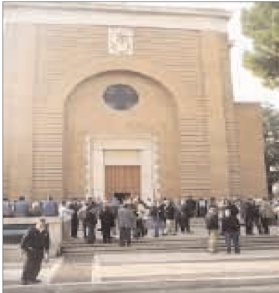
La Chiesa di San Giovanni a Formia