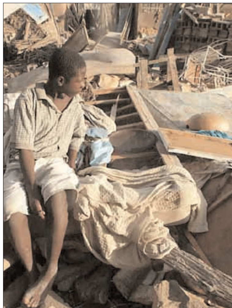
Distruzione ad Haiti

gni di duemila famiglie. Si stanno preparando kit di aiuti alimentari per cinquantamila persone. Benedetto XVI ha fatto appello alla generosità di tutti per una concreta solidarietà. La Chiesa italiana ha invitato alla preghiera per le numerose vittime e per tutte le famiglie colpite. Per far fronte alle prime emergenze e ai bisogni essenziali delle persone colpite dal terremoto, ha stanziato due milioni di euro dai fondi derivanti dall'otto per mille. Per sostenere gli interventi in corso si possono inviare offerte alla Caritas diocesana di Gaeta tramite il conto corrente postale numero 14254049 specificando nella causale: "Emergenza terremoto Haiti" oppure tramite le Caritas parrocchiali e/o brevi manu presso l'economato della Diocesi, sito a Palazzo de Vio - Gaeta.