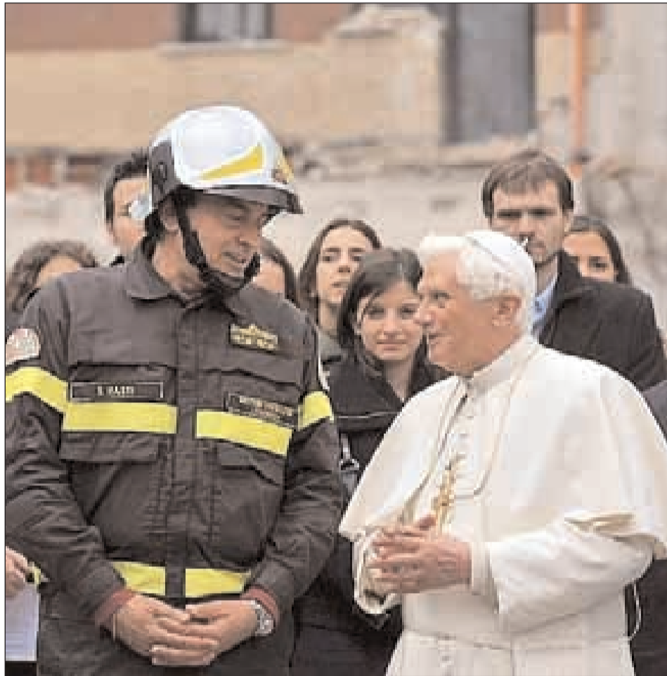
Il Papa Benedetto XVI in Abruzzo nel dopo sisma

L' Azione cattolica continua l'impegno in Abruzzo. Dopo la positiva esperienza, sia nell'immediato dell'emergenza sia nel periodo estivo, l'associazione nazionale intende dare continuità all'impegno attraverso alcune proposte rivolte in particolare alle diocesi più vicine all'Aquila ma che sono naturalmente praticabili da tutti. Si tratta di chiedere la disponibilità di aderenti qualificati che possano garantire la presenza in alcune parrocchie nei fine settimana (sarebbe sufficiente anche il solo giorno di sabato) per seguire la formazione e l'animazione dei gruppi e dell'associazione in alcune zone dell'Aquila. Ci troviamo di fronte ad una grande opportunità per rinnovare e rinforzare i legami associativi attraverso una esperienza che, oltre ad essere segno di fraternità e vita ecclesiale, conferma l'impegno dell'AC a stare in mezzo alla gente, in ogni situazione. L'Ac è impegnata soprattutto in 4 attività: continuare il campo-lavoro a Pile con disponibilità di tre (dal venerdì sera-sabato mattina alla domenica) o più giorni per una ampia e diversificata disponibilità al servizio delle varie necessità che possono essere segnalate sul posto, al momento; l'accompagnamento per l'avvio dell'Ac nelle comunità parrocchiali (Torninparte, St.Elia, Pizzoli, Pettino); l'avvio di proposte per gli