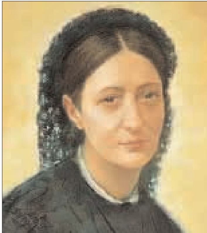
La neo Santa Caterina Volpicelli

Santi sacerdoti seppero guidarla e aiutarla a ricercare e comprendere la volontà di Dio che