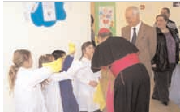
L'Arcivescovo incontra i piccoli studenti

lare degli alunni della Scuola Primaria "Alfredo Aspri", i bambini delle classi quinte qui presenti le porgono il più sincero "benvenuto tra noi!". La stavamo aspettando! Siamo lieti di incontrarla. Per molti di noi è il primo incontro con Sua Eccellenza e, come Gesù amava stare con i bambini, le siamo grati per aver desiderato di farci visita e passare un po' di tempo con noi. Che bello sarebbe, se Lei potesse ridiventare bambino per stare nella nostra scuola, fare amicizia e studiare insieme a noi! Ci piacerebbe conoscerla meglio e porle delle domande ma sappiamo che non ha molto tempo a disposizione. Per questo la invitiamo a raccontarci qualcosa di Lei e del suo Ministero così importante. Noi bambini vogliamo dirle che a volte viviamo la scuola come un dovere e una fatica, ma sappiamo che è una grande possibilità che ci viene offerta per imparare, per progredire e per aprirci agli altri.