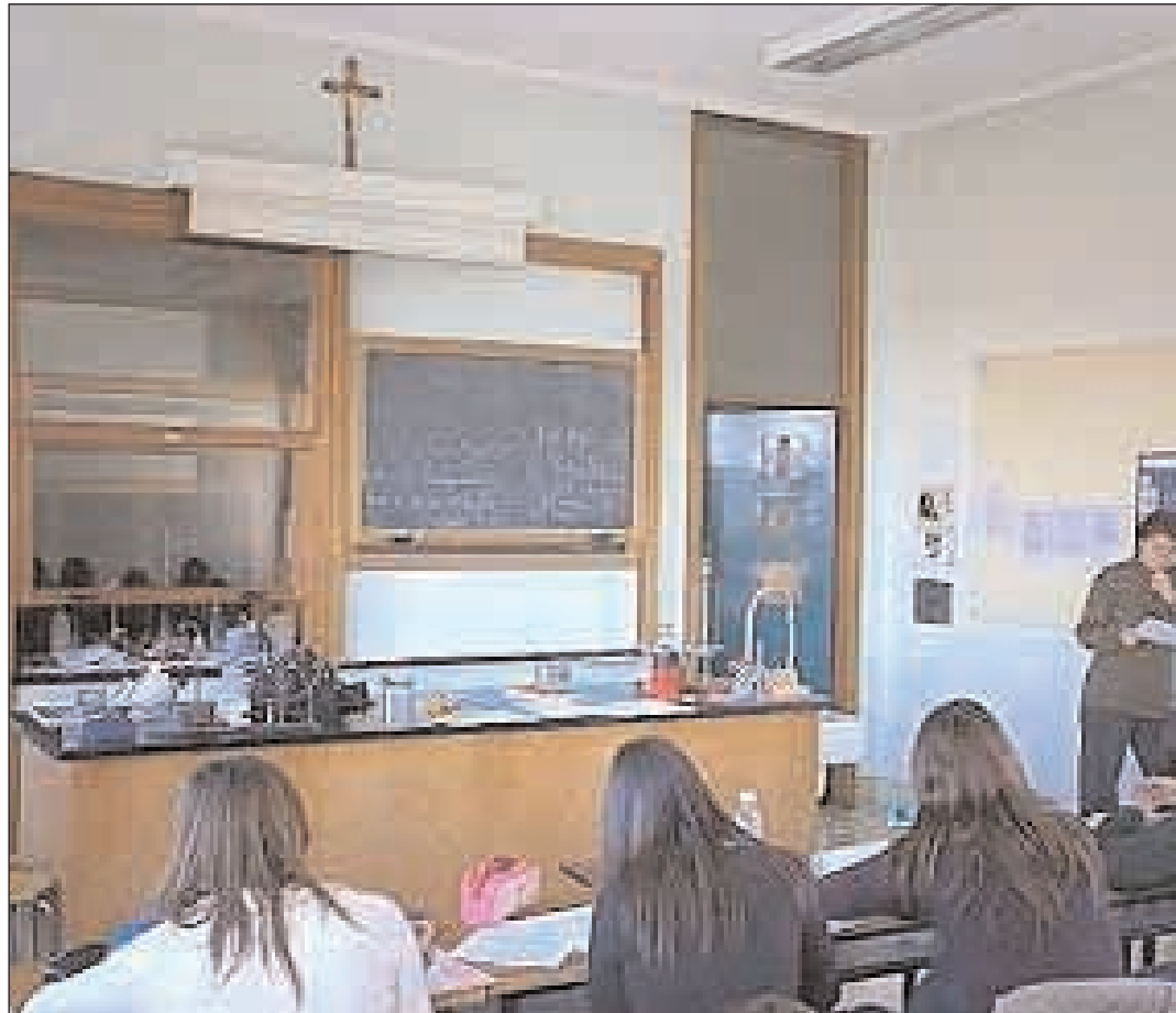
L'insegnamento della religione cattolica in una scuola italiana

1991, come «servizio educativo a favore delle nuove generazioni» e contributo alla crescita globale della persona, offerto a tutti, nella scuola di tutti. All'Accordo di revisione del 1984 ha fatto seguito, il 14 dicembre 1985, l'Intesa tra il Presidente della CEI ed il Ministro della Pubblica Istruzione e nell'anno scolastico 1986-87 l'avvio del nuovo sistema che riconoscendo l'IRC, «disciplina scolastica», ne sancisce la piena curricolarità. L'introduzione del diritto di scelta dell'IRC, e dunque l'aver fatto appello alla responsabilità educativa dei genitori e la possibilità di scelta da parte degli studenti, ha avuto nel corso degli anni un esito fortemente positivo, tanto che ancora oggi si registra una grande adesione all'IRC. Il Concilio Ecumenico Vaticano II ha contribuito a riconsiderare in modo complessivo il rapporto tra la Chiesa e le «realità temporali», riconoscendo ad entrambi i valori loro propri, e la giusta autonomia; grazie a questo cambio di mentalità e di visione delle cose, si è avviato così un processo di rinnovamento dello stesso modo di considera-