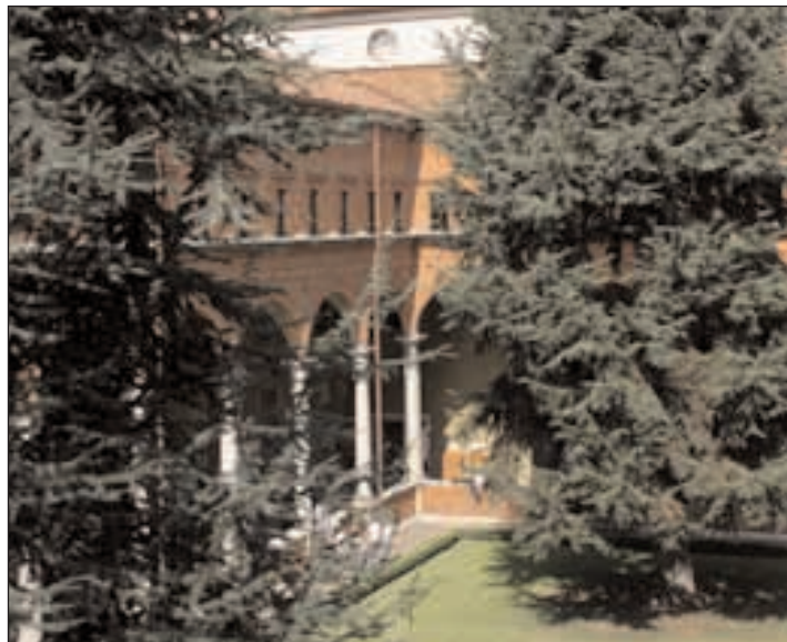
L'università cattolica Sacro Cuore di Milano

integrale dell'individuo, come parte attiva e propositiva della società. Tale obiettivo, sempre più diffusamente percepito come una vera e propria urgenza personale e sociale, esige il rilancio dell'idea stessa di educazione, della sua natura e delle sue finalità. Questa sfida impegnativa chiama in causa non marginalmente l'università, per evitare che la pur doverosa attenzione alle questioni del metodo porti a trascurare il fatto che l'educazione è un atto finalizzato a una precisa concezione della persona. Educare è una necessità, ma anche un impegno e un rischio da assumere con coraggio, perché il desiderio di verità, di bontà e di bellezza che è nel cuore di ciascuno indichi la via ragionevole di una proposta capace di indirizzare «verso l'oltre» l'intelligenza e la libertà di ogni persona. È perciò doveroso accompagnare con rispetto e fermezza le giovani generazioni negli anni delle scelte che coin-