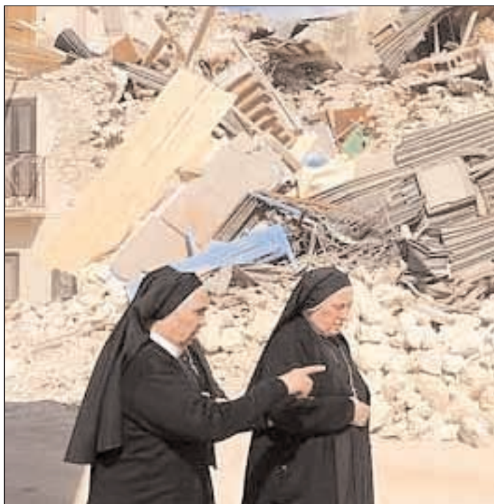
Suore tra le macerie in terra d'Abruzzo