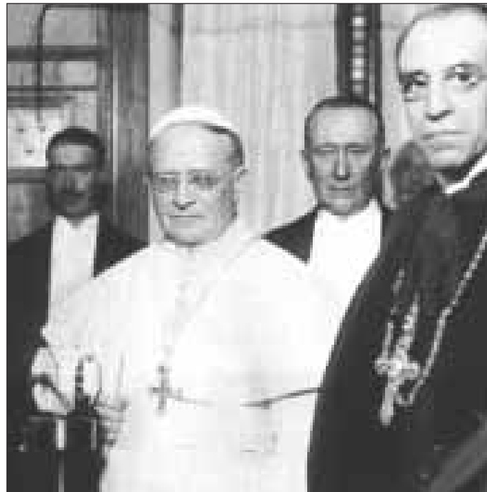
Il papa Pio XI con Guglielmo Marconi e il futuro papa Pio XII