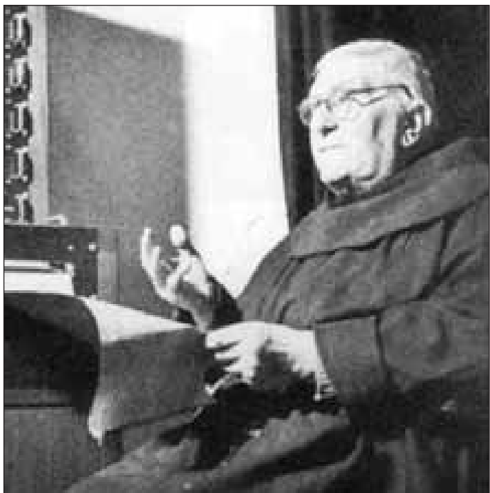
Padre Agostino Gemelli