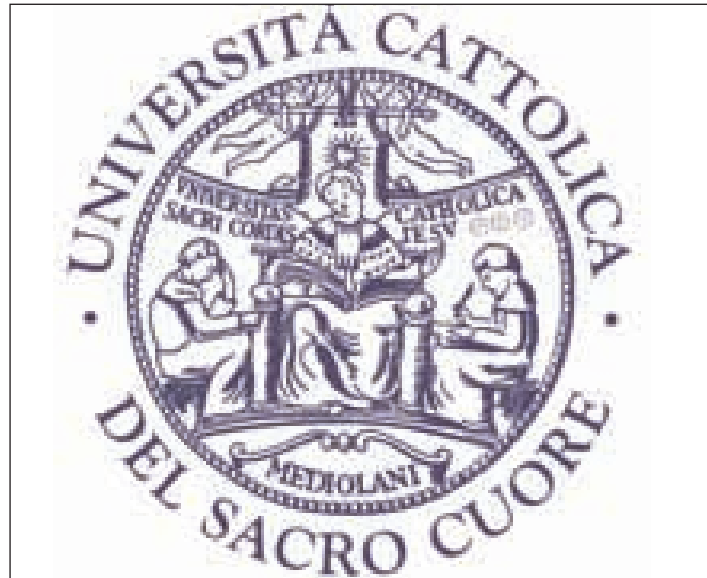
Il logo dell'università cattolica Sacro Cuore di Milano

cidono con il periodo degli studi universitari, promuovendo in loro la capacità di interrogarsi su quali valori costruire il proprio progetto di vita, favorendo nel contempo relazioni educative autentiche, sostenute da docenti accuratamente preparati, ecclesialmente impegnati e capaci di testimonianza. Fulgido in proposito è l'esempio del fondatore dell'Università Cattolica del Sacro Cuore, Padre Agostino Gemelli, di cui si ricorda proprio quest'anno il cinquantenario della scomparsa: brillante scienziato e insigne educatore, si impegnò strenuamente nel realizzare un polo universitario che fosse all'altezza dei migliori atenei italiani e stranieri, perché i giovani disponessero non solo della formazione necessaria per fare fronte ai cambiamenti del Paese, ma anche di una proposta integrale di crescita umana, che non può prescindere dalla dimensione religiosa e può propriamente cristiana. A