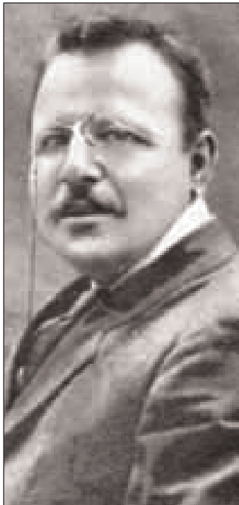
Il ministro Benedetto Croce