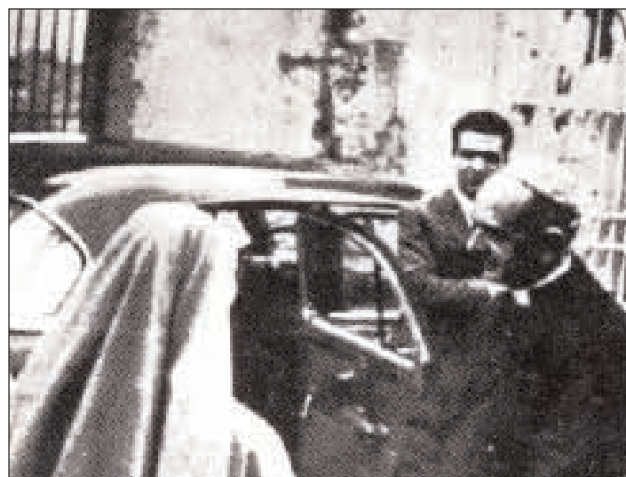
Papa Paolo VI al Santuario della Civita a Itri