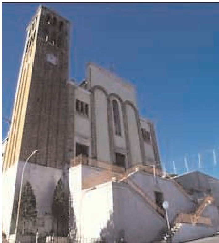
La Chiesa dei Santi Cosma e Damiano nella città omonima