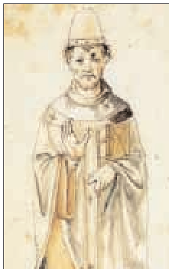
Papa Gelasio II