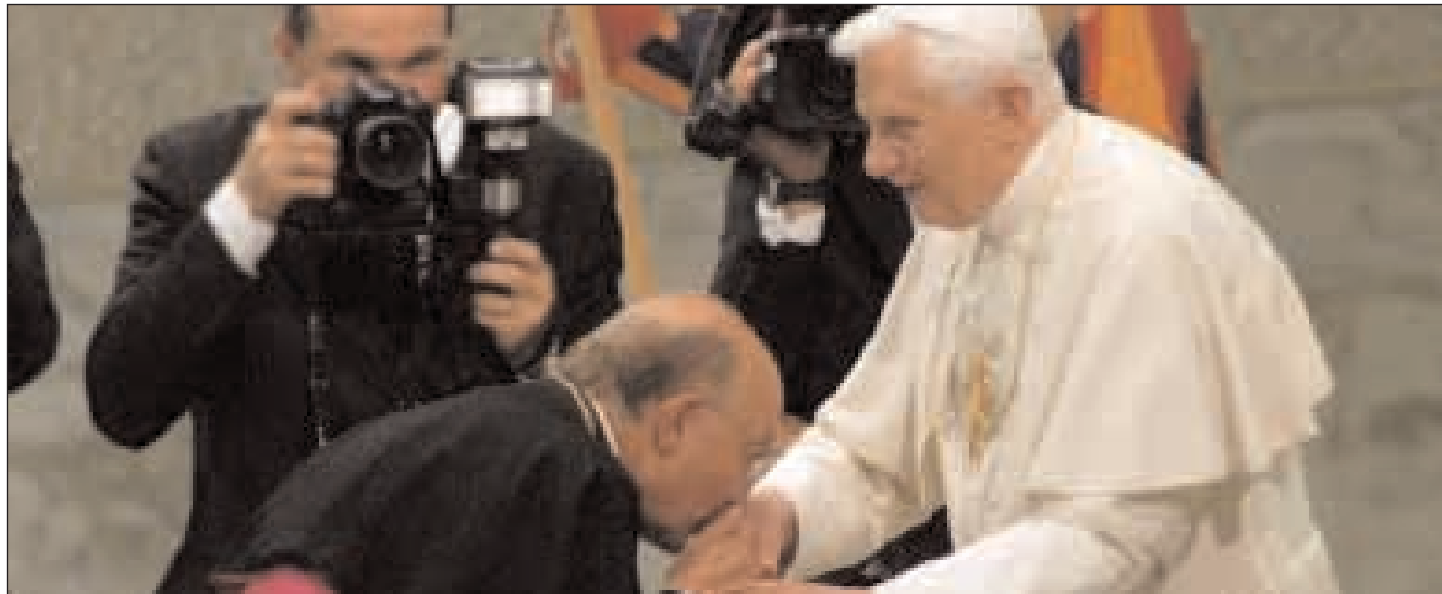
L'Arcivescovo D'Onorio bacia l'anello del Pescatore del Santo Padre in occasione dell'Udienza Generale

città del Golfo è Costantino (25 marzo 708 - 19 aprile 715). A seguito del Concilio "Trullano" (691), i cui canoni non vennero approvati dalla Chiesa di Roma, Papa Costantino, si recò in Oriente per ristabilire la pace con l'imperatore Giustiniano II. Secondo il monaco benedettino, Giovanni Battista Federici (1791), nel 712, facendo ritorno a Roma, dopo aver ottenuto l'ubbidienza dell'imperatore, Costantino fece sosta a Gaeta, di fatto il Pontefice raggiunse Roma il 24 ottobre del 711, pertanto sbarcò nel porto di Gaeta nel medesimo anno. Negli Annali Romani (848 - 849) il Cardinale Bibliotecario Anastasio, parla di una venuta in Gaeta del Papa San Leone IV (10 aprile 847 - 17 luglio 855). Il Pontefice sarebbe giunto a Gaeta nell'848, per sostenere i Gaetani, i Napoletani e gli Amalfitani contro i Saraceni che stavano invadendo tutto il territorio del Golfo. L'azione del Papa era anche finalizzata alla realizzazione di una lega non solo a difesa di Roma, ma per maggiormente garantire gli stessi traffici commerciali spesso danneggiati dai pirati arabi. La venuta del Pontefice