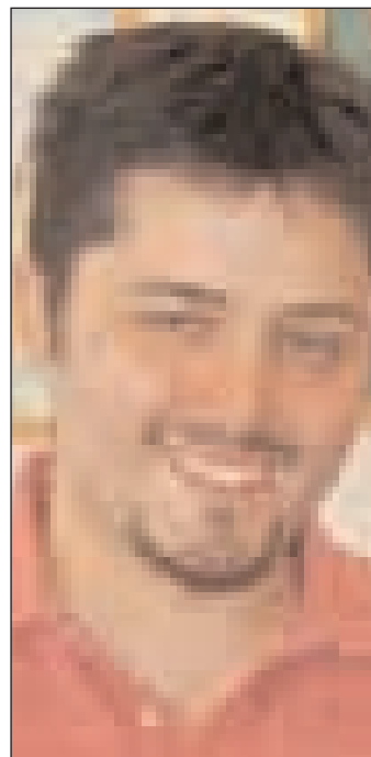
Il vicepresidente giovani Iasevoli

Iasevoli. Il vicepresidente lancia degli spunti di riflessione importanti: «Quanti educatori sono stati bruciati perché non sentiti come parte della comunità? Cosa attira gli adolescenti in parrocchia? Le nostre comunità sono il regno dell'accoglienza e della gioia? Una