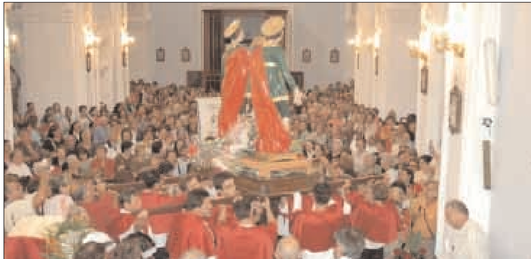
Il rientro delle icone dei Santi Medici Cosma e Damiano nella Chiesa omonima di Gaeta