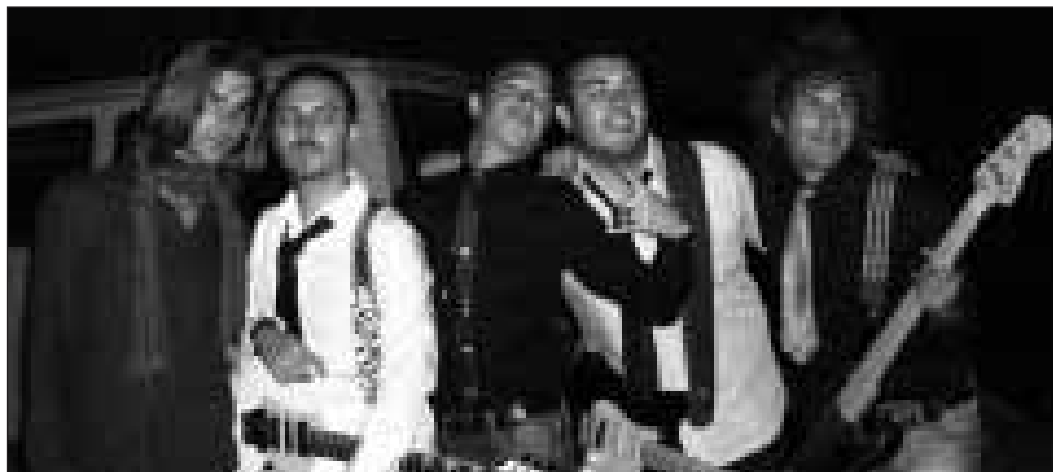
I learn to Fly

Come avevamo già scritto qualche settimana fa l'Azione Cattolica della parrocchia San Giuseppe Lavoratore di Monte San Biagio ha organizzato per il 19 settembre un festival musicale dal titolo "Hope Music Festival" che potesse dare spazio soprattutto ai giovani e alla musica. Si sono aggiudicati sia il premio della critica, sia della giuria popolare sia della scuola di musica di Fondi il giovane gruppo musicale di Gaeta "Learn to fly" che stravincono il festival. Ecco qualche commento sull'esperienza degli stessi vincitori: «Ci siamo trovati sul palco e la competizione è sparita. Ognuno guardava negli occhi dell'altro, cercando sostegno, coraggio, sicurezza. I volti tesi, gli strumenti al fianco, pronti a vestirci solo delle nostre parole e delle nostre note. In un attimo sono ritornate dalla memoria le immagini di tutte le prove, di ogni momento che ci aveva portato fin lì; e, più indietro, alla stesura della canzone, pezzo dopo