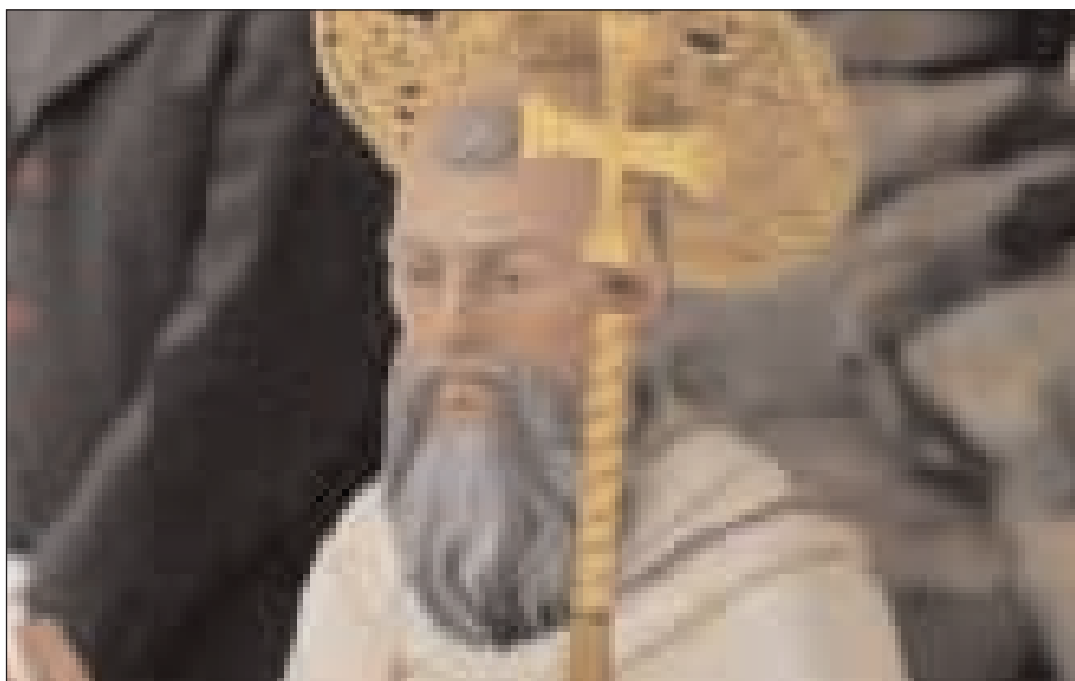
La statua lignea di San Nilo benedetta dal Santo Padre

perseverante epiklesis (invocazione) della piena unità fra Oriente ed Occidente". Da un Santo vissuto a Gaeta quindi, come il papa gaetano Gelasio II martire della chiesa che difese il primato del papato sulla politica, viene l'esempio di come essere uniti per il bene del popolo e della Chiesa. Nella giornata dedicata ai politici nell'ambito delle manifestazioni per San Nilo di domenica 20 settembre l'auspicio di un nuovo miracolo di ritrovata unità sociale e politica per il bene della Città.