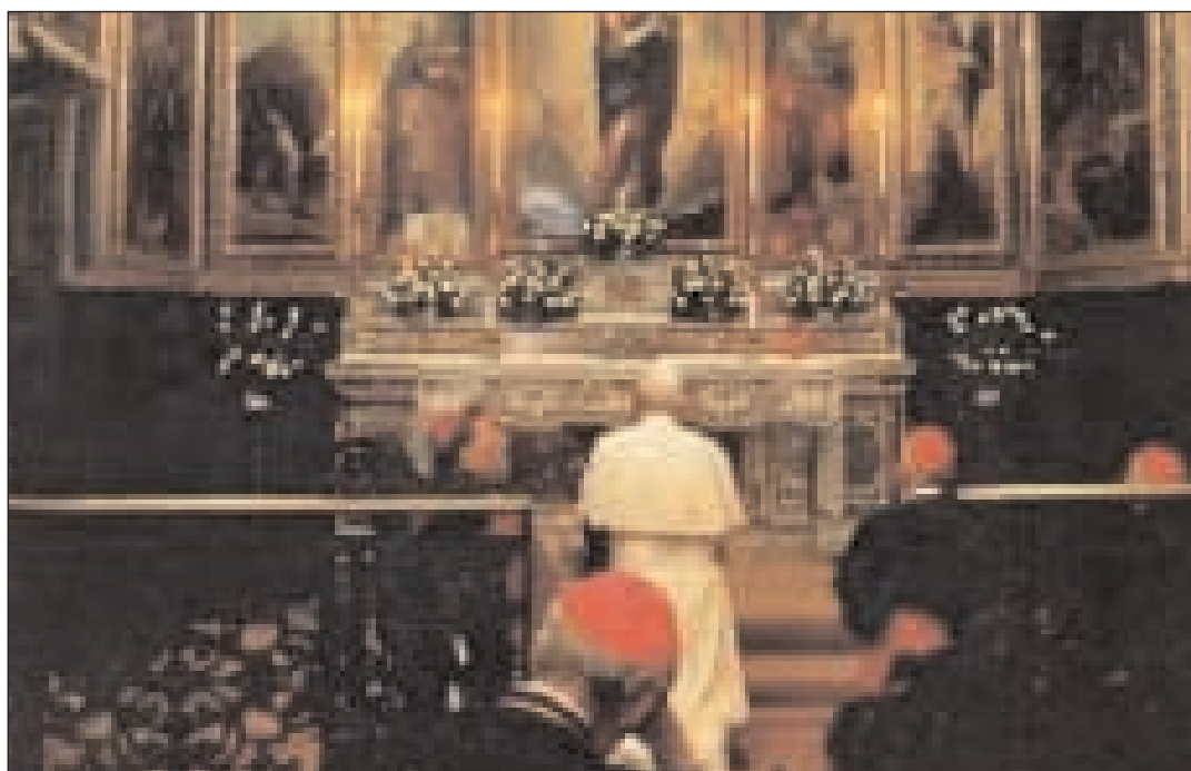
Giovanni Paolo II prega nella Cappella d'Oro a Gaeta nel 1989

restò 8 giorni. Papa Benedetto XIII (29 maggio 1724 - 21 febbraio 1730) nel corso di un viaggio, il 3 maggio 1727 sostò nell'attuale chiesa di S. Erasmo di Formia, allora Castellone di Gaeta; nel corso di un altro viaggio del marzo 1728 il Pontefice entrò nella fortezza di Gaeta per una breve visita. Relativamente alla presenza del Papa Pio IX (16 giugno 1846 - 7 febbraio 1878) in Gaeta dal 25 novembre 1848 al 4 settembre 1849, diciamo soltanto che all'epoca Gaeta si ritrovò improvvisamente al centro delle attenzioni nazionali e internazionali, vivendo un'intensa vita politica con la corte pontificia presente in città insieme al re di Napoli e ad altri sovrani del tempo. È superfluo in questa sede ricordare l'Enciclica, nonché i numerosi privilegi e doni verso la città e