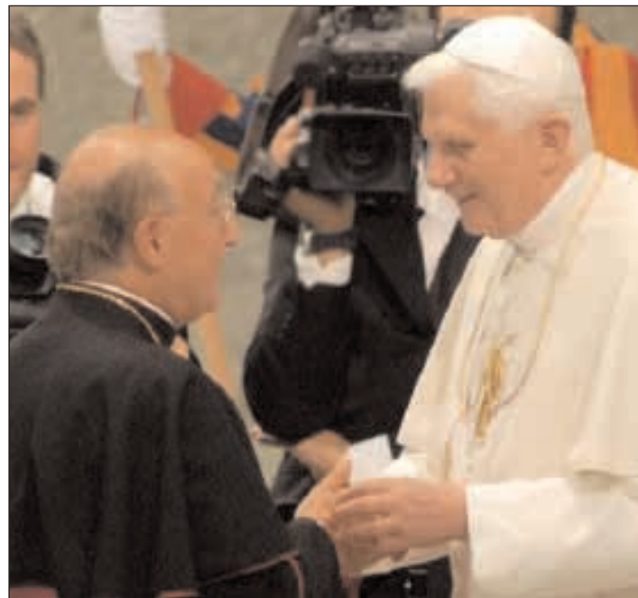
Mons. D'Onorio invita Benedetto XVI a Gaeta seguendo le orme dei suoi predecessori

consacrerà la cattedrale (22 gennaio 1106) dedicandola all'Assunta. Ma Gaeta è la patria di un papa, Giovanni Coniulo, monaco di Monte Cassino, autore di una Passio della vita di S. Erasmo (1078-1088), Papa col nome di Gelasio II dal 24 gennaio 1118 al 28 gennaio 1119. Per la lotta delle Investiture, Enrico V perseguirà il novello Pontefice e i Cardinali, pertanto il Papa fu costretto a fuggire a Gaeta dove giunse il 7 marzo 1118. Gelasio, a Gaeta venne ordinato sacerdote e il 10 marzo 1118 fu incoronato proprio nel nostro duomo. Tornato a Roma il 21 luglio, dai Frangipane fu costretto a fuggire di nuovo, spingendosi verso la Francia dove, nell'Abbazia di Cluny, morì e fu sepolto il 29 gennaio 1119. (Continua a pagina 405)