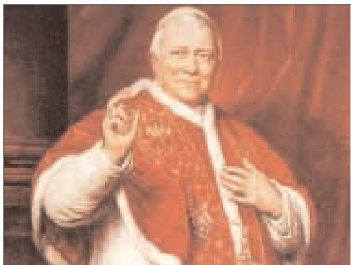
Nel ritratto Papa Pio IX