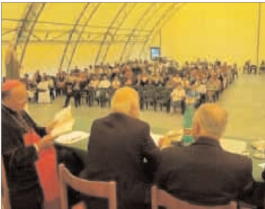
Una particolare prospettiva del tavolo dei relatori e dei convegnisti

cammino in corso sinodale. Sarà data alle stampe una pubblicazione suddivisa in tre parti: la relazione del nostro Arcivescovo tenuta a Lenola in occasione dell'ultimo ritiro del clero, quello del teologo biblista e parroco della Chiesa dei Santi Apostoli in Alessandria don Silvano Sirboni e, infine quella dell'Arcivescovo Emerito di Siena Mons. Gaetano Bonicelli, fine e dotto conferenziere. Quest'ultimo è - nonostante l'età - un oratore che si ascolta sempre con grande piacere e che è conteso in tutta Italia come conferenziere. Era due giorni prima a Bergamo, si è recato a Bari e quindi a Gaeta per poi recarsi il giorno dopo a Novara. Sia lui che don Silboni sono venuti - hanno affermato - soltanto per la stima che nutrono verso il nostro Arcivescovo, al quale non potevano dire di "no". Lasceranno nei nostri cuori e nelle nostre menti un patrimonio di riflessioni su come vivere - anche alla luce delle Sacre Scritture - la Parola di Dio e la Celebrazione Eucaristica. Un consiglio: prenotare e leggere la prossima pubblicazione dell'Arcidiocesi sul tema. Da evidenziare che quest'anno è stata scelta come sede dei lavori la confortevole Tenda dell'Incontro, anziché la sala convegni del Coni, sempre di Formia, e la partecipazione è stata totalmente gratuita e aperta a tutti coloro che desideravano partecipare ai lavori stessi.