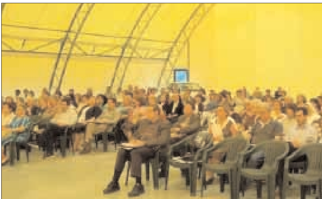
Un particolare della platea che segue gli interventi dei relatori del Convegno diocesano

dobbiamo ritornare sulle strade non più tristi e dimissionari, ma con il cuore ardente degli stessi sentimenti di Cristo per impegnarci con lui e come lui perché si diffonda fra gli uomini il regno di Dio che è regno di giustizia, di verità, di amore e di pace. In breve, per rendere questo mondo più giusto e più umano perché è da questo impegno che saremo giudicati degni di essere annoverati fra i giusti nel giorno del giudizio finale (cf Mt 25, 31 - 46). Chiamati e inviati per essere luce e sale, per dare gioia e gusto alla vita. «La parola di Dio contenuta nelle sacre Scritture e nella Tradizione viva della Chiesa, aiuta la mente e il cuore degli uomini a comprendere e amare tutte le realtà umane e il creato. Aiuta infatti a riconoscere i segni di Dio in tutte le fatiche dell'uomo, tese a rendere il mondo più giusto e più abitabile; sostiene l'identificazione dei "segni dei tempi" presenti nella storia; spinge i credenti a impegnarsi per quanti soffrono e sono vittime delle ingiustizie. La lotta per la giustizia e la trasformazione (del mondo) è costitutiva dell'evangelizzazione» (Prop - 39). Non è forse questo lo scopo del Sinodo? Dalle parole bisogna passare ai fatti. Questo diventa difficile senza la luce e la forza dello Spirito Santo.