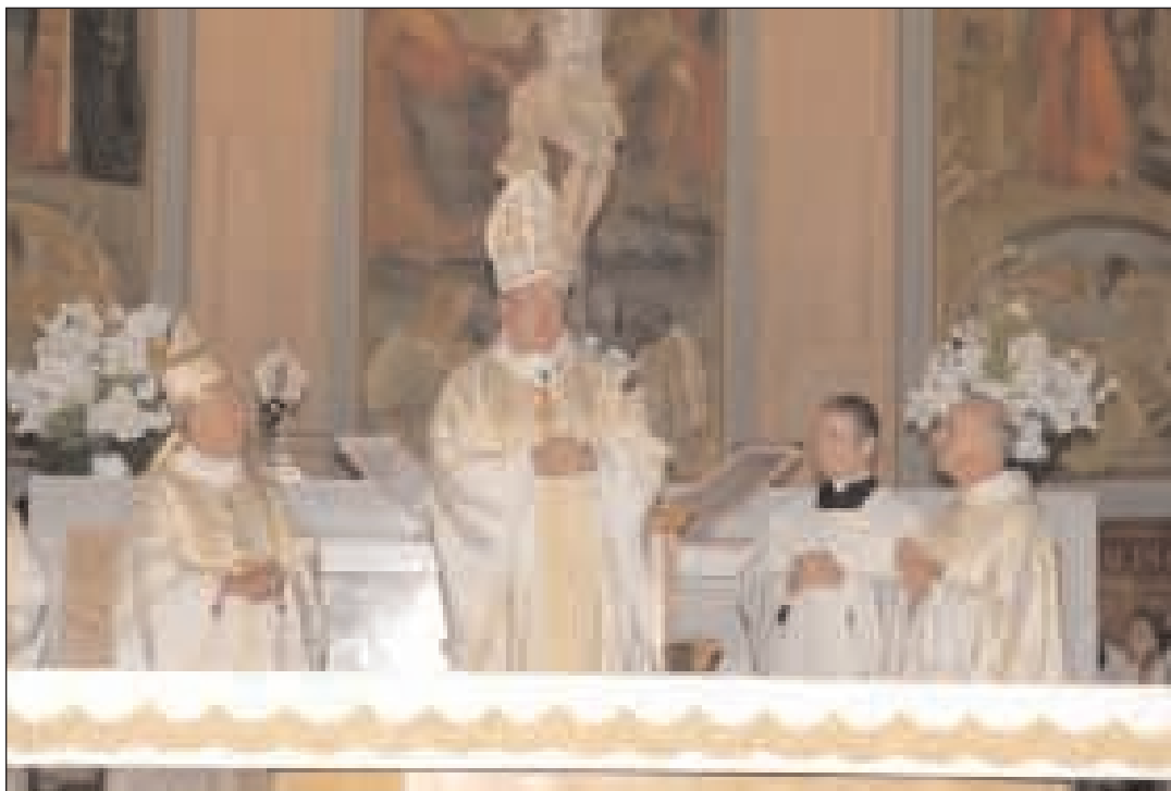
Il Cardinale Raffaele Martino nel corso della celebrazione eucaristica in onore di San Giovanni Battista affiancato dall'Arcivescovo

tento" e grandi festeggiamenti sono stati organizzati per il 23, 24 e 25 giugno. Addirittura la Chiesa, nonostante i lavori di restaurazione e manutenzione in atto, è stata riaperta per l'occasione. Momenti di adorazione e preghiera sono stati alternati a spettacoli musicali e bandistici. Si è svolta la consueta processione e giro per mare nonché la celebrazione con Cardinale Mons. Renato Raffaele Martino, presidente del pontificio consiglio della giustizia e della pace. Passando alla parte "profana" come ogni anno prima delle due ricorrenze scatta il toto cantante e toto spettacolo pirotecnico. Quest'anno il primo giugno ha fatto tappa a Formia Gianluca Grignani e il 23 Alexia. I fuochi d'artificio sono stati curati per la prima ricorrenza dalla premiata ditta cav. Liccardo e fratelli e per la seconda da Pirotecnica Morsani con uno spettacolo piromusicale emozionante. Non ci resta che concludere con la frase riportata sul sito della parrocchia di Sant'Erasmus che rende bene l'idea di cosa vuol dire adorare un patrono, uno o l'altro che sia: «L'annuale Festa del Santo non è solo circostanza propizia per manifestare gioia e incontro fraterno, ma occasione sempre favorevole per annunciare i valori cristiani a cui ispirare la nostra condotta e il nostro stile di vita».