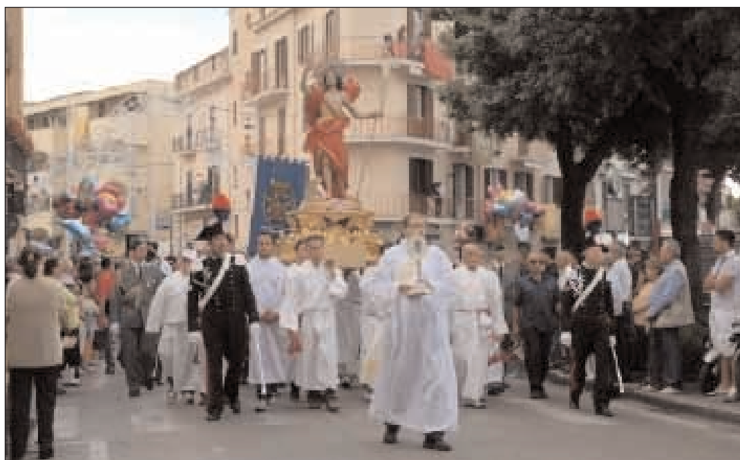
La statua del Santo patrono è preceduta dal Reliquiario