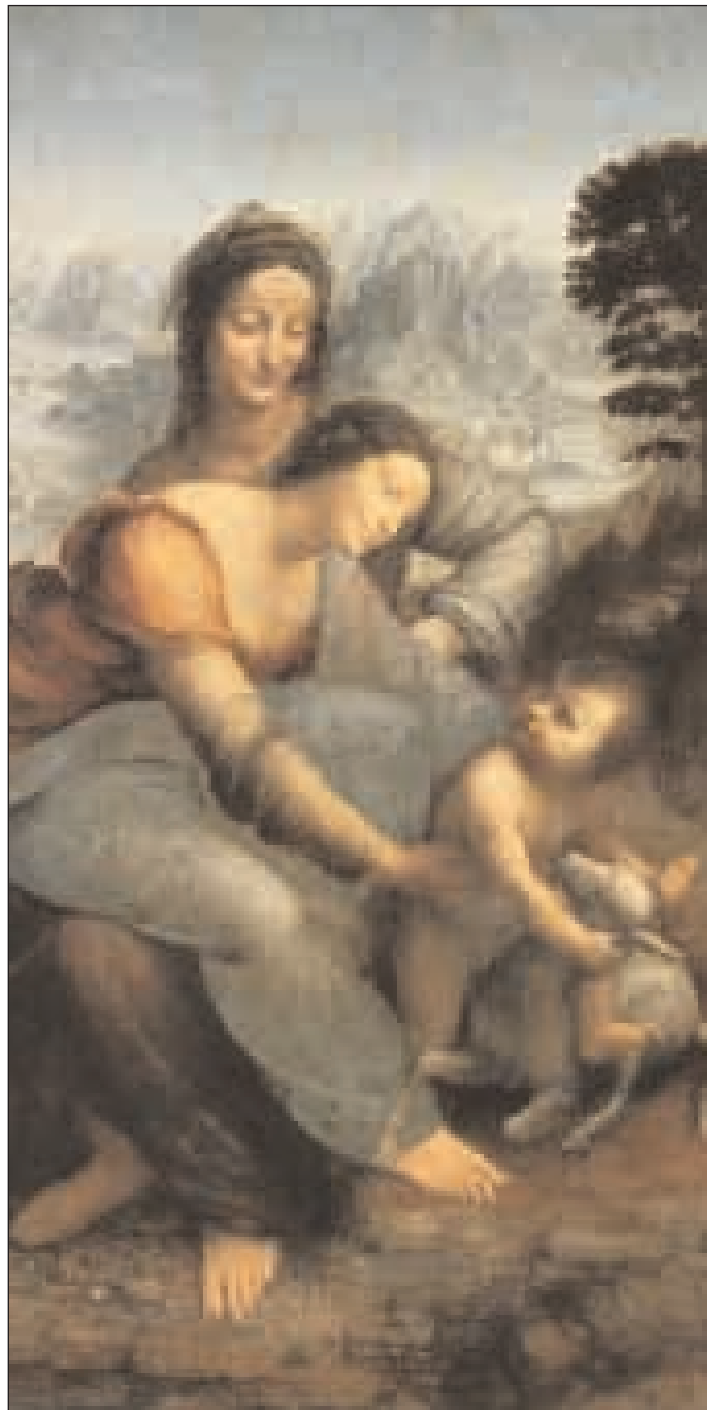
Sant'Anna, la Madonna, il Bambino

Un dipinto a olio di Leonardo da Vinci conservato al Museo Louvre di Parigi e abitava vicino Gerusalemme, nei pressi della fonte Piscina Probatica; un giorno mentre stava portando le sue abbondanti offerte al Tempio come faceva ogni anno, il gran sacerdote Ruben lo fermò dicendogli: «Tu non hai il diritto di farlo per primo, perché non hai generato prole». Gioacchino ed Anna erano sposi che si amavano veramente, ma non avevano figli e ormai data l'età non ne avrebbero più avuti; secondo la mentalità ebraica del tempo, il gran sacerdote scorgeva la maledizione divina su di loro, perciò erano sterili. L'anziano ricco pastore, per l'amore che portava alla sua sposa, non voleva trovarsi un'altra donna per avere un figlio; pertanto addolorato dalle parole del gran sacerdote si recò nell'archivio delle dodici tribù di Israele per verificare se quel che diceva Ruben fosse vero e una volta constatato che tutti gli uomini pii ed osservanti avevano avuto figli, sconvolto non ebbe il coraggio di tornare a casa e si ritirò in una sua terra di montagna e per quaranta giorni e quaranta notti supplicò l'aiuto di Dio fra lacrime, preghiere e digiuni. Anche Anna soffriva per questa sterilità, a ciò si aggiunse la sofferenza per questa 'fuga' del marito; quindi si mise in intensa preghiera chiedendo a