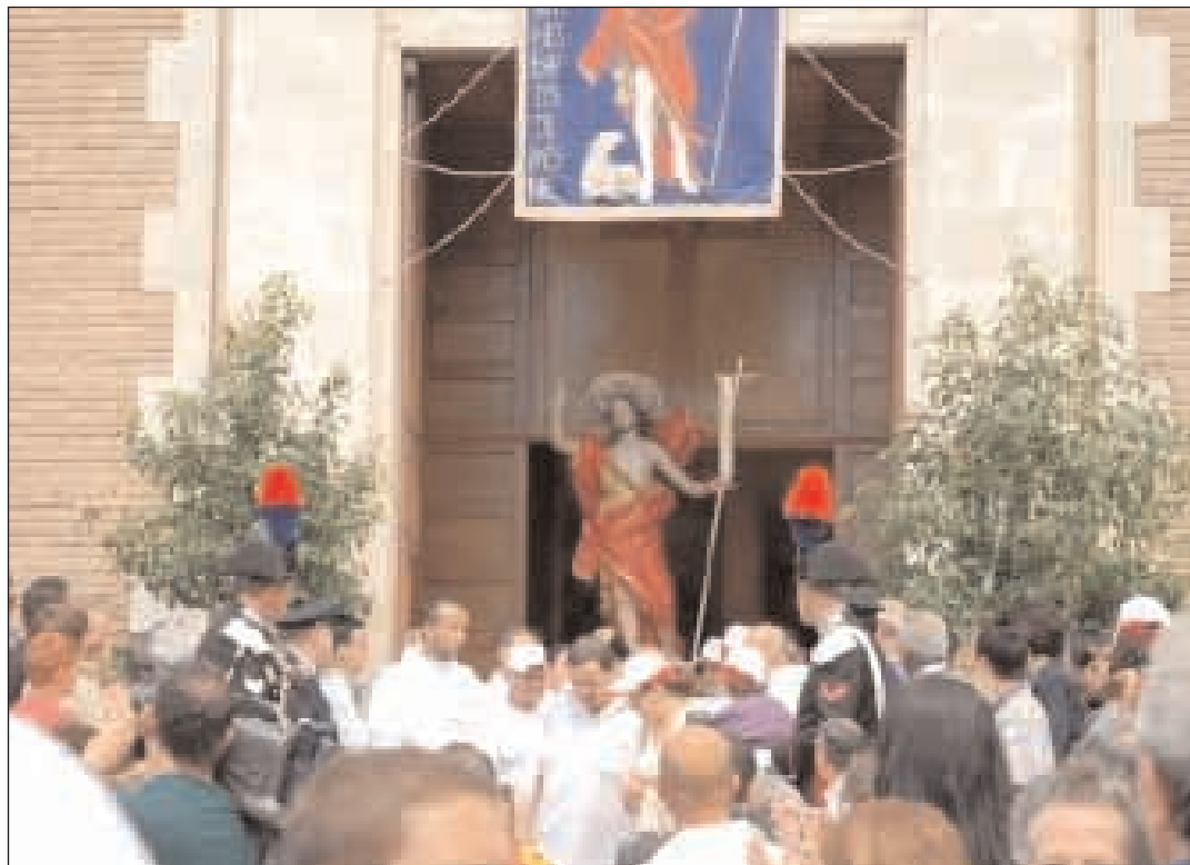
La statua lignea di San Giovanni Battista esce dalla Chiesa omonima per la processione nelle vie cittadine

D al Basso Medioevo, parte della provincia di Terra di Lavoro in Campania, in epoca classica parte del Latium, la città di Formia nasce dopo l'unità d'Italia sui resti della romana Formiae dall'unione di tre comuni: Castellone, Maranola e Mola. Quelli che oggi sono i due rioni della città erano anticamente due paesi separati. Uno legato alla pesca e all'attività per mare, l'altro alla terra e all'agricoltura. Due mondi a confronto che oggi si trovano uniti in una città di 40.000 abitanti. Potrebbe considerarsi un riflesso di questa antica situazione la presenza nella città di un doppio patrono e la sana competizione tra i due comitati cittadini che organizzano i festeggiamenti in occasione della ricorrenza. Il 2 giugno è la volta di Sant'Erasmus legato al rione di Castellone e il 24 giugno San Giovanni Battista per il quartiere di Mola. Ovviamente i due patroni vegliano sull'intera città ma il costume e la tradizione dà ragione a questa ipotetica e ideale partizione, la torre da una parte il castello dall'altra. Due santi collegati a due diversi stili di vita. San Giovanni ormai è diventato un protettore dei pescatori, dopo la consueta processione per le vie della città viene portato in barca e la sua corona gettata in mare come simbolo di benedizione