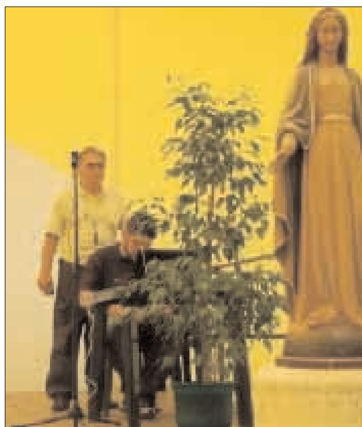
La postazione di Radio Civita alla Tenda dell'Incontro con gli operatori intenti a trasmettere in diretta il convegno sull'emittente diocesana