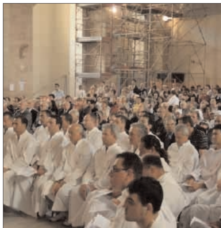
Un particolare che attesta la grande partecipazione del clero e dei fedeli alla funzione