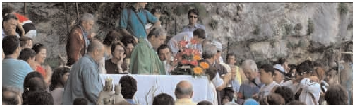
La celebrazione eucaristica al Monte Altino nei pressi della Chiesa di San Michele Arcangelo