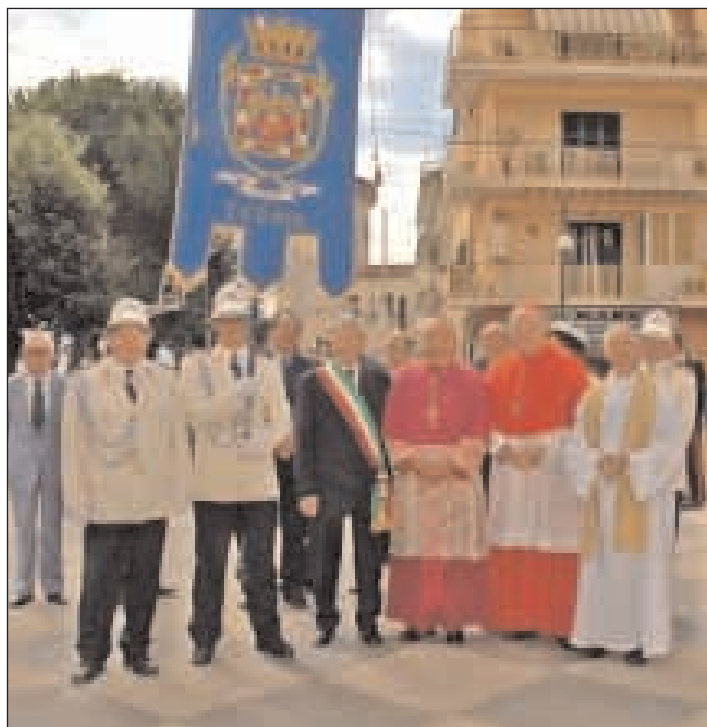
Foto istituzionale in una pausa della processione