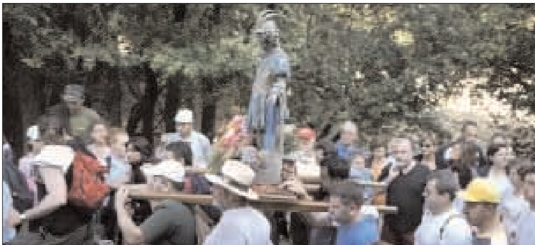
Immagini della processione