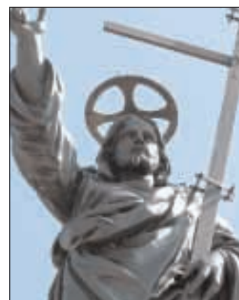
La statua del Redentore