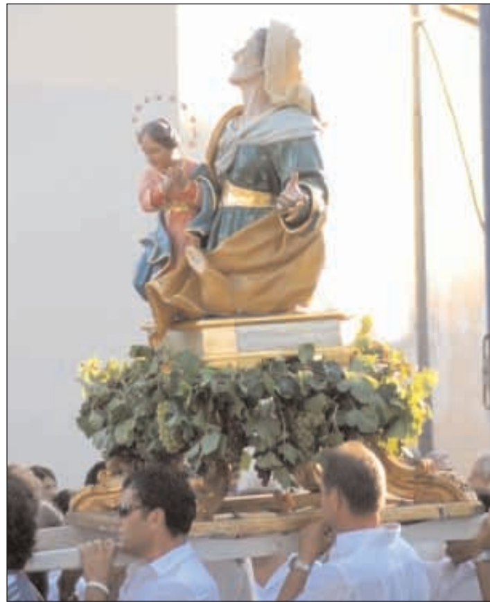
Foto d'archivio della processione di Sant'Anna a Gaeta