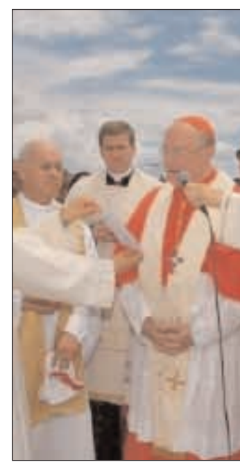
La benedizione a mare