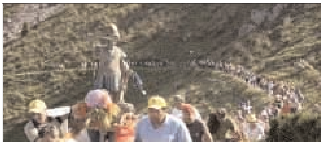
La processione sale di quota