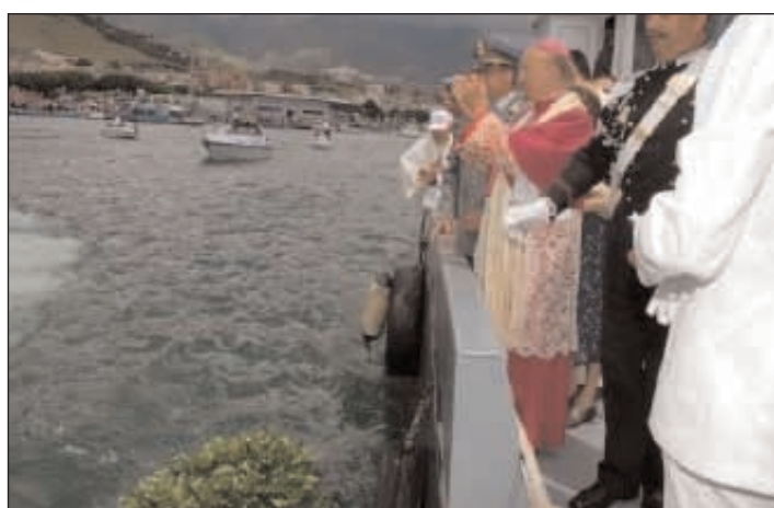
La corona d'alloro in onore ai caduti a mare benedetta dall'Arcivescovo