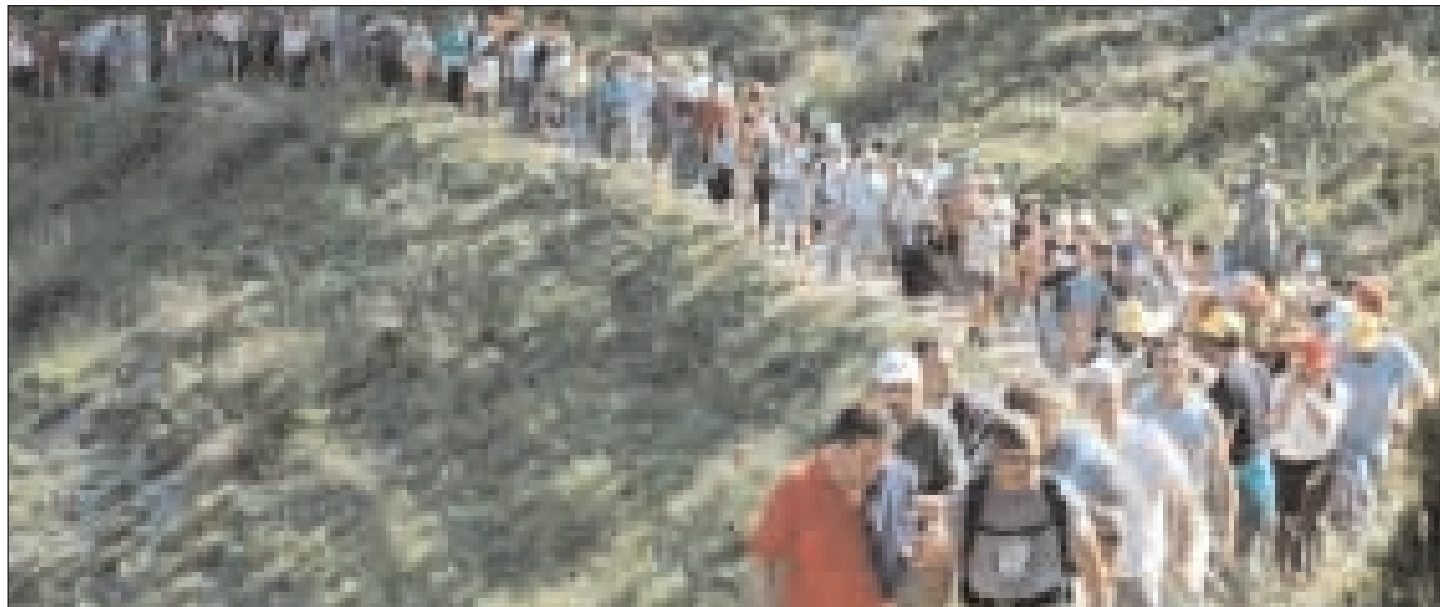
La lunga fila di fedeli alla processione di San Michele

N ell'archivio dell'Abbazia di Montecassino esiste un documento del X secolo, copia di un atto dell'anno 830 (o 831), in cui si trova, per la prima volta, l'oratorio e la Chiesa di Sant'Angelo sul Monte Altino. Nello stesso documento, raccolto nel Codex gaetano, risulta che la costruzione dell'edificio è opera del vescovo di Gaeta. La presenza di un luogo di culto sul Monte Altino è, quindi, originariamente diocesana, ma si annovera come monastero o eremo, senza specificarne però l'osservanza, in un documento del 978. In ogni caso viene indicato tra i possedimenti del vescovo di Gaeta nei privilegi di Adriano IV (1159) e Alessandro