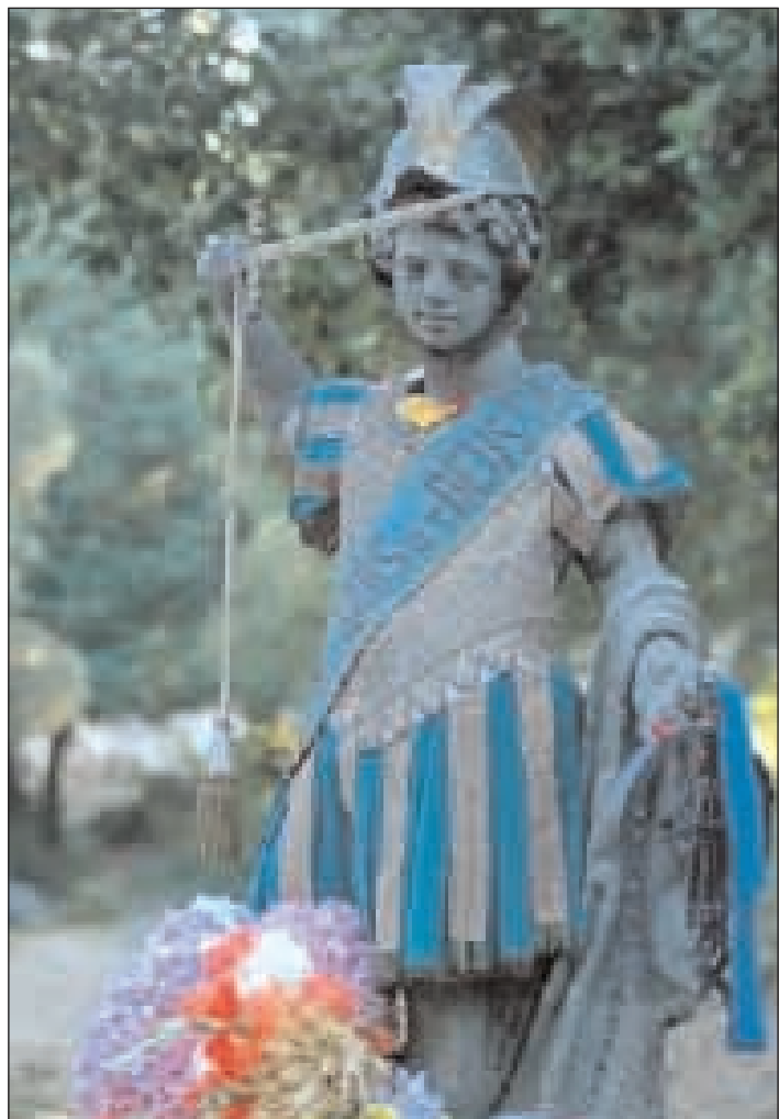
L'icona di San Michele Arcangelo in tutto il suo splendore