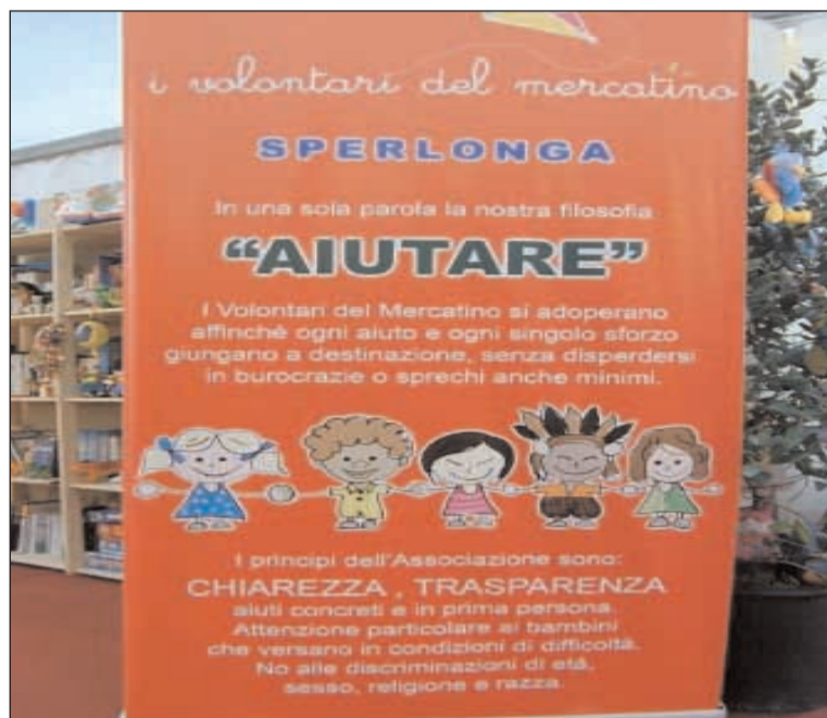
Una delle locandine che pubblicizza l'iniziativa