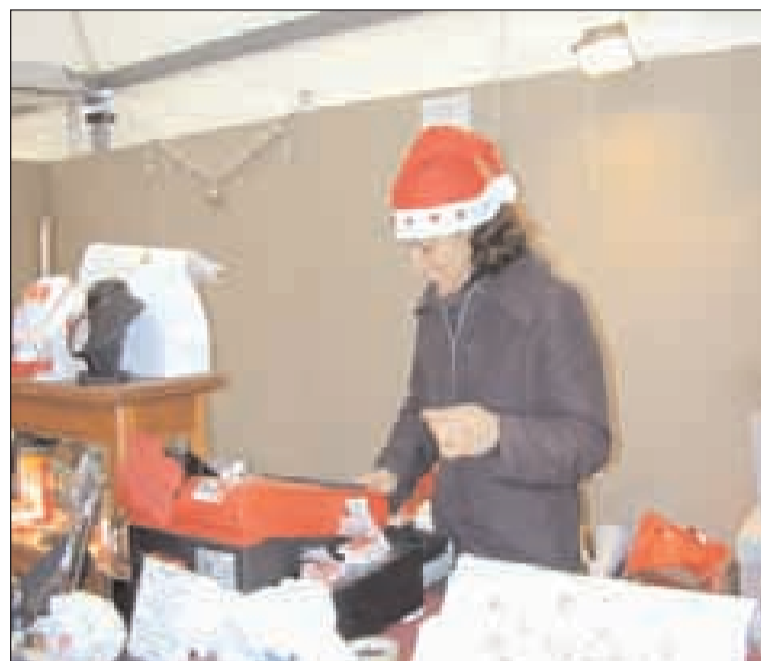
L'autrice del servizio mentre opera ai banchi del mercatino