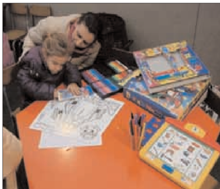
Uno dei punti di intrattenimento dei bambini