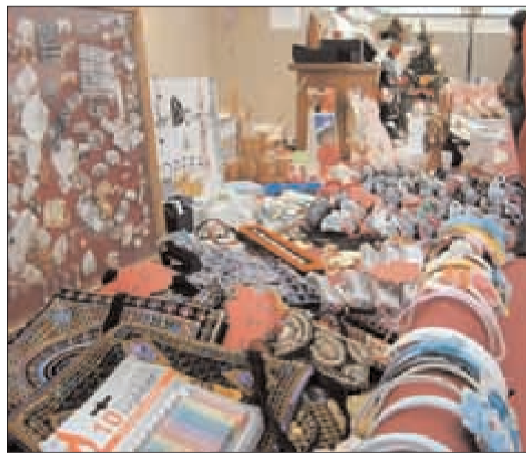
Una delle bancarelle che proponevano oggetti di vario genere