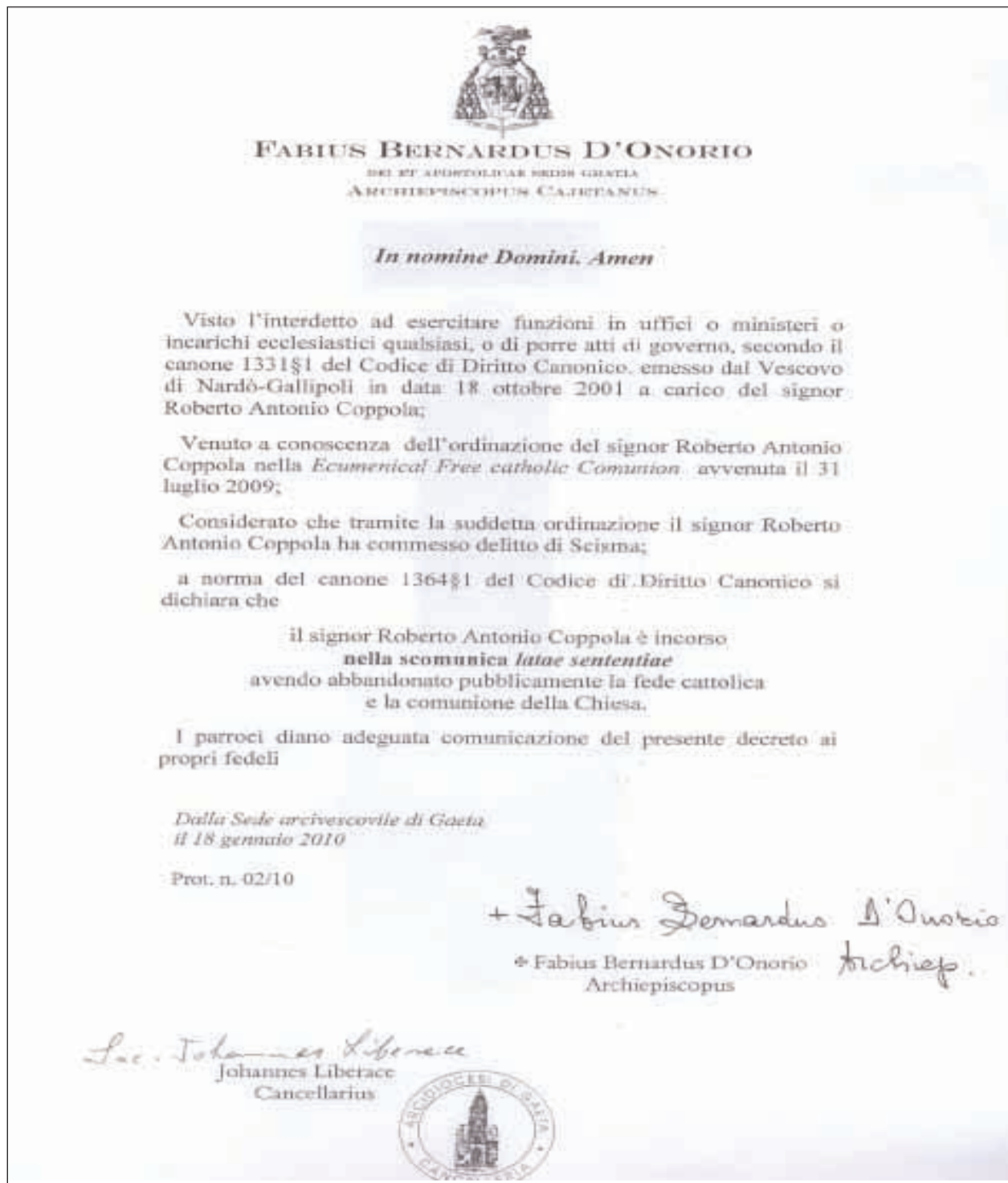
Il Decreto di scomunica fatto affiggere all'ingresso delle Chiese della Forania di Minturno