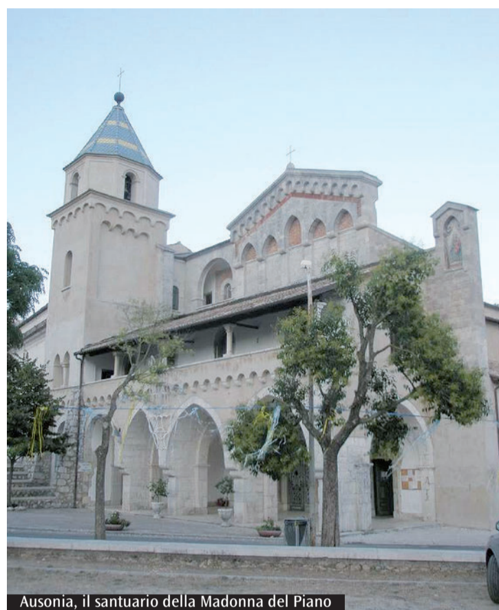
Ausonia, il santuario della Madonna del Piano