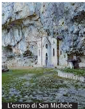
L'eremo di San Michele

Una centenaria tradizione vuole che ogni anno, la domenica seguente i solenni festeggiamenti in onore di Sant'Antonio (13 giugno), si parta in solenne pellegrinaggio verso l'eremo dell'Arcangelo sul monte Altino, a seguito del simulacro del santo che ritorna verso il luogo silenzioso del suo riposo. Anche quest'anno il 16 giugno si compie nuovamente l'antico rito. Il popolo maranolese e molti fedeli delle zone