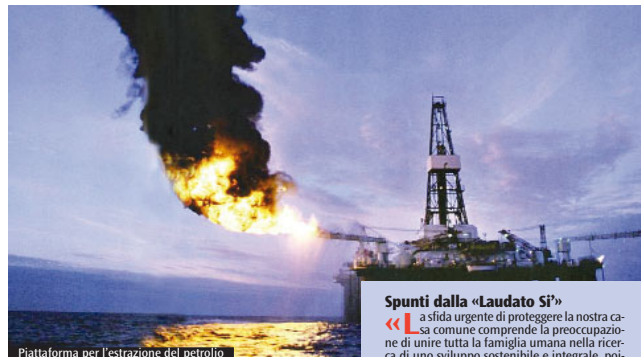
Piattaforma per l'estrazione del petrolio