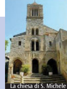
La chiesa di S. Michele

Sarà celebrata da mercoledì 6 a domenica 10 aprile a Itri la festa del compatrono san Francesco di Paola. Per la grande devozione la famiglia De Fabritiis, nel 1800, fece erigere in suo onore una cappella nella chiesa di San Michele Arcangelo, con pavimento maiolicato. La devozione verso il santo era particolarmente diffusa nei territori del Regno di Napoli. Nato nel 1416 e morto a Tours nel 1507, eremita e fondatore dell'Ordine dei Minimi, fu proclamato santo da papa Leone X nel 1519. I suoi attributi sono il mantello e il bastone con il motto «Charitas». Patrono della Calabria e della Sicilia, dei naviganti e pescatori, è invocato contro gli incendi, la sterilità e le epidemie. La liturgia lo festeggia il 2 aprile. I Minimi hanno un quarto voto «quaresimale», con norme rigorose sul cibo, e sono dediti al ministero della predicazione e della confessione. Gli appuntamenti prevedono un triduo di preparazione dal 6 all'8 aprile alle 17.30 nella chiesa di San Michele Arcangelo. Sabato 9, alle 15.30, in piazza Annunziata si terranno le «Olimpiadi del risparmio quaresimale», festa con i ragazzi e le loro famiglie a conclusione dell'impegno quaresimale della raccolta tappi per i pozzi in Tanzania. Domenica 10 alle 18 la processione con la statua del Santo partirà dall'Annunziata e arriverà a San Michele, ove seguirà la Messa. Come da tradizione, sabato e domenica la Caritas interparrocchiale proporrà una vendita di dolciumi il cui ricavato andrà per le opere caritative. (M.D.R.)