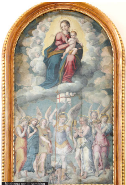
Madonna con il bambino