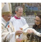
Papa Francesco battezza i figli del sisma

D opo quelli amministrati domenica scorsa nella Cappella Sistina, nuova celebrazione di battesimi, ieri pomeriggio, per papa Francesco, che a Santa Marta ha versato l'acqua battesimale su una dozzina di "figli del terremoto". Era nata dalla richiesta formulata al Pontefice da una mamma amatrice l'idea che fosse lui a battezzare i nati dopo il sisma. Grande emozione per le famiglie dei piccoli, quasi tutti della diocesi reatina. «Un gesto di attenzione del Papa», ha spiegato il vescovo Pompili: «i bimbi venuti al mondo in questi mesi sono l'incarnazione della speranza che la vita riprende e che c'è un futuro da ricostruire insieme, a partire proprio dai piccoli a cui bisogna dare una prospettiva».