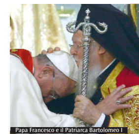
Papa Francesco e il Patriarca Bartolomeo I

appartamento messo a disposizione dalla Diocesi, provando ad avviare un percorso di inserimento. La Diocesi di Frosinone - Veroli - Ferentino ospita attualmente 225 migranti, di cui: 149 persone accolte in convenzione con la prefettura di Frosinone; 54 persone accolte in Sprar del comune di Ferentino; 22 persone accolte in Sprar del comune di Frosinone. Nel dettaglio, si tratta di: 6 minori accompagnati da 1 genitore, 18 donne e 201 uomini. Si tratta di una "accoglienza diffusa" ovvero piccoli gruppi di migranti ospitati in più comuni del nostro territorio, per favorire l'integrazione con la comunità locale e garantire ai migranti una dimensione "domestica". Ci sono in provincia 19 centri di accoglienza, dislocati su 12 comuni, di cui 10 nella diocesi di Frosinone. In Diocesi è stato anche attivato il progetto "Rifugiato a casa mia" che vede coinvolte alcune famiglie e comunità parrocchiali. Una visione parziale di una realtà complessa e delicata, quella dell'accoglienza, di fronte alla quale le Diocesi non si tirano indietro, per offrire una "casa" e una dimensione il più possibile familiare a chi spera in un futuro migliore.