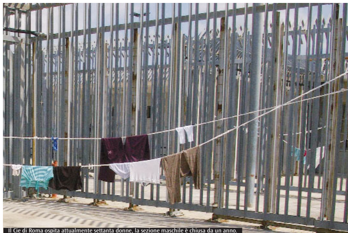
Il Cie di Roma ospita attualmente settanta donne, la sezione maschile è chiusa da un anno.

Semplice. I Cie vanno chiusi perché non svolgono la funzione per cui sono stati creati. Anche nel caso di persone che hanno commesso reati gravi basterebbe mettere in atto l'iter di espulsione durante la detenzione così da evitare che chi ha scontato la pena venga portato nei Cie. Sono dunque strutture «peccaminose», dove, nonostante la buona volontà delle forze dell'ordine e degli operatori, le persone di fatto sono ingiustamente carcerate e violate nella loro dignità oltre che rappresentare uno sperpero di denaro dei cittadini. La speranza era che si arrivasse a una riflessione seria sui risultati ottenuti da questi centri, purtroppo la rivolta dei migranti a Cona ha solo scatenato notizie confuse e parziali. Allora perché vengono riproposti? Innanzitutto direi che se ne sta parlando in maniera approssimativa. E non solo sui media, cosa comunque grave. Ma che lo faccia il governo non va, c'è