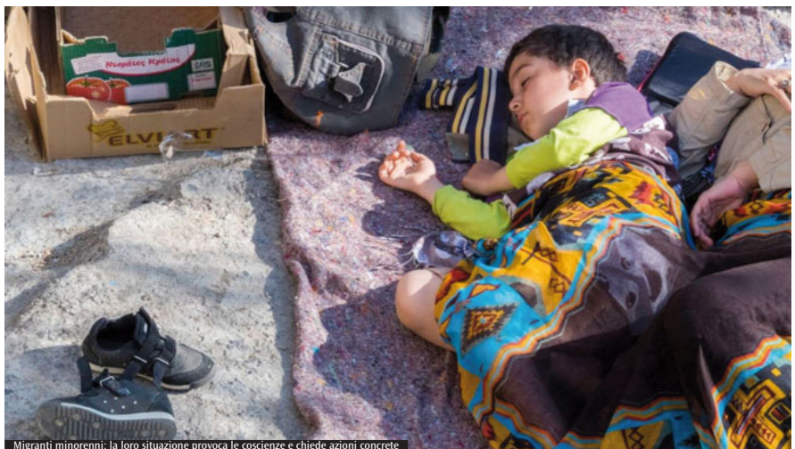
Migranti minorenni: la loro situazione provoca le coscienze e chiede azioni concrete

realizzato con il progetto "Casa Madre Veronica" nella vicina zona di Casalotti. Per la diocesi di Rieti, nel progetto Sprar affidato dal Comune alla Caritas sono al momento assistiti (nel percorso di assistenza rifugiati con attività di inserimento) 32 adulti (24 uomini e 8 donne). Inoltre è stata la prima Diocesi nel Lazio ad avviare il progetto "Rifugiato in casa mia", strutturando un appartamento