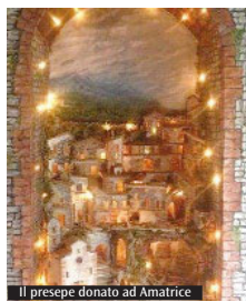
Il presepe donato ad Amatrice