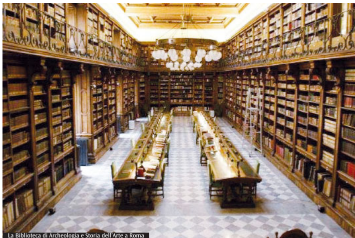
La Biblioteca di Archeologia e Storia dell'Arte a Roma

Festival «L'albatros» per la letteratura di viaggio, istituito dal Comune di Palestrina (RM); il «Cubo Festival» della Città di Ronciglione (VT); il Festival «Pagine a colori... 0-99» del Comune di Tarquinia (VT). Tra le altre iniziative vincitrici del bando, oltre alle molte presenti sul territorio di Roma e dintorni, interessanti anche quelle presenti nelle altre province: a Viterbo il progetto «Librimmaginari» dell'ARCI - Comitato provinciale di Viterbo, a Rieti l'Associazione Amici di Liberi sulla carta per la «Fiera liberi sulla carta». In provincia di Latina riceveranno finanziamenti dal bando i progetti «Un libro per tutti» (biblioteca per bambini) del Comune di Formia e