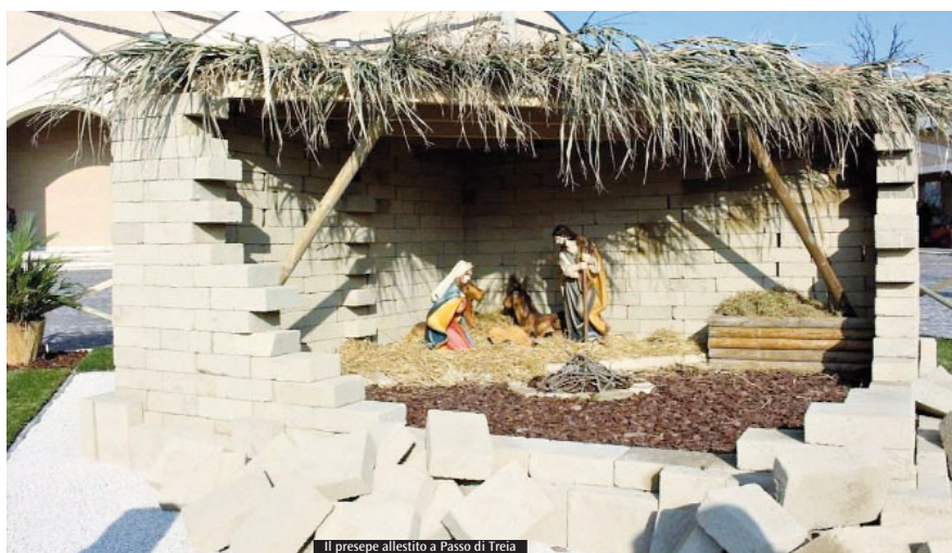
Il presepe allestito a Passo di Treia