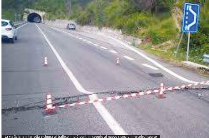
La via Salaria interrotta e chiusa al traffico in più punti in seguito al nuovo sisma di mercoledì scorso

temporaneamente allestita ad Amatrice si sono svolte le lezioni, mentre sono rimaste chiuse le scuole di Posta, Borgo Velino, Castel Sant'Angelo e Antrodoco. Circa 80 persone, poi, hanno alloggiato nei quattro campi della Regione Lazio di Amatrice, Saletta, Sommati e Torrita. In tanti, spaventati, mercoledì sera hanno chiesto di dormire in tenda, trovando ospitalità nelle tendopoli ancora aperte. Sono state inoltre disposte verifiche a tappeto in tutte le frazioni dei comuni colpiti e, per sicurezza, sono stati ricontrollati anche i ponti che non hanno riportato danni, mentre i tecnici della Protezione civile e del Genio civile sono a disposizione