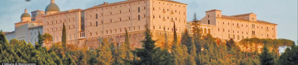
L'Abbazia di Montecassino