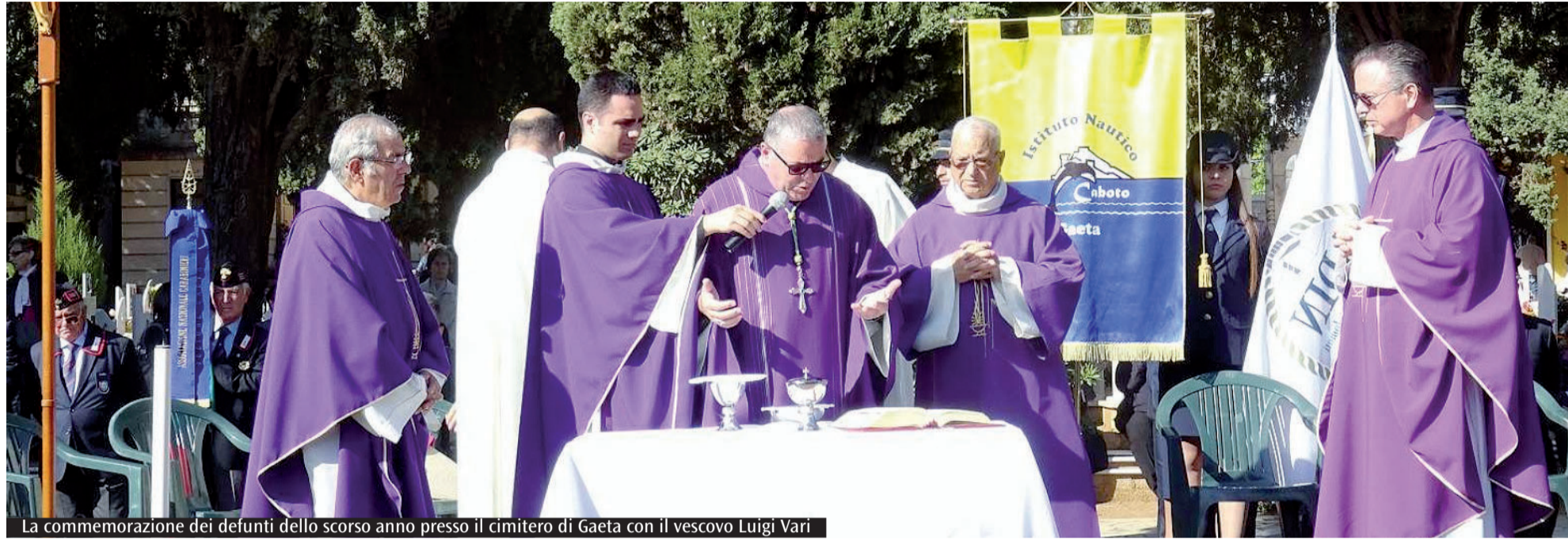
La commemorazione dei defunti dello scorso anno presso il cimitero di Gaeta con il vescovo Luigi Vari

Venerdì al cimitero di Gaeta il vescovo Luigi Vari presiederà la Messa alla quale parteciperanno le autorità