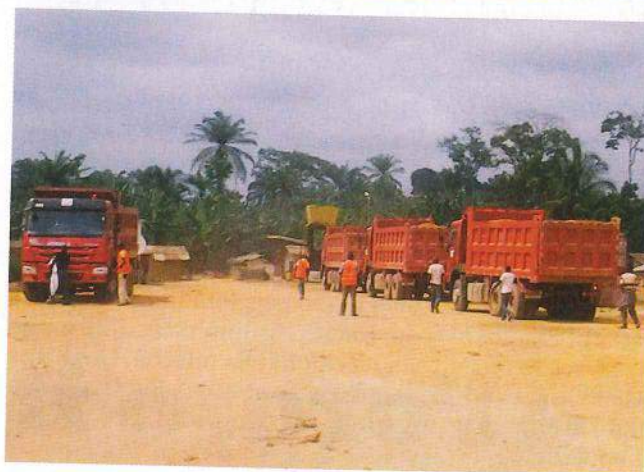
GIACIMENTI SENZA BENEFICI Impianti e mezzi per l'estrazione di petrolio nella foresta del Congo Brazzaville. A sinistra, uno dei villaggi nella zona delle estrazioni: il petrolio non ha cancellato la povertà