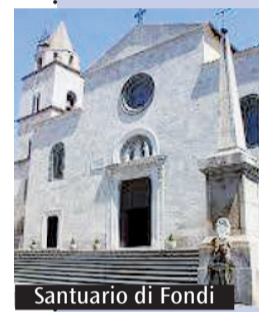
Santuario di Fondi