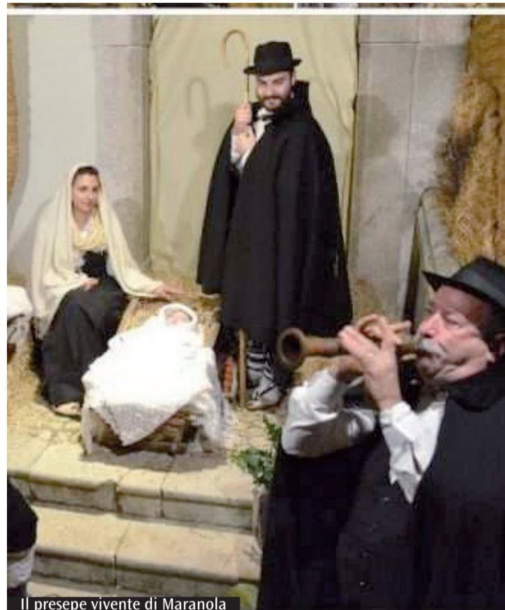
Il presepe vivente di Maranola

G li uffici e servizi pastorali della curia diocesana saranno chiusi al pubblico da domani fino al 6 gennaio per le festività natalizie. Anche Lazio Sette va in pausa: nel 2019 sono state prodotte 46 pagine diocesane, tutte disponibili su arcidiocesigaeta.it » Vita diocesana » Avvenire, oltre 320 articoli scritti da oltre 60 collaboratori, tra i quali 12 giornalisti. Buone feste. (M.D.R.)