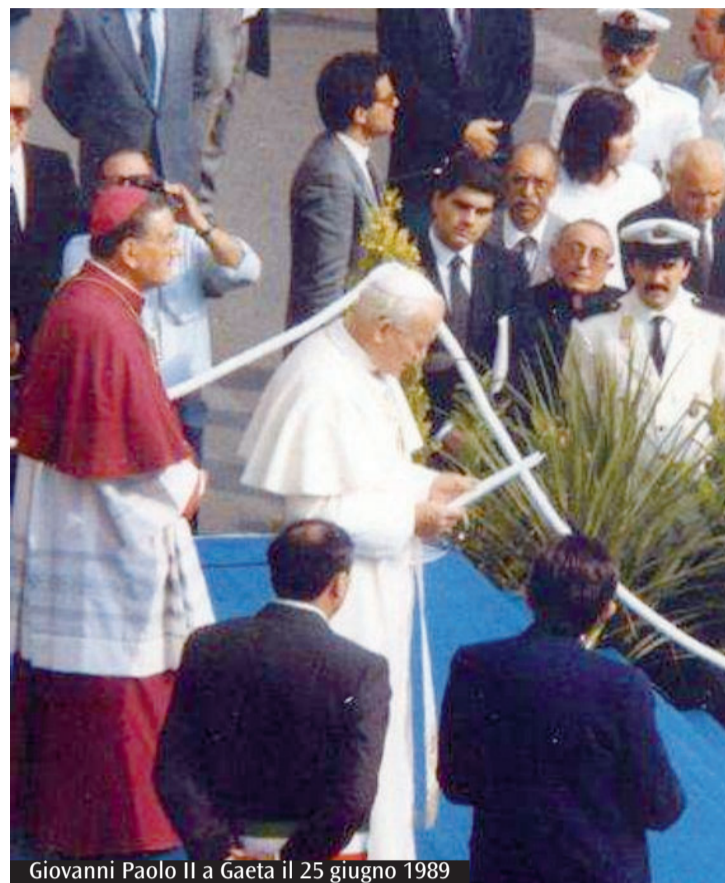
Giovanni Paolo II a Gaeta il 25 giugno 1989

R adio Civita InBlu sta offrendo alle imprese del territorio una campagna comunicativa di un mese totalmente a costo zero. L'offerta si rivolge alle aziende che hanno avuto una riduzione di orario lavorativo a seguito dell'ultimo Dpcm, come ristoranti, pizzerie, bar o pasticcerie: un'idea per pubblicizzare a sporto e consegne a domicilio. Info al 3493736518 o info@radiocivitaibl.it. M.D.R.