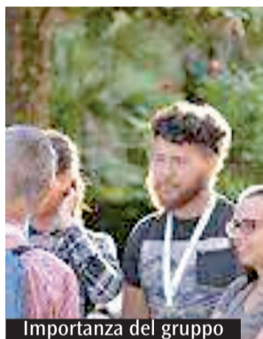
Importanza del gruppo

A ll'indomani della pubblicazione dell'enciclica Fratelli tutti , con la quale papa Francesco ci esorta a vivere con uno stile di vita fraterno e di amicizia sociale, il settore giovani e l'Azione cattolica dei ragazzi della diocesi di Gaeta hanno ideato e presentato i rispettivi percorsi di formazione rivolti ai responsabili associativi ed educativi parrocchiali. Come ricorda il progetto formativo di Ac, «non è sempre facile conservare attenzione alla persona; talvolta ci si illude di essere più efficaci privilegiando le attività di gruppo o l'organizzazione. Senza rischiare di mettere in contrapposizione elementi che devono restare uniti, crediamo che oggi, nella formazione, sia necessario accentuare l'attenzione alla singolarità del cammino di ogni persona». Abbiamo pensato infatti che, alla luce di questo periodo complesso del tutto inaspettato, fosse