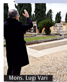
Mons. Luigi Vari

I n questa domenica di novembre, solennità di tutti i santi, la Chiesa si raccoglie in preghiera per la santificazione universale. Una richiesta corale a Dio onnipotente ed eterno che dona «alla Chiesa la gioia di celebrare in un'unica festa i meriti e la gloria di tutti i Santi»: oggi alle 11 in cattedrale a Gaeta la celebrazione presieduta dal vescovo Luigi Vari. Domani, invece, nella commemorazione dei fedeli defunti del 2 novembre la Chiesa rivolgerà a Dio un'implorazione affinché ascolti «la preghiera che la comunità dei credenti innalza nella fede del Signore risorto». Quest'anno le celebrazioni in tutti i comuni della diocesi sono condizionate dalla pandemia in corso: non vi saranno le tradizionali Messe al cimitero, come da tradizione. Tra gli appuntamenti rimandati vi è anche l'esecuzione del Requiem di Gabriel Fauré programmato per stasera nella chiesa di Santa Maria in