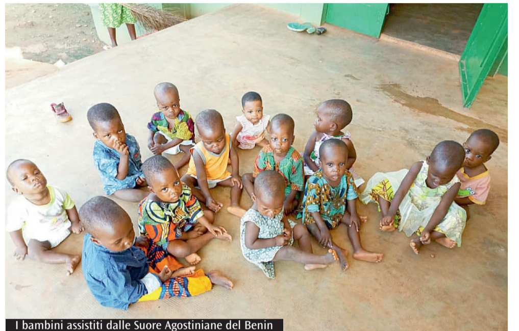
I bambini assistiti dalle Suore Agostiniane del Benin

dignità a poveri e fragili, per non dimenticare mai che siamo tutti collegati, come membra dello stesso corpo e se una delle membra soffre il resto del corpo non può dirsi sano né mostrarsi indifferente, perché la sofferenza e la fragilità di una parte di umanità appartiene a tutti. Domenica 12 dicembre le offerte raccolte nella celebrazione eucaristica in ognuna delle nostre comunità parrocchiali saranno devolute a sostenere il centro di accoglienza, assistenza ed educazione delle Suore Agostiniane del Benin, nella città di Sakété, a circa