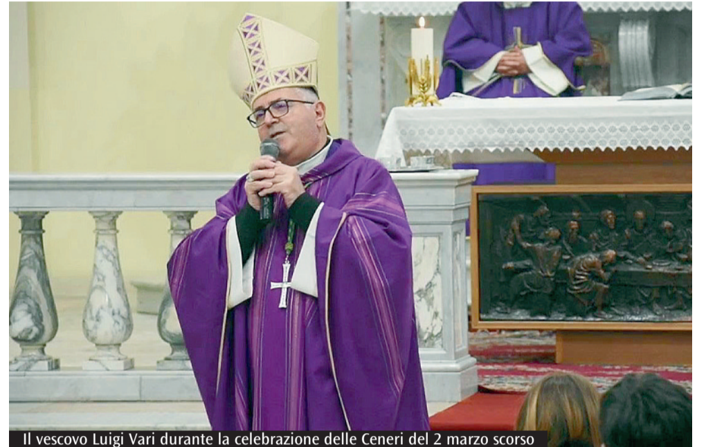
Il vescovo Luigi Vari durante la celebrazione delle Ceneri del 2 marzo scorso

nuovo, prodotti per l'igiene. Per chi vuole fare una donazione in denaro, invece, può inviare un bonifico all'arcidiocesi di Gaeta all'iban IT53A 02008 73990 000 400 233 228 con la causale "Emergenza Ucraina". L'appello maggiore, però, rimane quello sull'accoglienza dei profughi. La Caritas di Gaeta ha messo a disposizione le proprie strutture pur sapendo che si satureranno presto. Per questo chiunque voglia rendersi disponibile può scrivere a emergenza@arcidiocesigaeta@gmail.com.