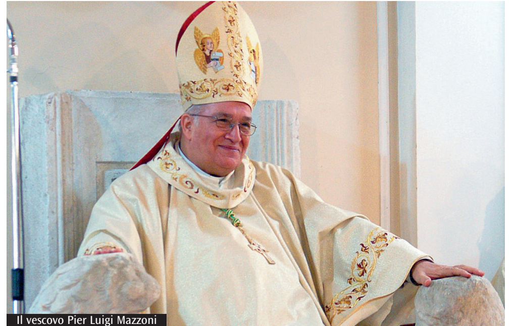
Il vescovo Pier Luigi Mazzoni

giorno quella citazione del vescovo di Ippona. Con noi è stato "cristiano": lo ricordiamo tutti per l'amabilità e cordialità, per il sorriso, per l'attenzione e la disponibilità che sempre accordava. Non poche volte, durante gli anni in cui gli sono stato accanto, mi ha ripetuto: «La prima carità che dobbiamo usare nei confronti del prossimo è quella di fargli fare poca fatica nel volerli bene». Nel rapporto con i presbiteri, che considerava davvero suoi "primi collaboratori", anteponeva al "ruolo" l'attenzione paterna e fraterna: ogni