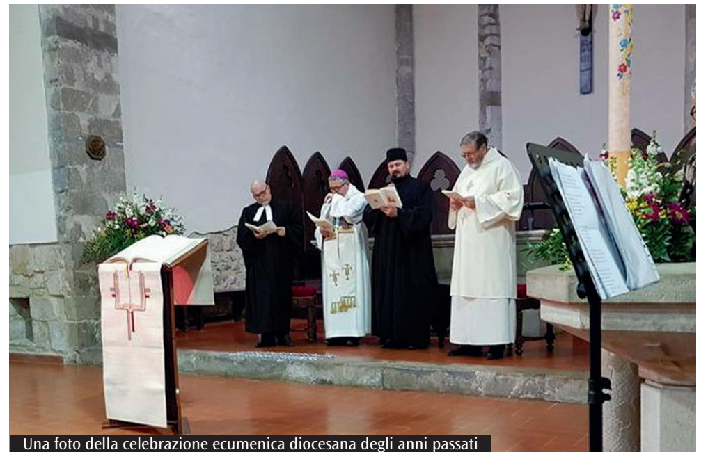
Una foto della celebrazione ecumenica diocesana degli anni passati

storia degli Stati Uniti, quando trentotto indigeni Dakota furono impiccati a Mankato, il giorno dopo Natale. Mentre si preparavano a morire, i trentotto Dakota cantarono l'inno Wakantanka taku nitawa (Molti e Grandi) una cui versione, anche italiana, è inclusa nella celebrazione ecumenica della settimana che ci si appresta a festeggiare. Più recentemente, il Minnesota è stato l'epicentro della resa dei conti razziale. Quando il Covid-19 ha chiuso il mondo nel marzo del 2020, l'omicidio di un giovane afro americano, George Floyd,