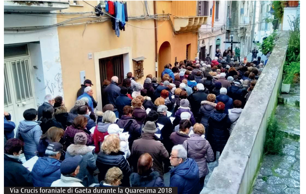
Via Crucis foranale di Gaeta durante la Quaresima 2018

concelebrazione con tutti i sacerdoti della città e poi alle 20 e alle 21 la liturgia Penitenziale animata rispettivamente dagli adulti e dai giovani. Si tratta di un momento forte del periodo di Quaresima che, i parroci delle comunità di Fondi hanno deciso di condividere con le proprie comunità e di vivere insieme. Un'occasione per potersi riconciliare con il Signore in vista della Pasqua e riavvicinarsi in questo modo al sacramento della Confessione.