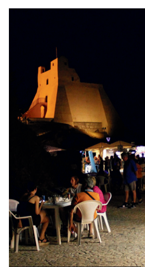
Torre Truglia e gli stand