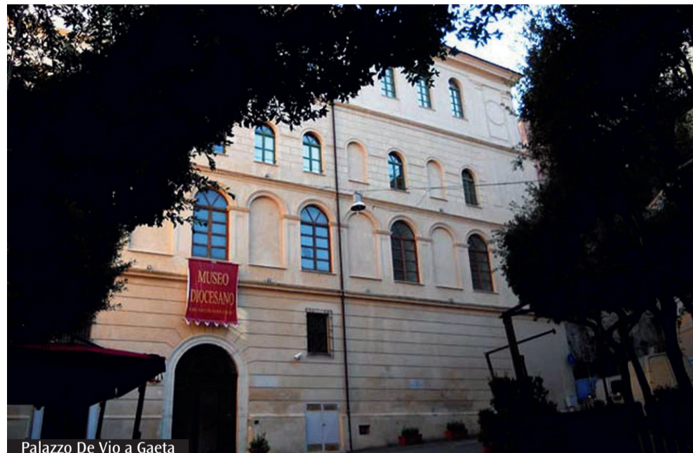
Palazzo De Vio a Gaeta