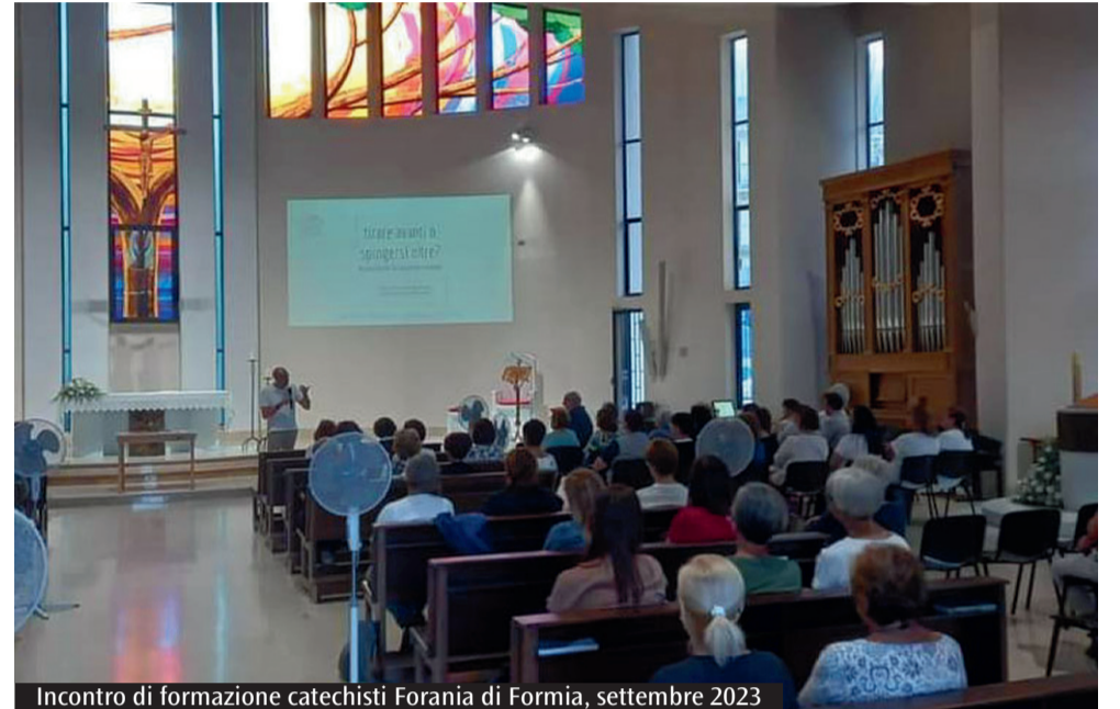
Incontro di formazione catechisti Forania di Formia, settembre 2023

ware Ospoweb ha l'obiettivo di sostenere in maniera più efficace l'attività di raccolta dati relativa alle persone in difficoltà da parte dei Centri di ascolto e dell'Osservatorio delle povertà e delle risorse presente in Caritas diocesana. Proprio per via dell'importanza dell'utilizzo di questo strumento e anche per una questione organizzativa, da Caritas chiedono ai responsabili e agli interessati di comunicare la partecipazione all'indirizzo mail info@caritasgaeta.it o con messaggio WhatsApp al numero 324 535 61 65.