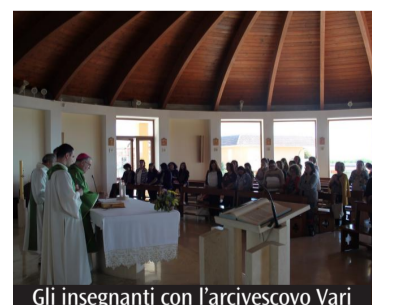
Gli insegnanti con l'arcivescovo Vari

Con questi sentimenti e pensieri l'arcivescovo Luigi Vari celebrerà l'Eucaristia in Cattedrale a Gaeta mercoledì 18 dicembre alle 18 per tutti i docenti; un momento di offerta e di sostegno per la sfida che ogni insegnante è chiamato a vivere in questo tempo. La celebrazione sarà anche l'occasione per presentare il vademecum «In Cammino sulle vie del Giubileo» per promuovere l'Anno Santo in tutte le scuole della nostra diocesi; verrà conse-